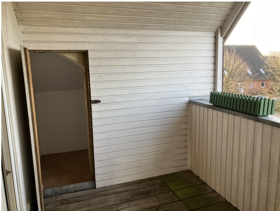
Loggia mit Abstellkammer außen