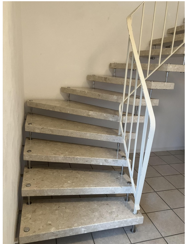
Zugang zur Wohnung