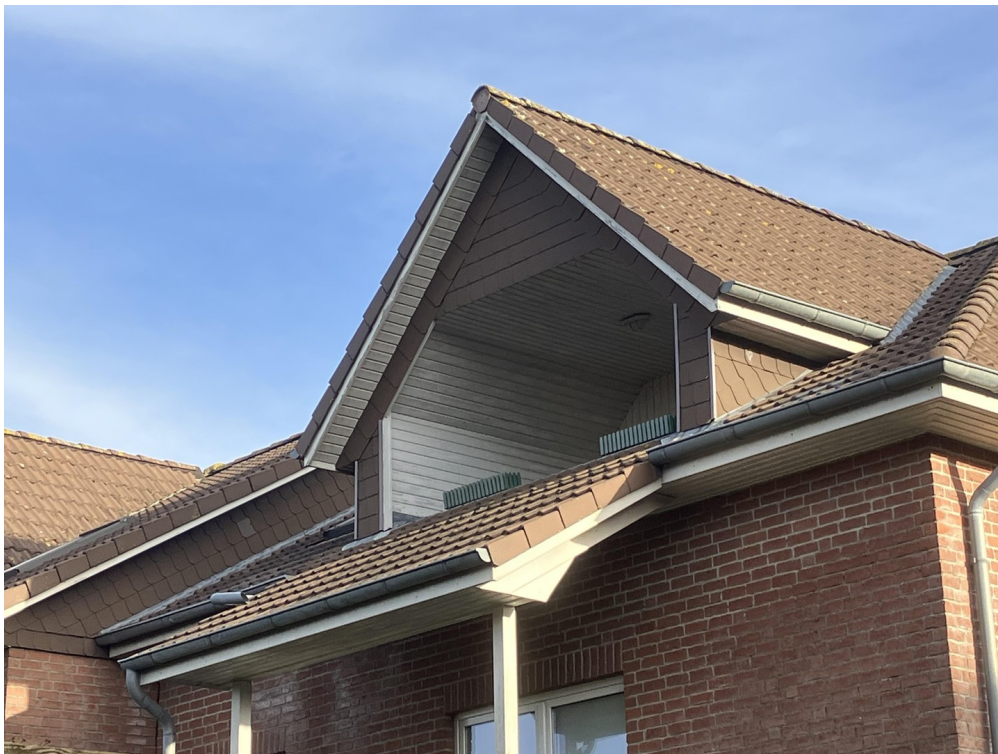
Blick auf die Loggia