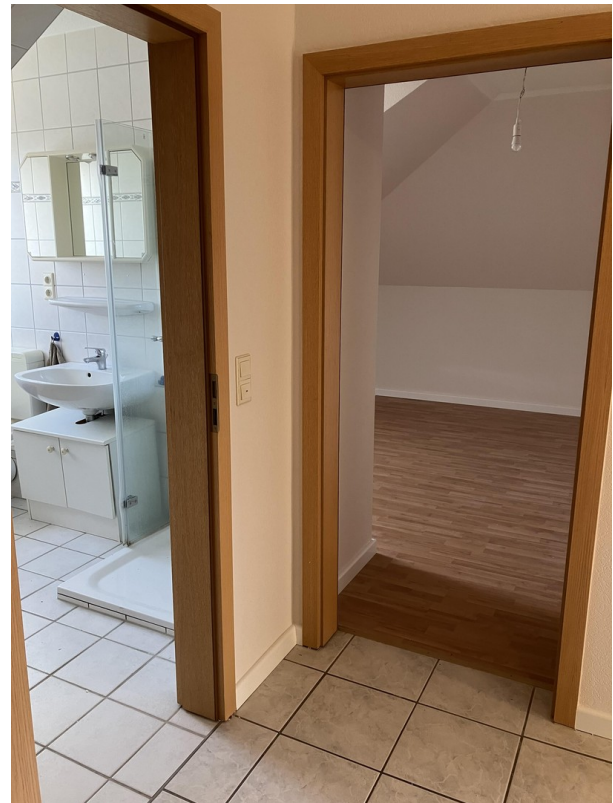
Blick aus dem Flur