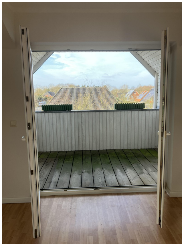
Zugang zur Loggia