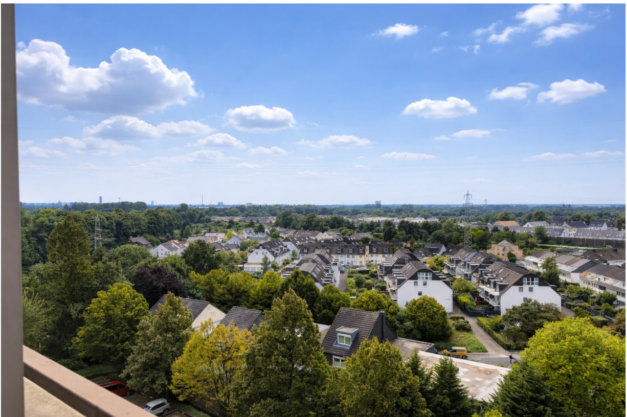
Blick aus Wohnung