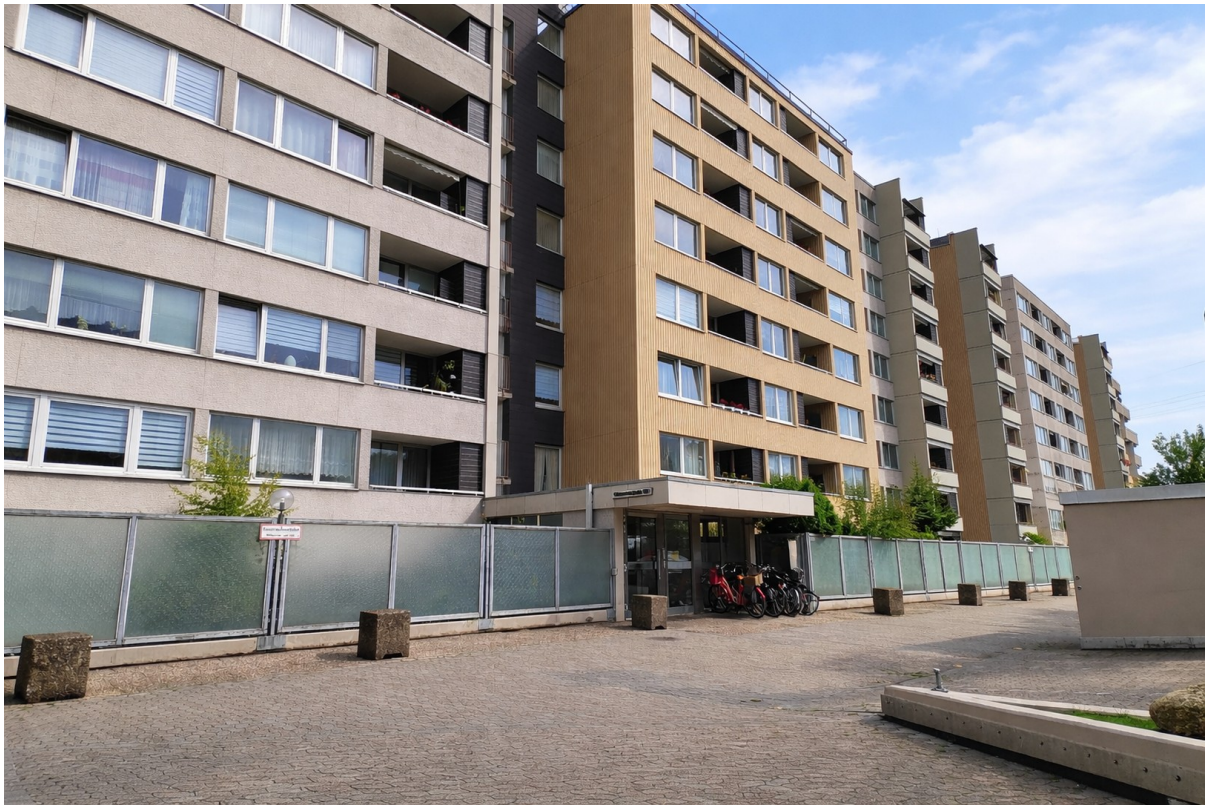
Außenblick aufs Haus