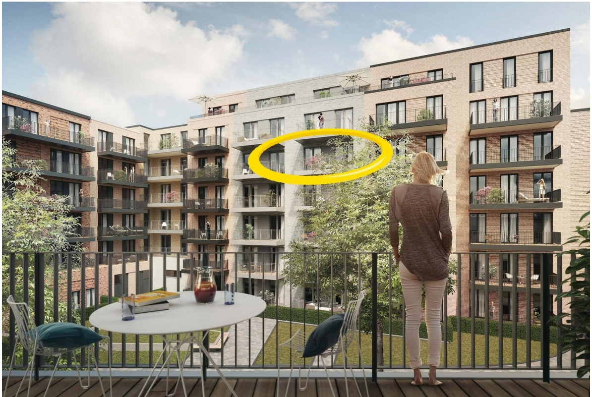
Lage der Wohnung