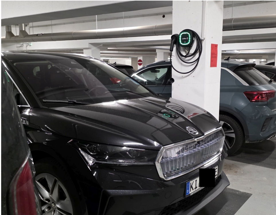
TG-Stellplatz mit Wallbox