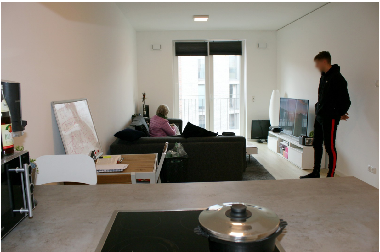
Blick von Küche in Wohnzimmer