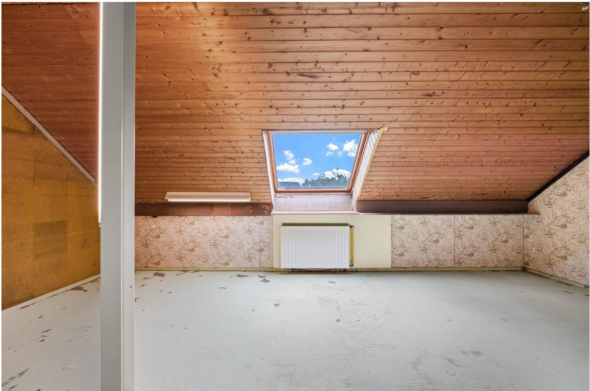
Schlafzimmer 1 OG