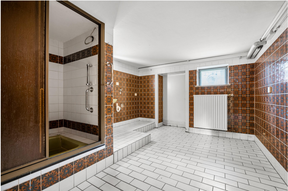
Waschküche mit Gartenausgang