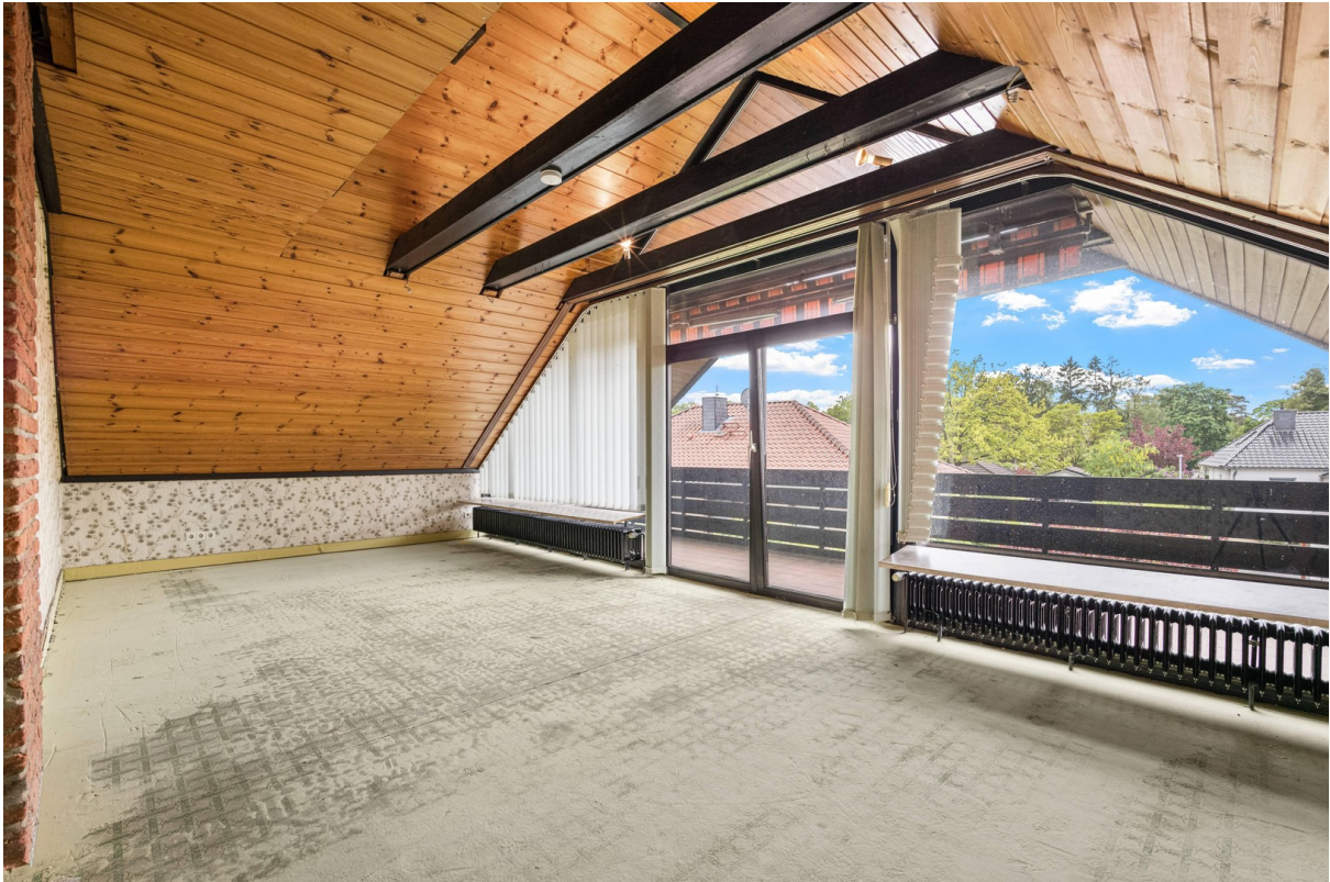
Schlafzimmer 2 OG