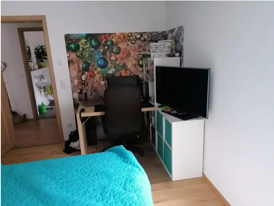
Büroecke um Schlafzimmer