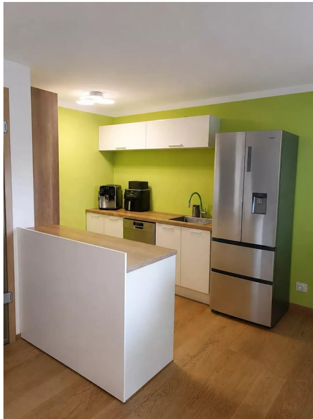
Kochbereich mit Einbauküche