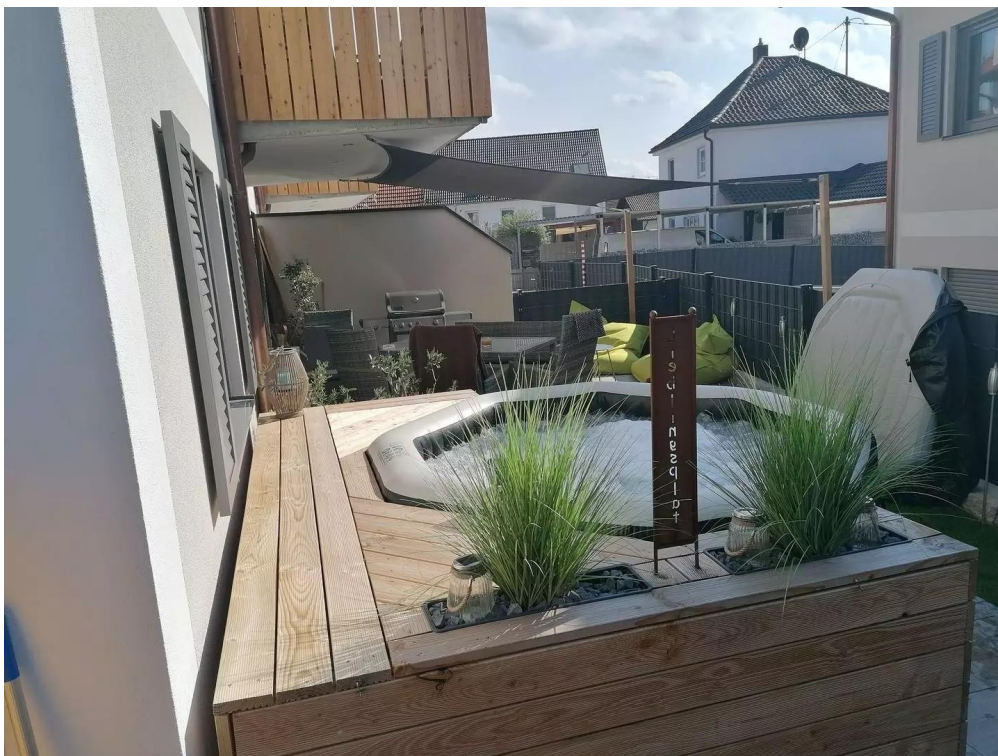
Terrasse mit Whirlpool