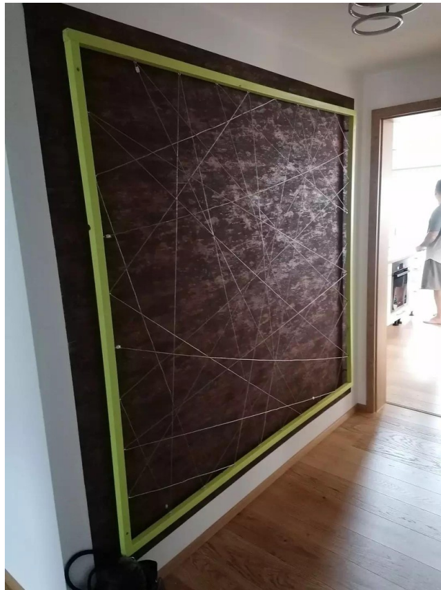
Fotowand im Hausgang