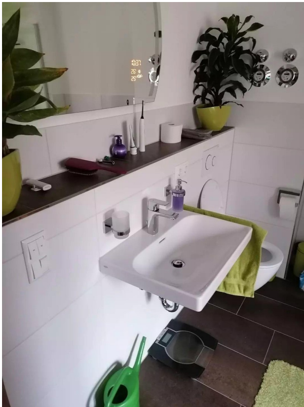
Waschbecken/WC im Hauptbad