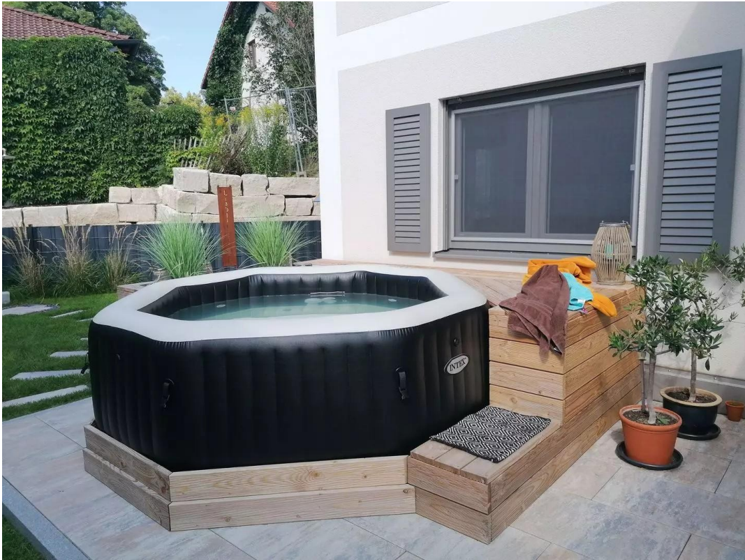
Whirlpool im Holzpodest