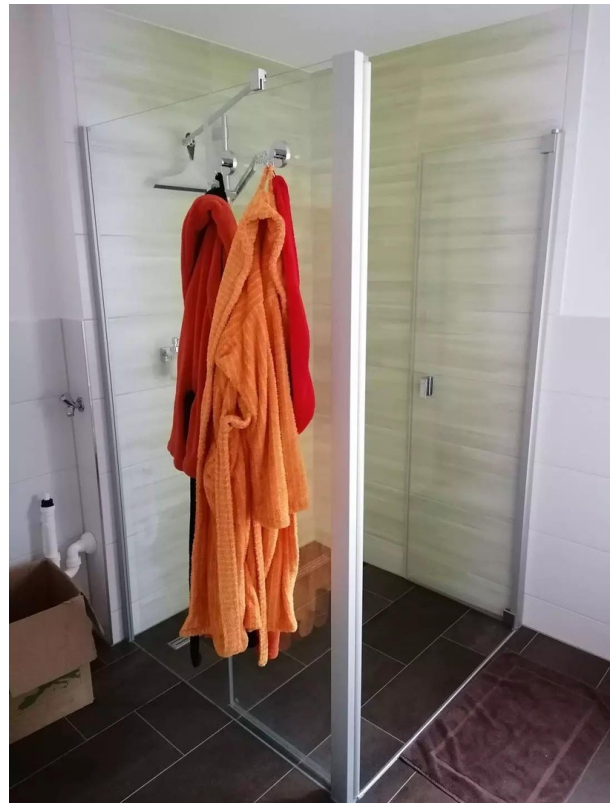
Dusche im Hauptbad