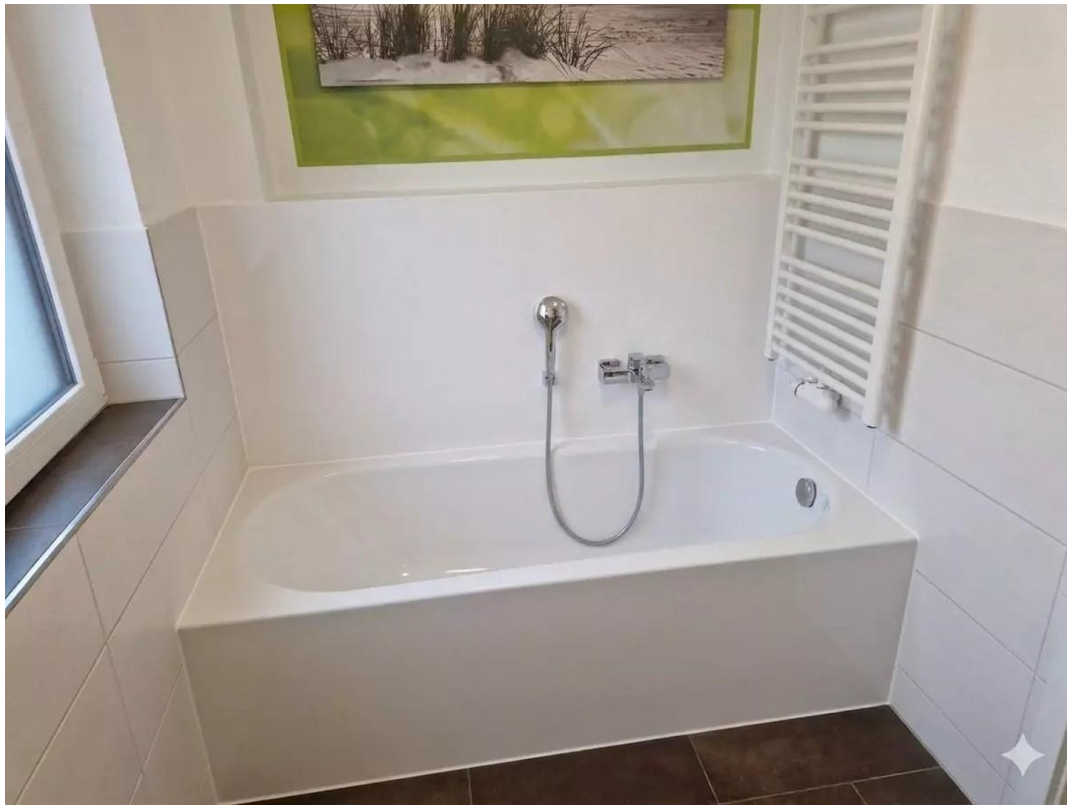
Badewanne im Hauptbad