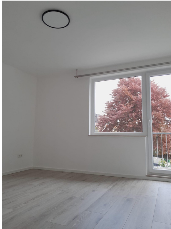
Schlafzimmer , 2. Balkon