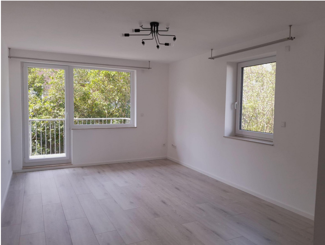
Wohnzimmer, 1. Balkon