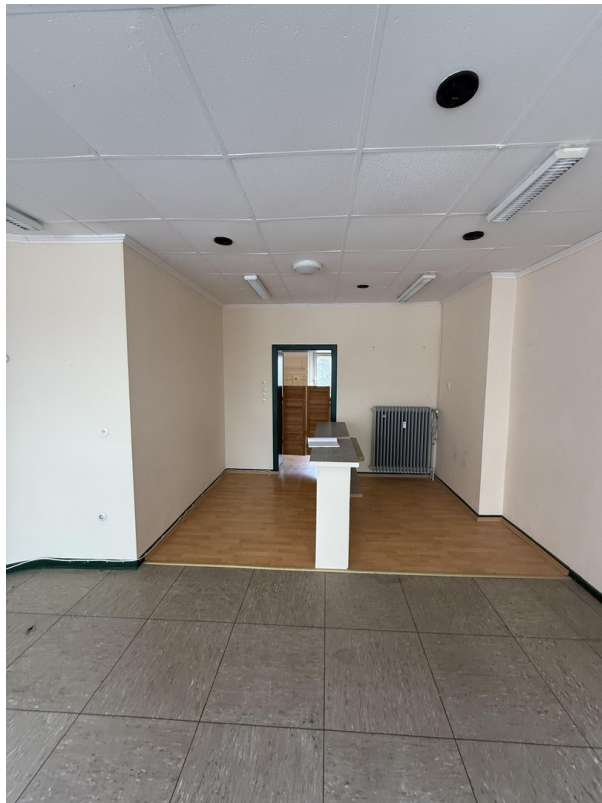
Übergang zum zweiten Raum