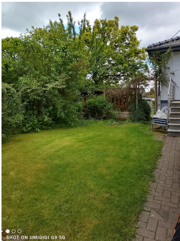
Eingang zum Haus