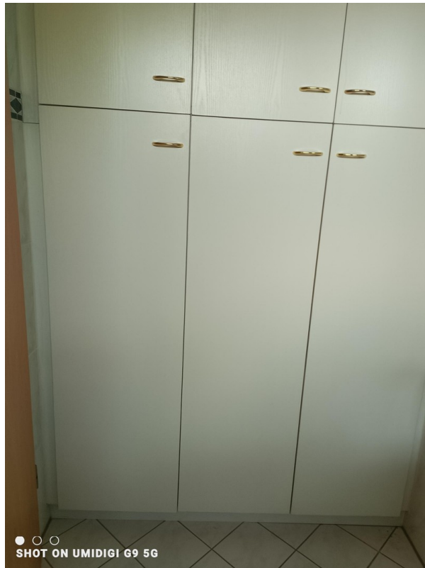
Einbauschränk im Gäste-WC