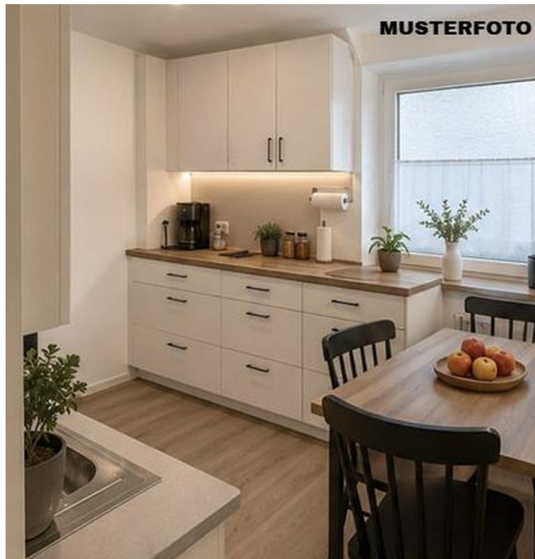
Küche - MUSTER