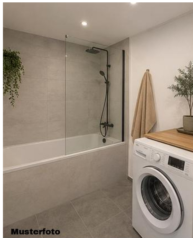
Bad - MUSTER