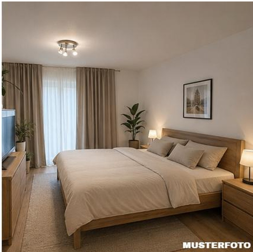
Schlafzimmer - MUSTER