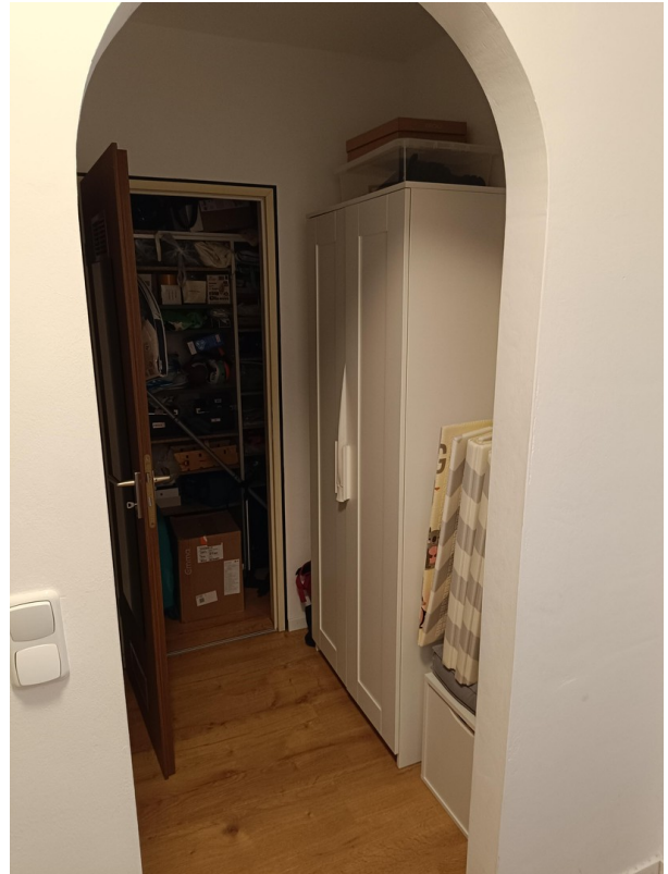
Garderobe + Abstellraum