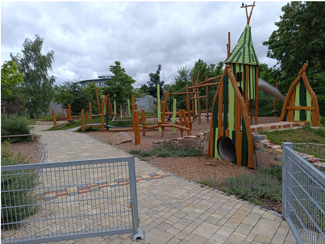
Spielplatz in der Nähe