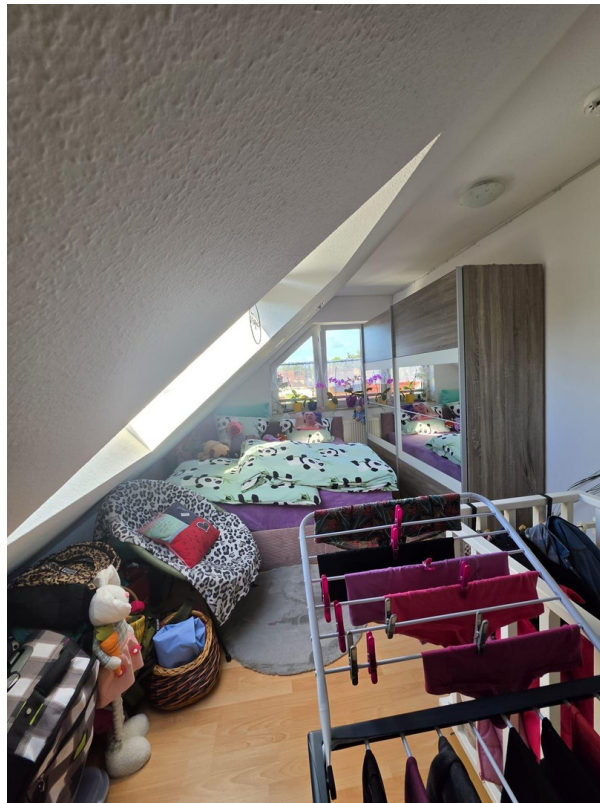
Schlafzimmer oder Arbeiten