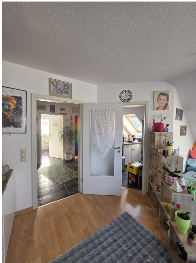
Blick in Flur und Küche