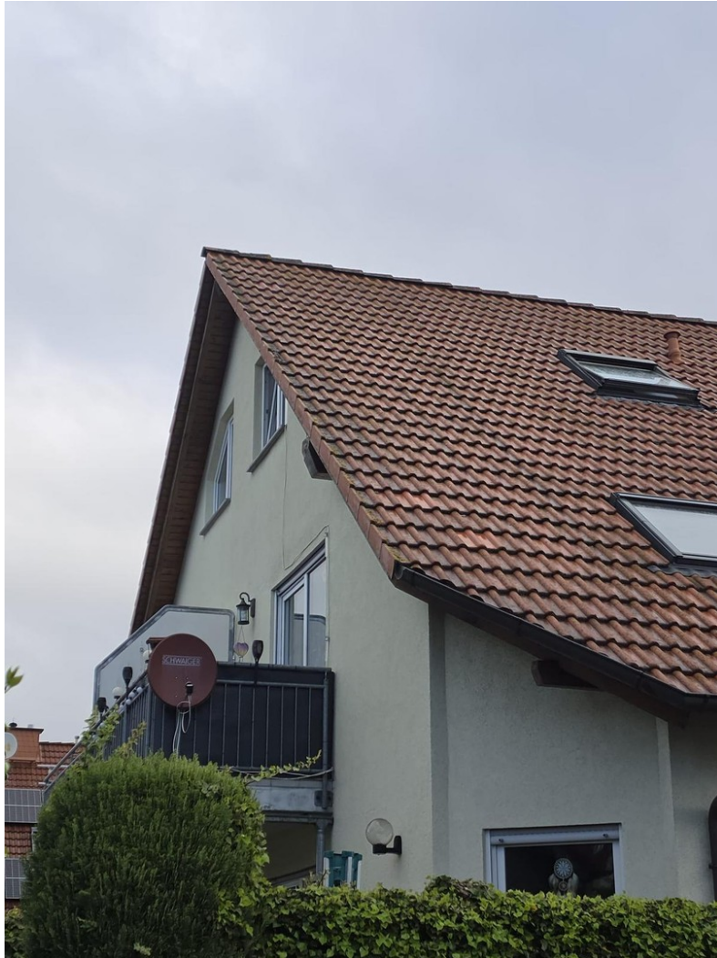
Sicht auf Balkon