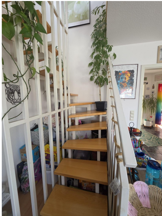
Verbindungstreppe ins DG