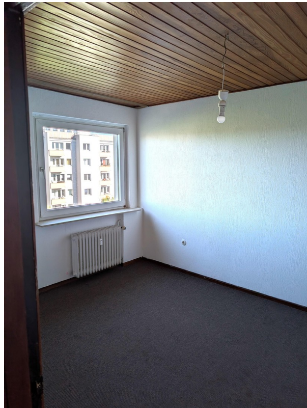
Schlafzimmer 2. Perspektive