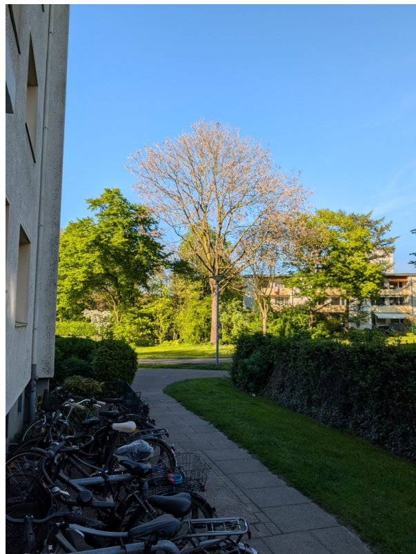
Wohnen im Grünen