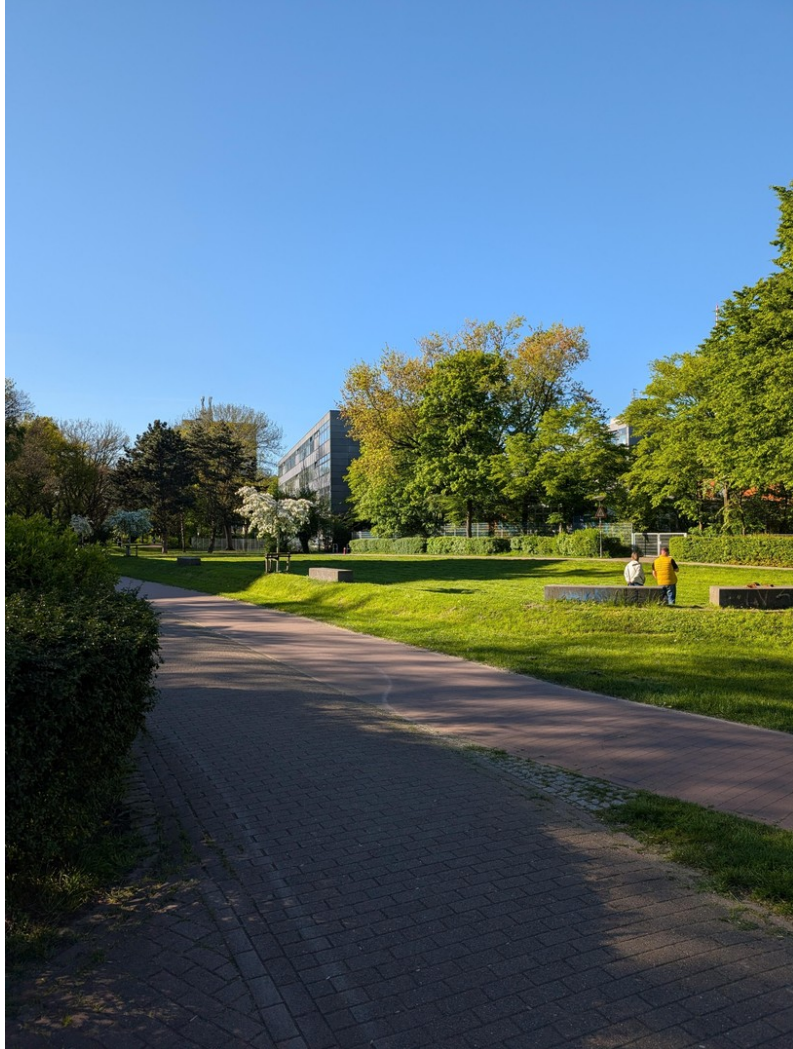
Ruhige Lage mit viel Grün