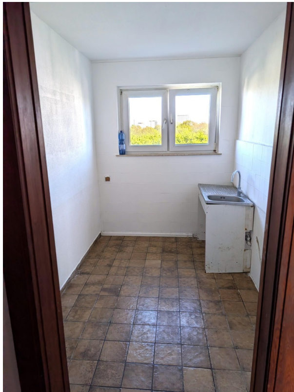
Küche mit Fenster