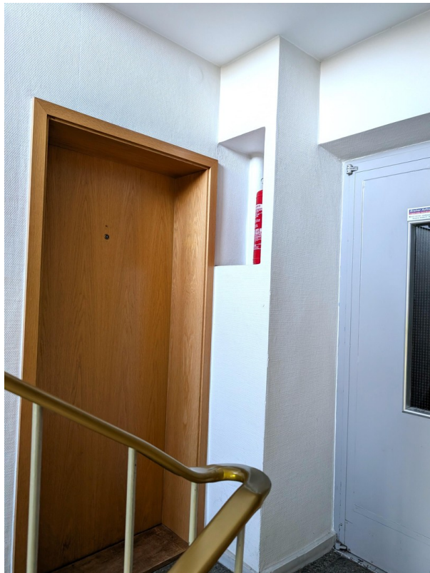
Eingangsbereich zur Wohnung