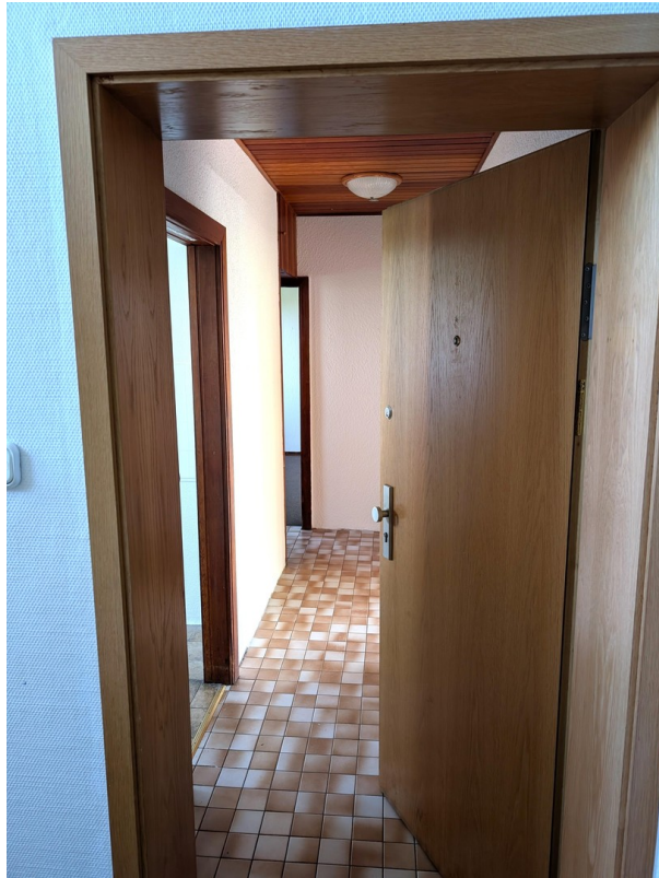
Gut geschnittener Flur