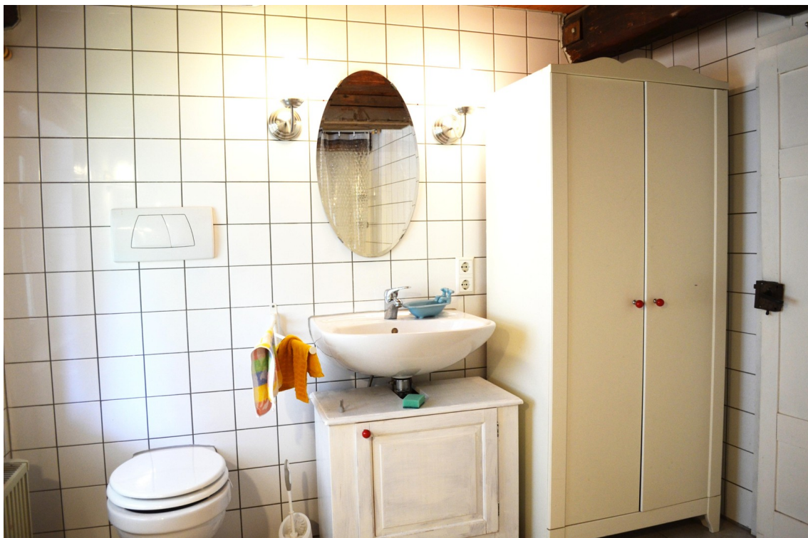
großes Bad im alten Wohnteil