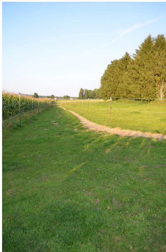
Rennstrecke auf dem Trail