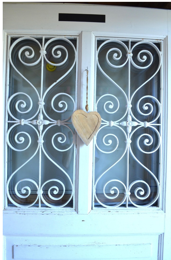
Haustüre alter Wohnteil