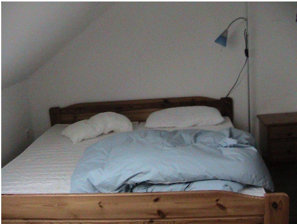
Mansarde im 2. Stock