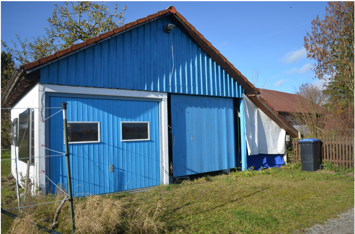
Garage und Carport