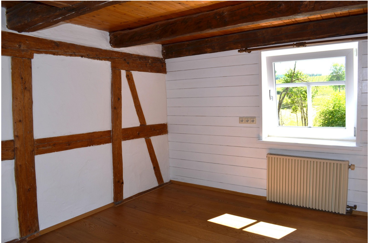
Zimmer nach Südwest