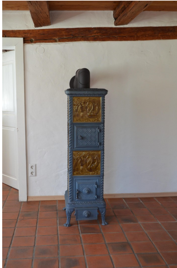
Jugendstilofen im Parterre