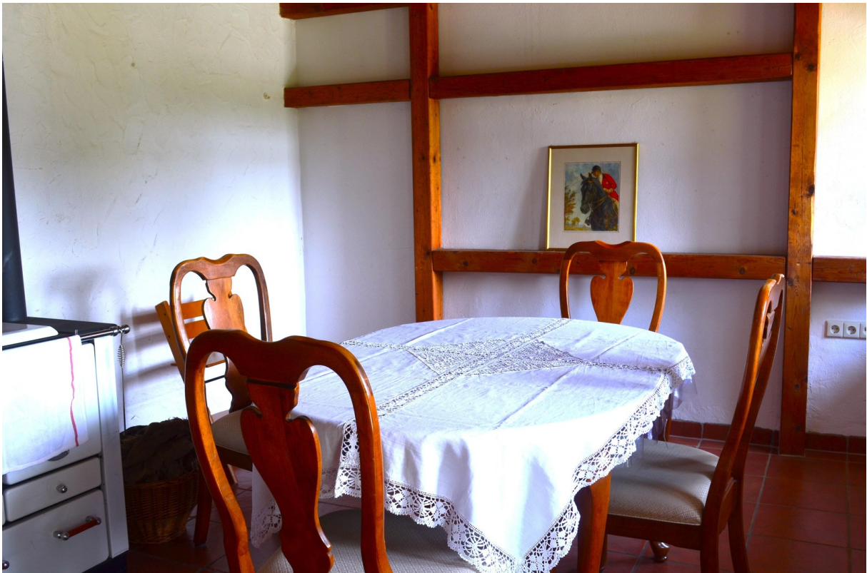
geräumiges Esszimmer dabei