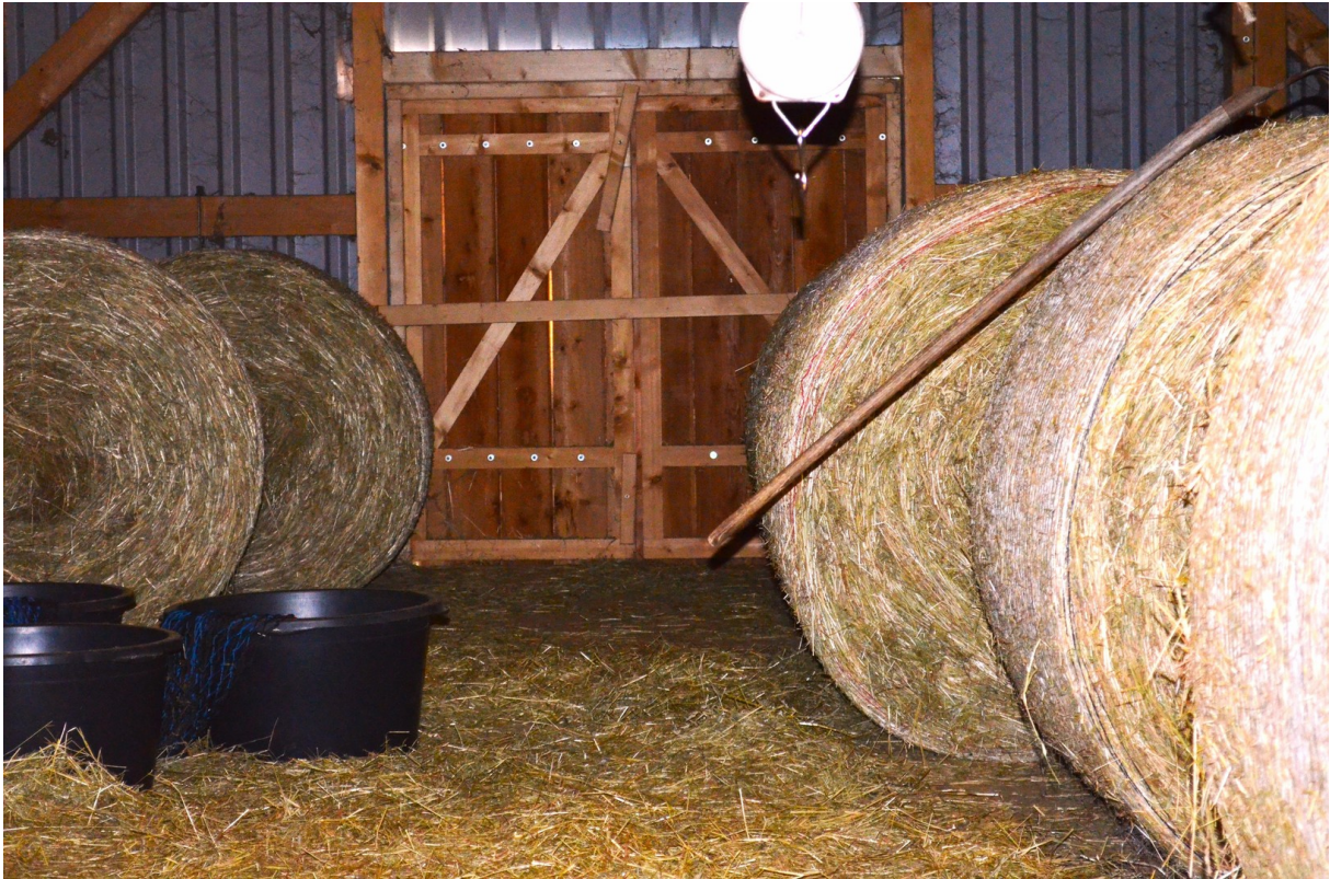
Tenne für Heu