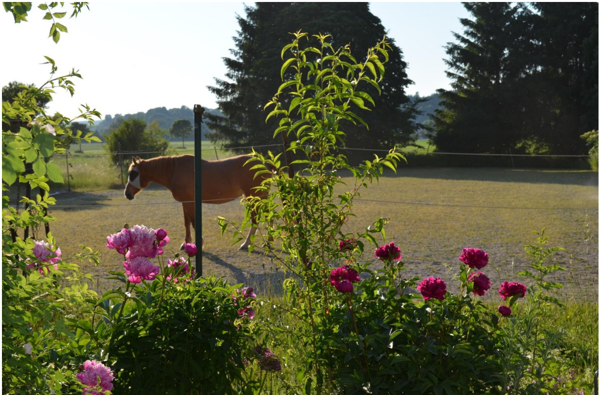
Blumen und Pferde