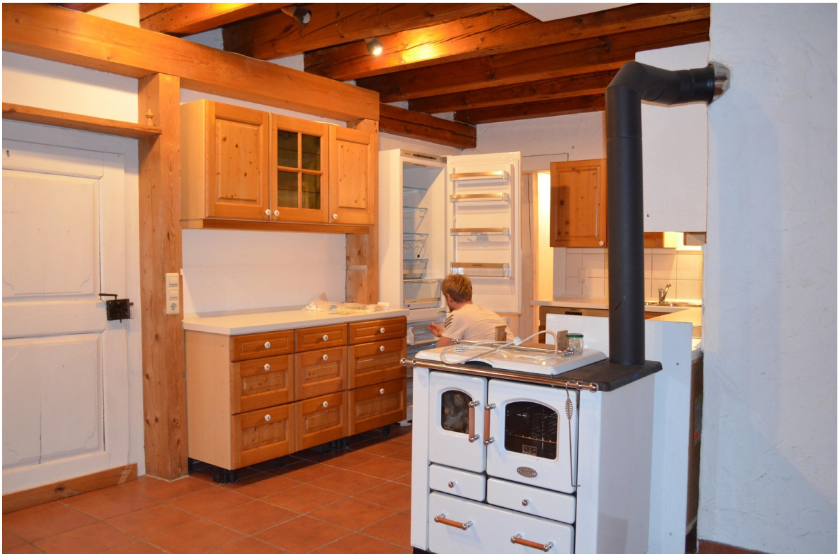
Wohnküche mit Ofen