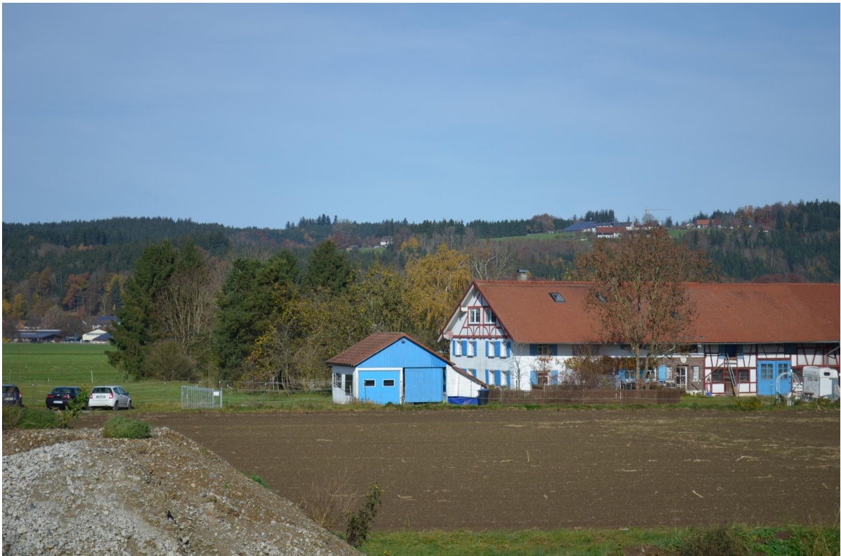
Vom Nachbarn aus fotografiert