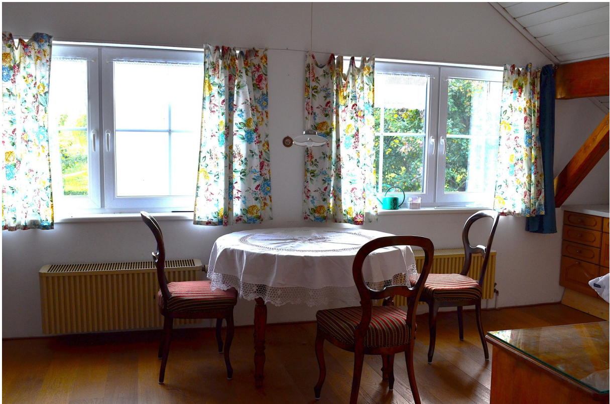
Südwestblick vom Dachstudio