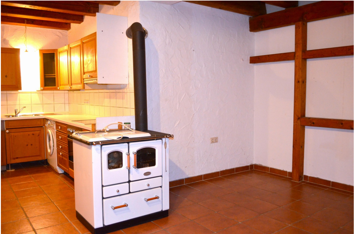
und Platz für Esszimmer