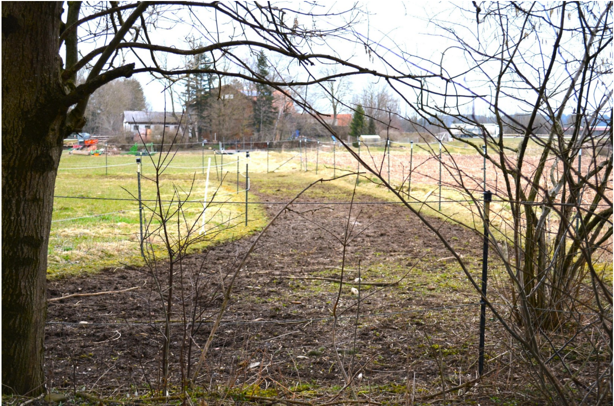
Trail teilweise unter Bäumen