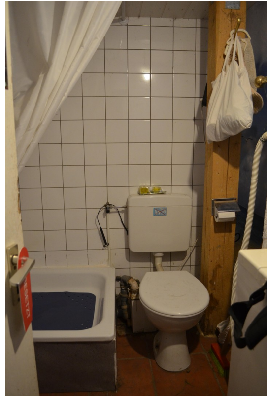
Reiter WC bei der Sattelkammer