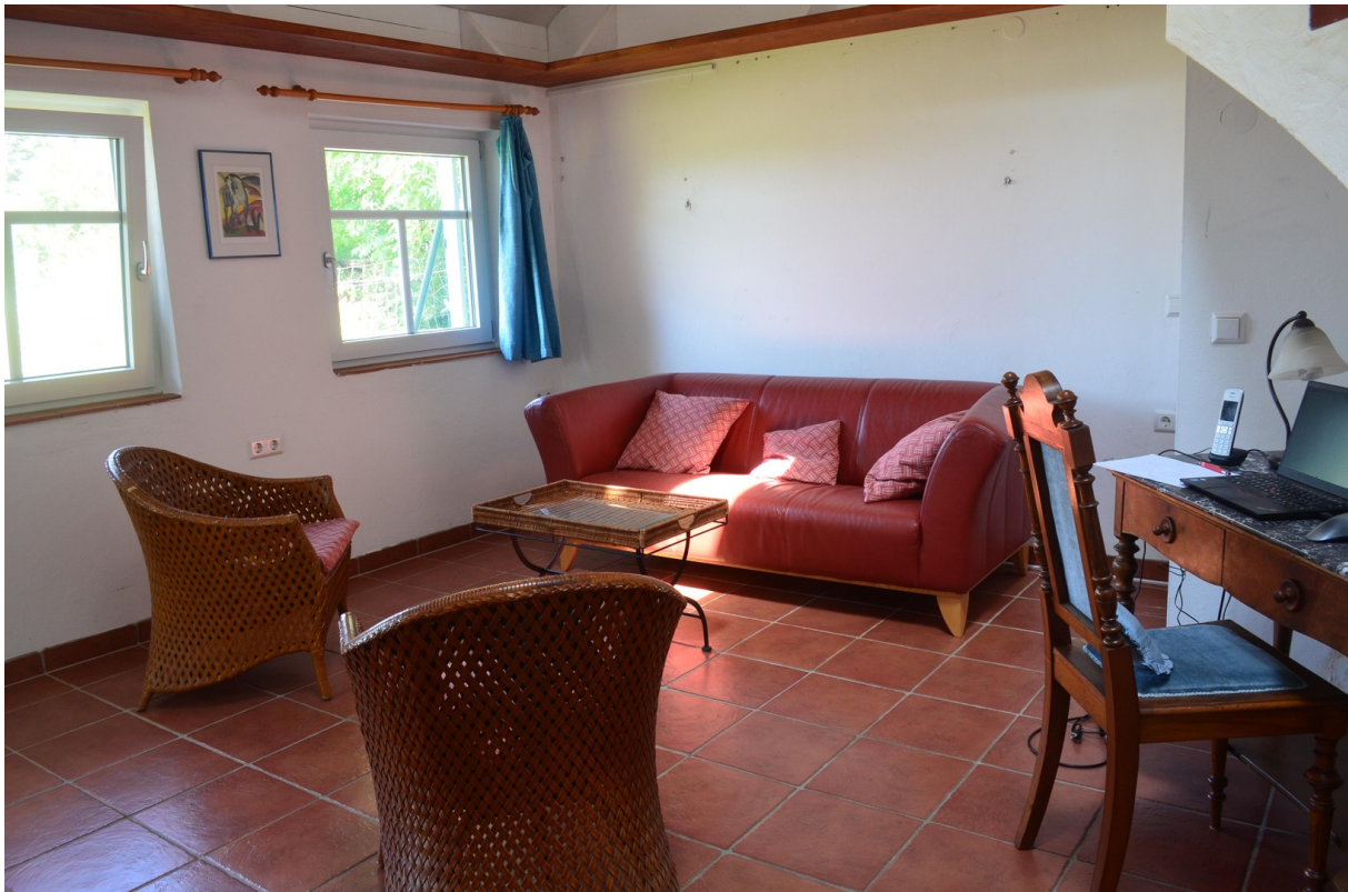
Wohnzimmer neue Wohnung