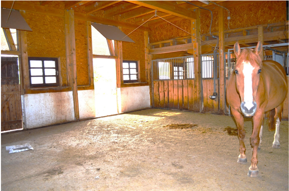
80 qm Unterstand im Stall