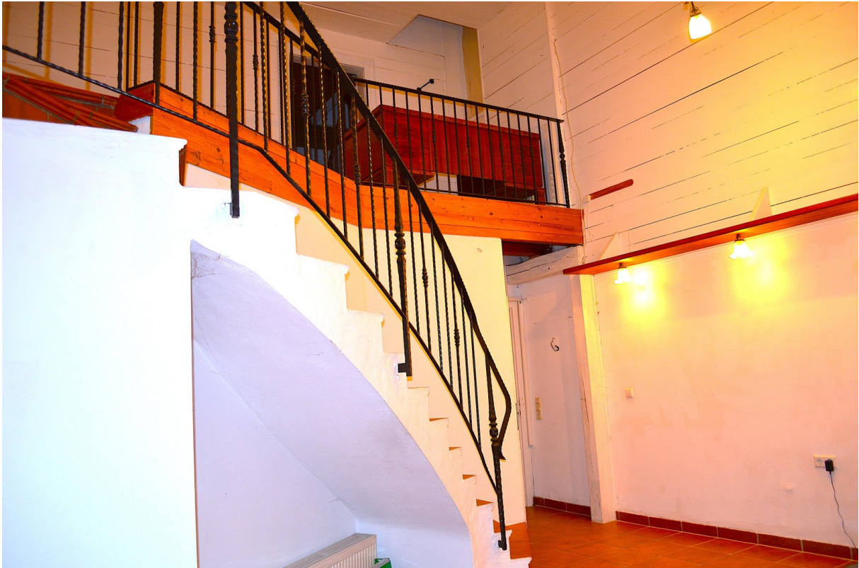
Treppe zur Galerie