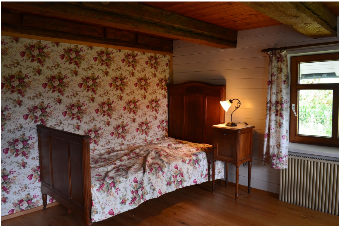
Schlafzimmer alter Wohnteil