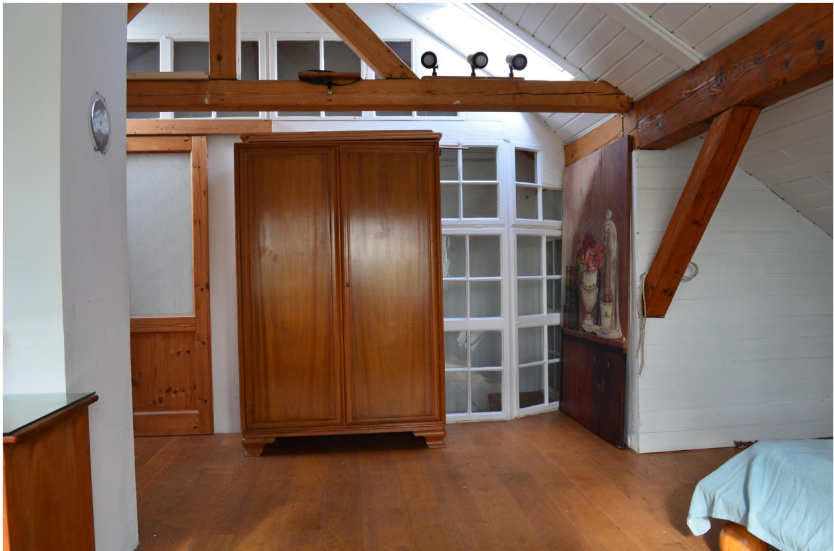
...mit Licht für die Treppe