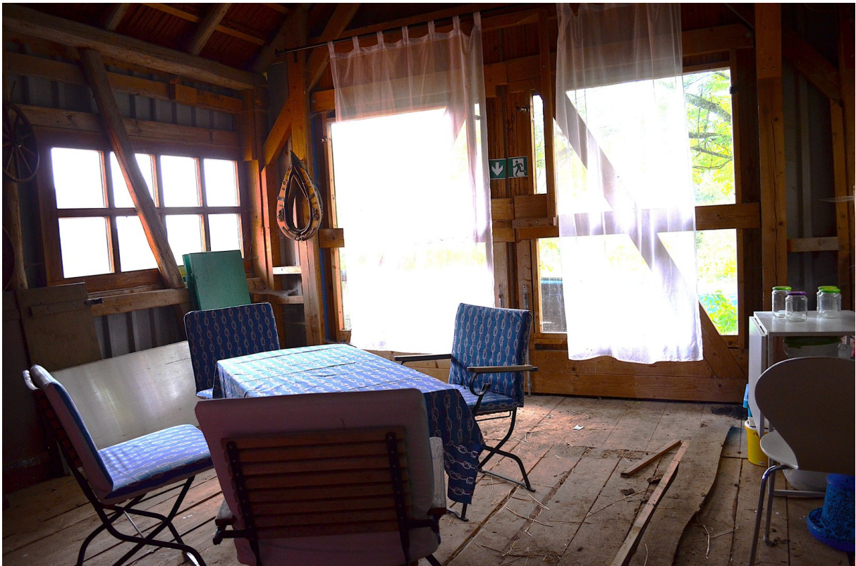
Hocheinfahrt zum Wintergarten