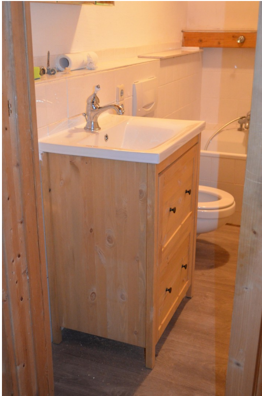
kleines Bad im neuen Wohnteil