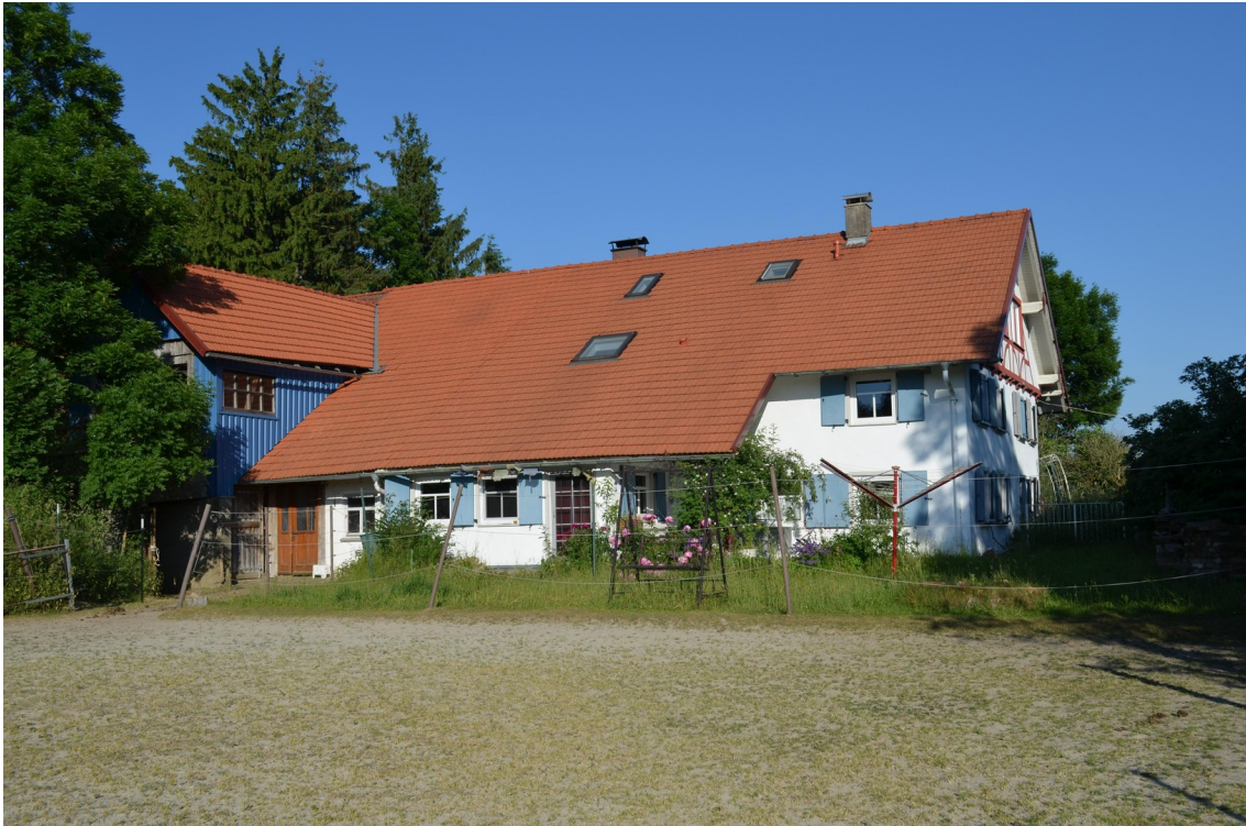
vom Sandplatz aus