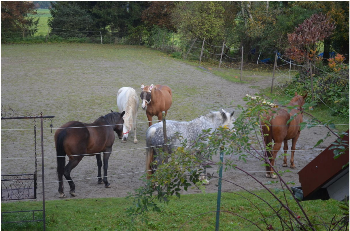
Dösen auf dem Sandplatz