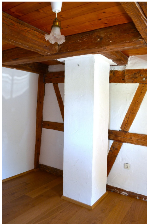
beide Kamine saniert