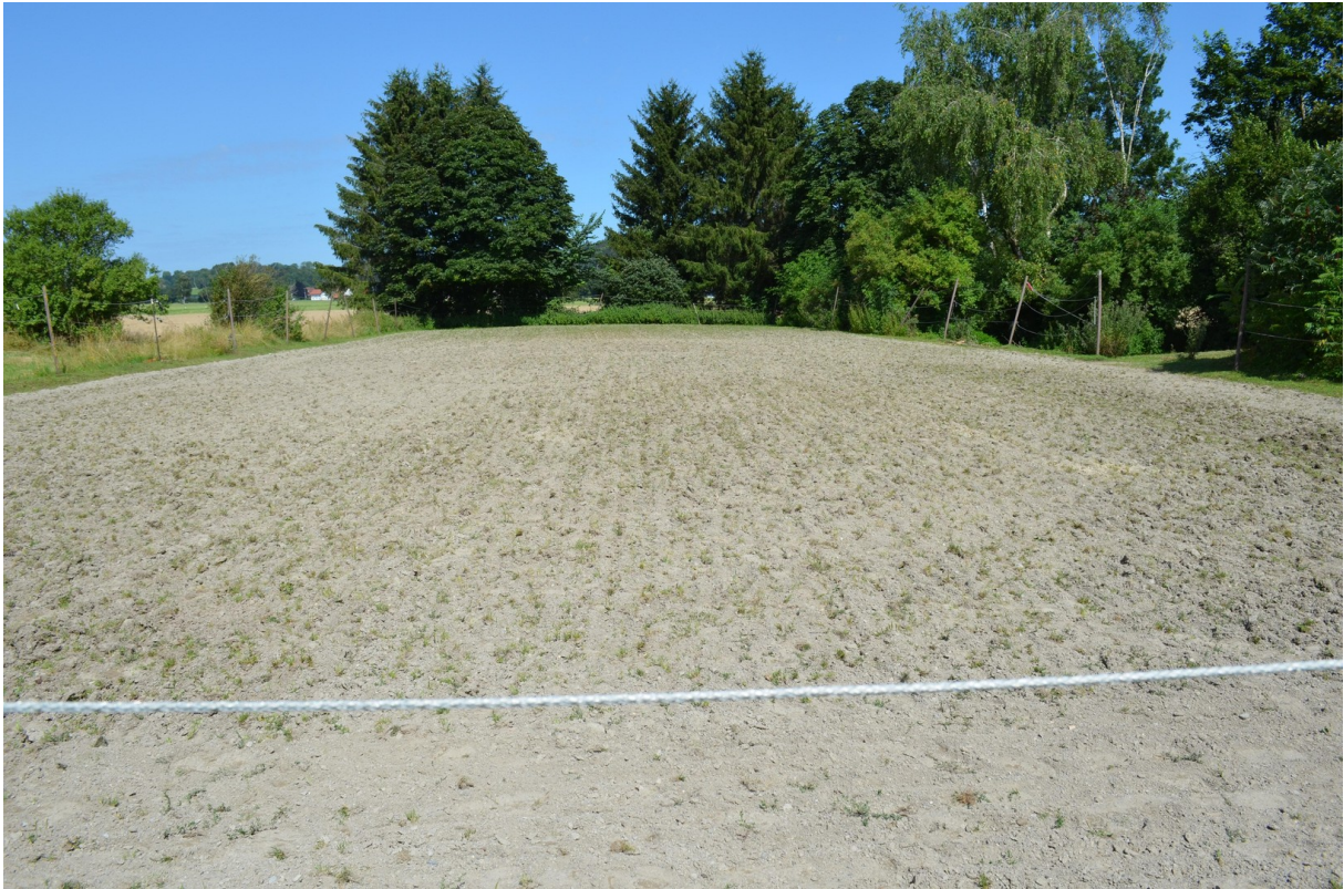
Sandplatz 20 x 60