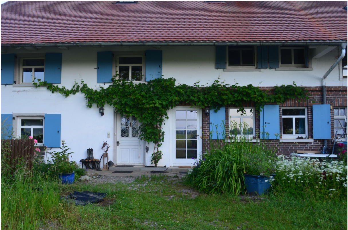
zwei Eingänge und die Weinrebe