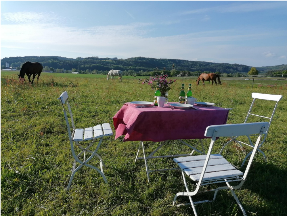
Speisen auf der Pferdeweide