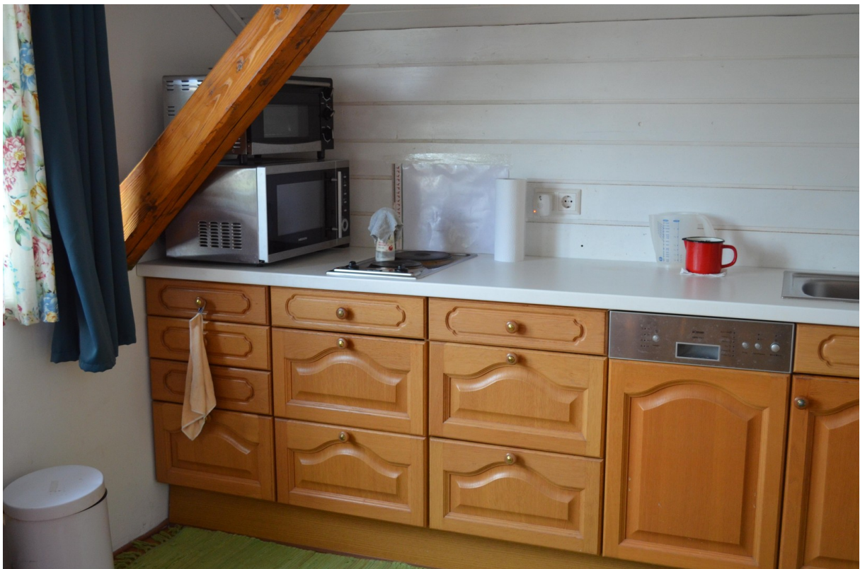
Küche im Dachstudio