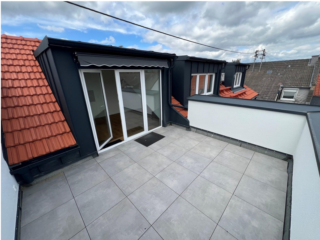
Terrasse mit Blick auf Gauben