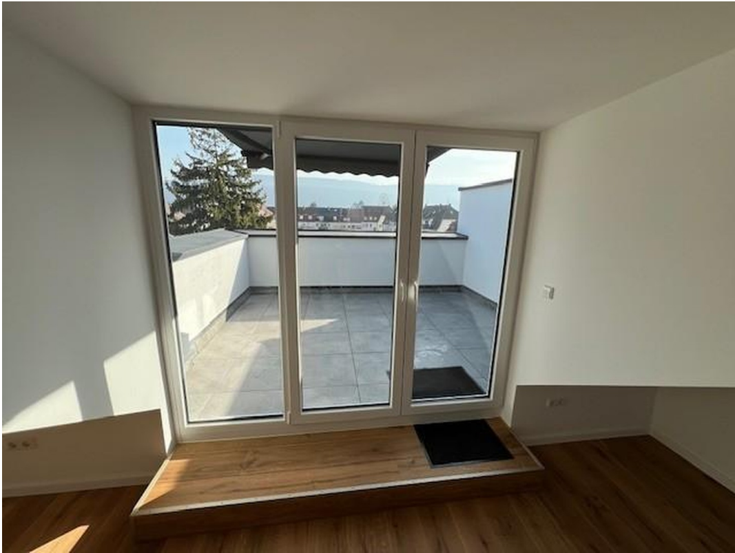
Blick auf Terrasse