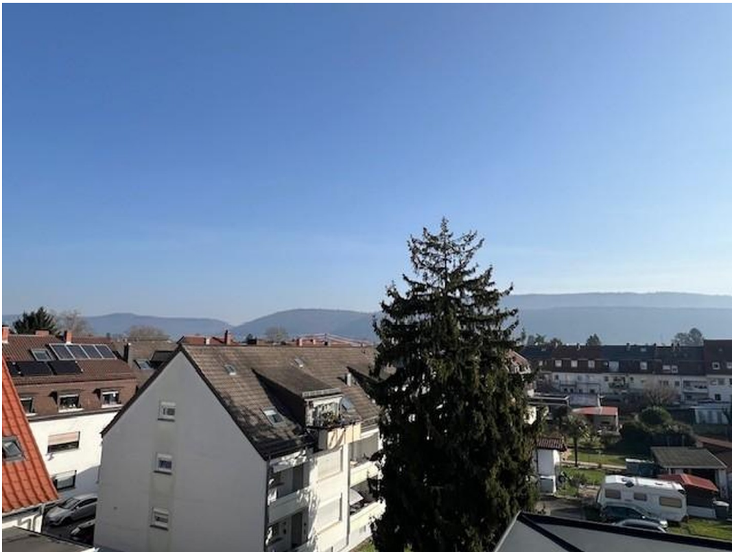
Aussicht in die Berge