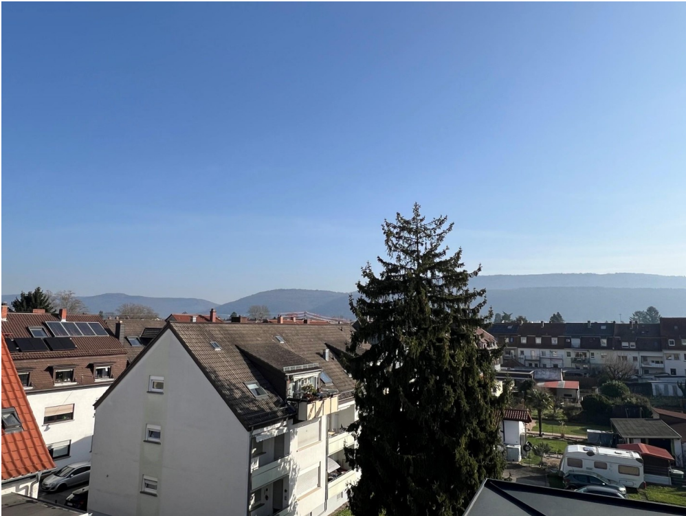
Aussicht Terrasse 1