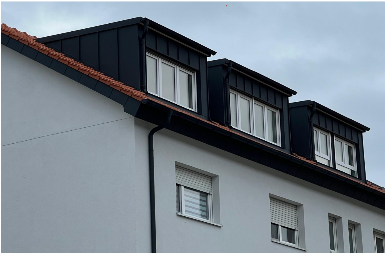
Gauben von der Strasse