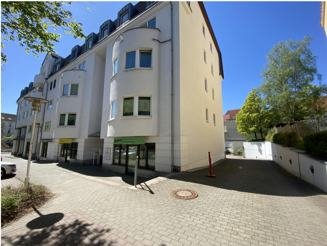
Einfahrt zur Tiefgarage