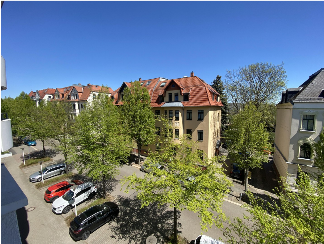
Blick vom Wohnzimmer