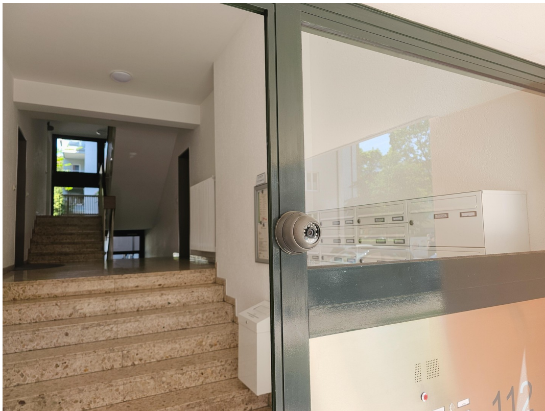
Hauseingang mit Kamera