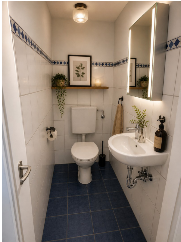
Gäste WC Beispielmöbl.