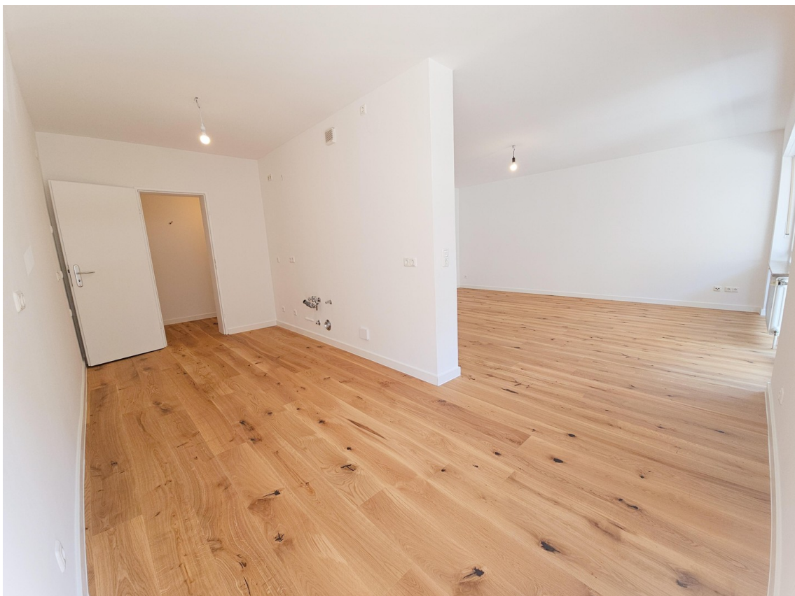
Offener Küchen- Wohnbereich