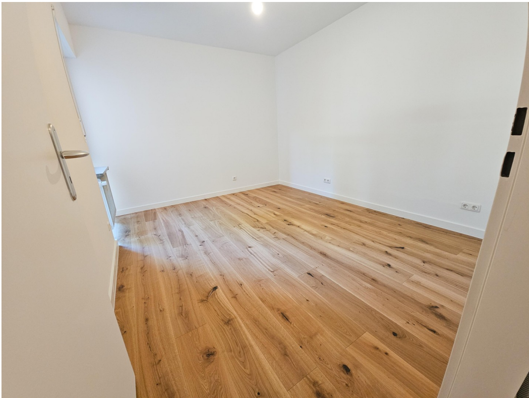
Homeoffice / Kinderzimmer