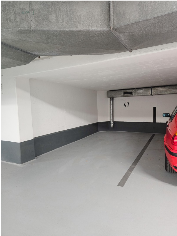
Großzügig Sanierter Stellplatz