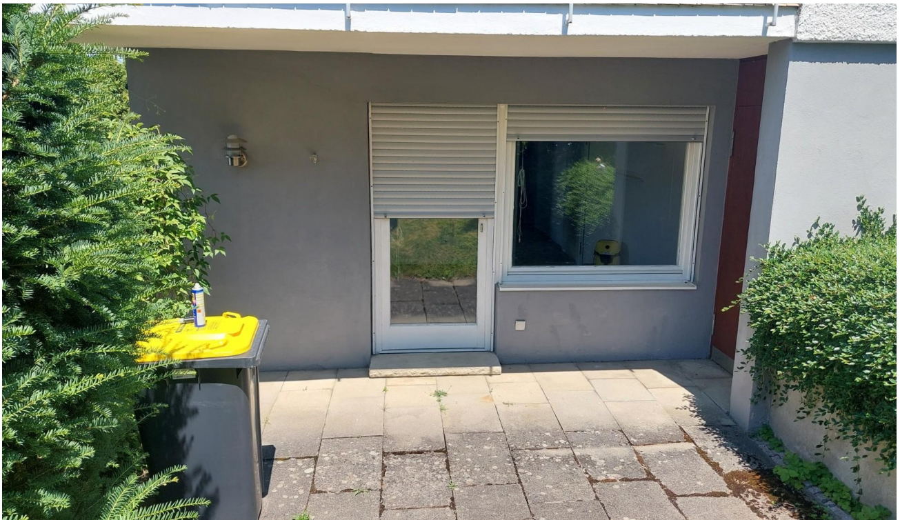
Zugang zur Westterrasse