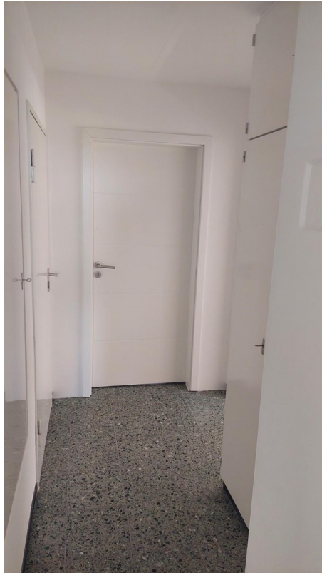
Flur zum Eingangsbereich