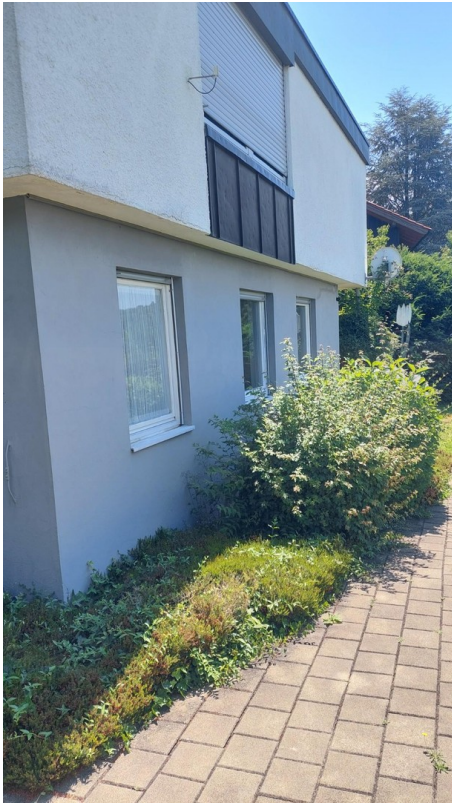
Fensterfront nach Westen