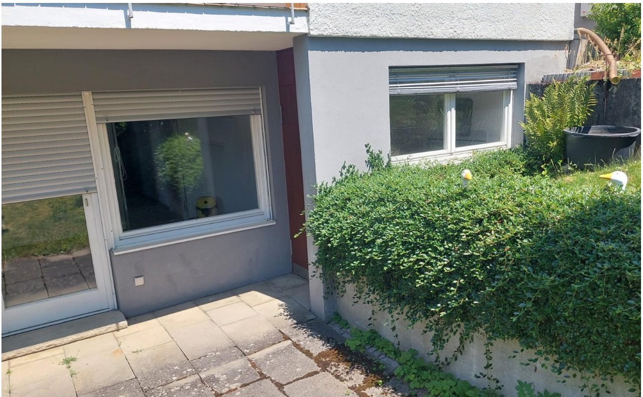
Zugang zur Westterrasse und F