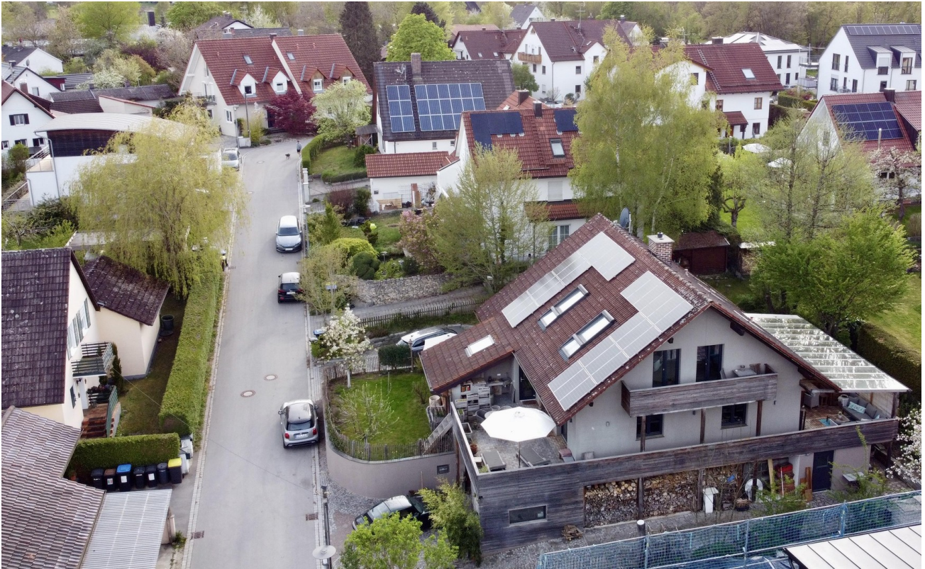
blick richtung s/w