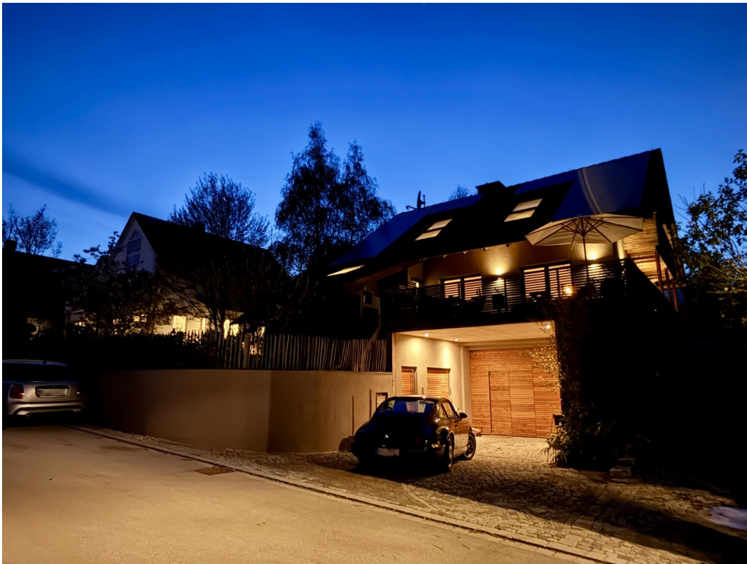
aussenansicht bei dämmerung