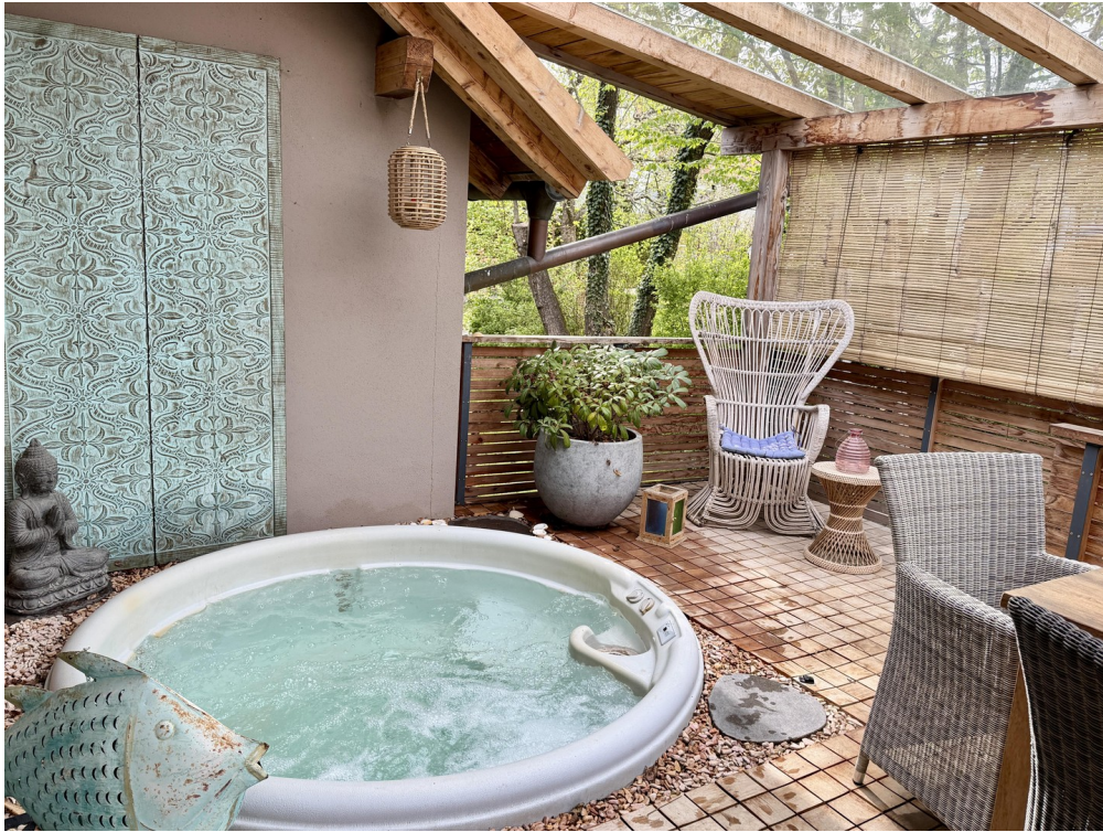
jacuzzi auf terrasse west