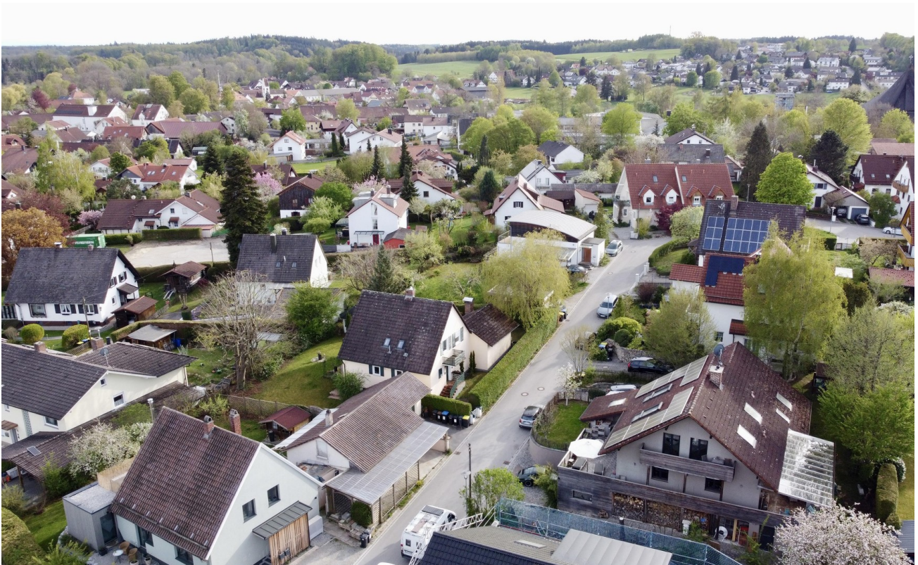
blick richtung s