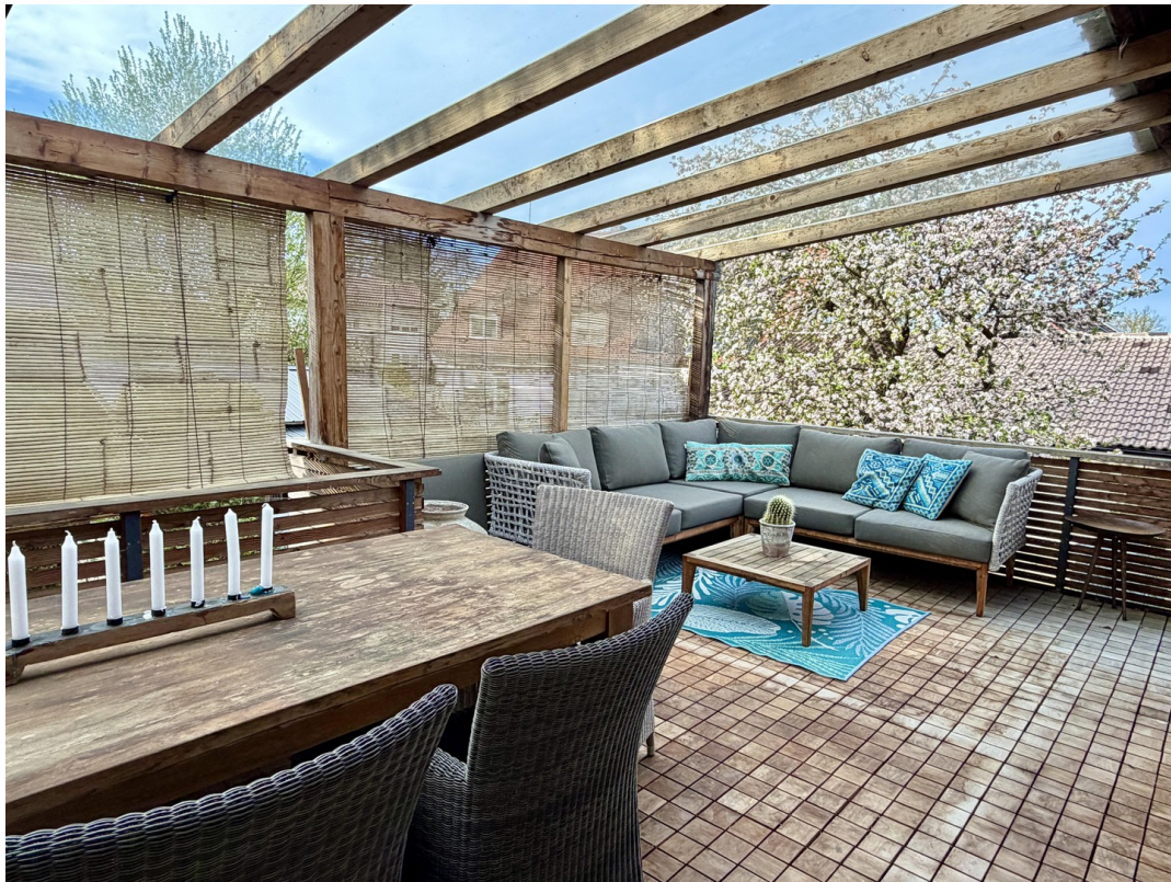
überdachte terrasse west