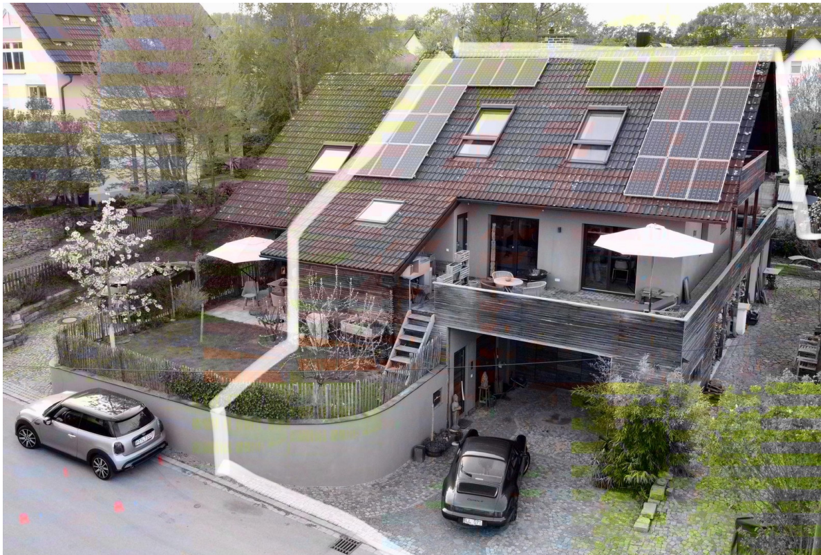
ansicht s/o teilungsverlauf