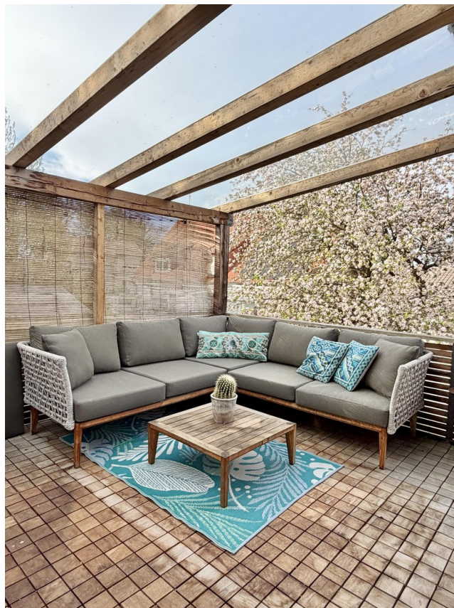
lounge auf terrasse west