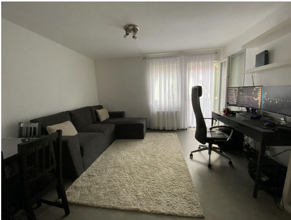
Wohn-/Esszimmer + Küche