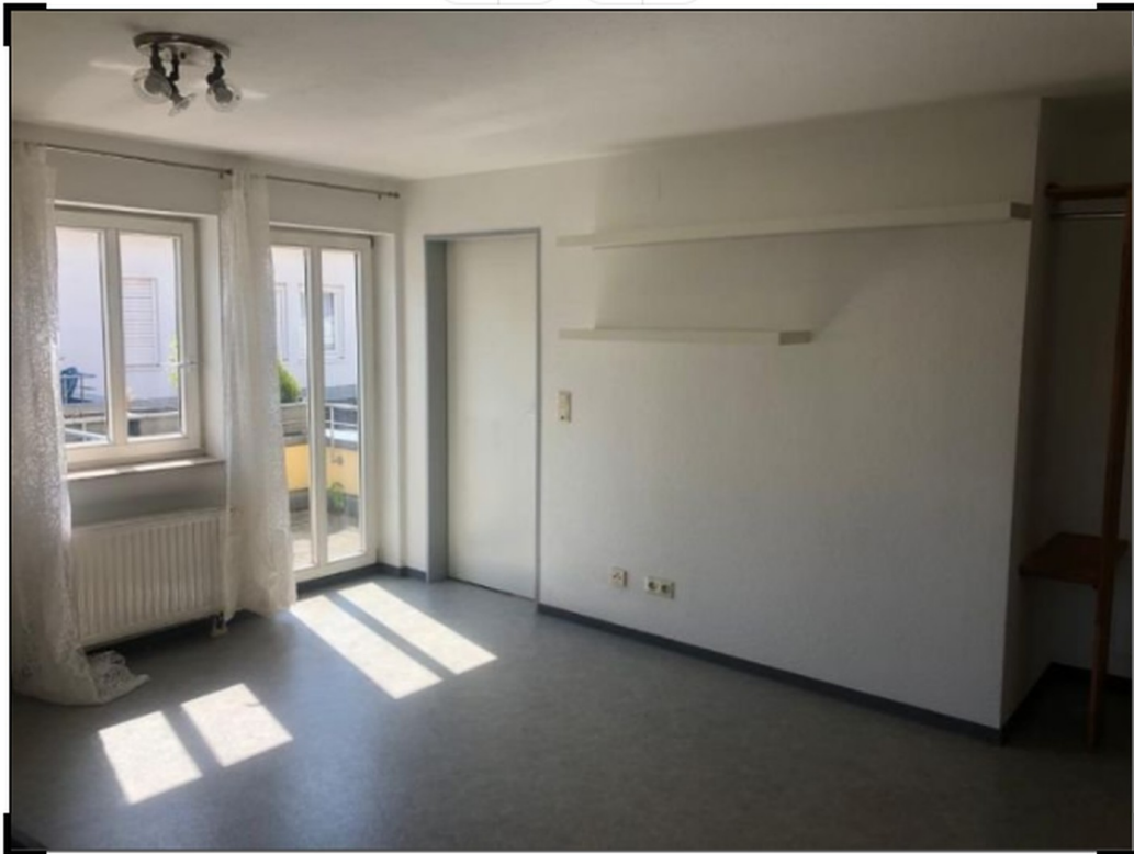
Wohn-/Esszimmer + Küche