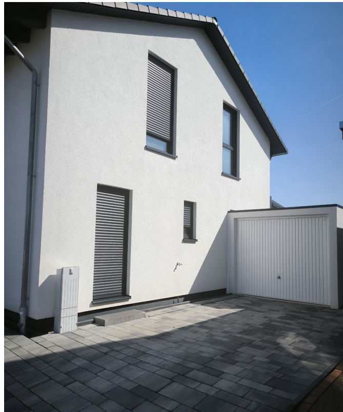
Nebeneingang & Garage