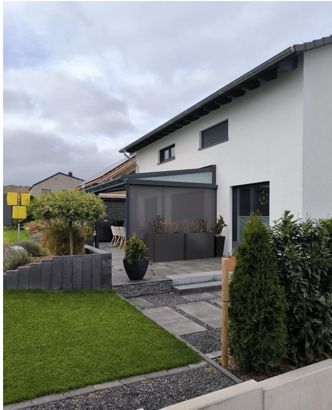
Süden mit Überdachter Terrasse