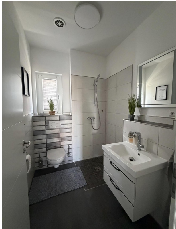
Gästebad mit Dusche & WC