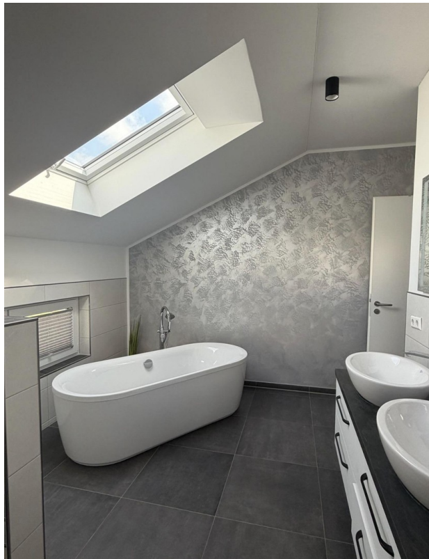
Masterbad mit Badewanne-Dusche