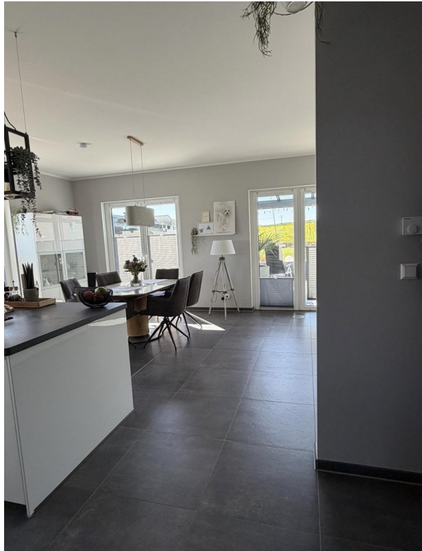
Esszimmer & Küche