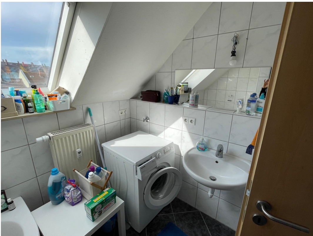
Badezimmer 3. OG