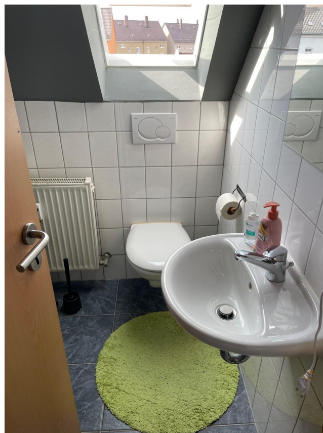
Dusche WC 4 OG