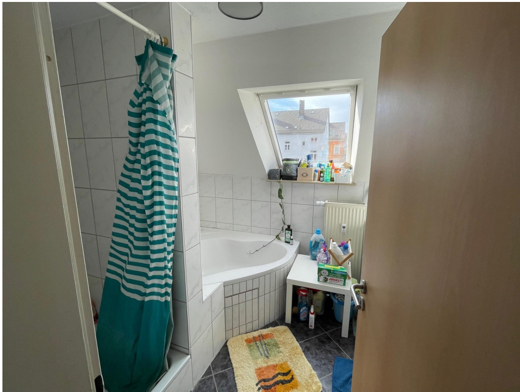
Badezimmer 3. OG