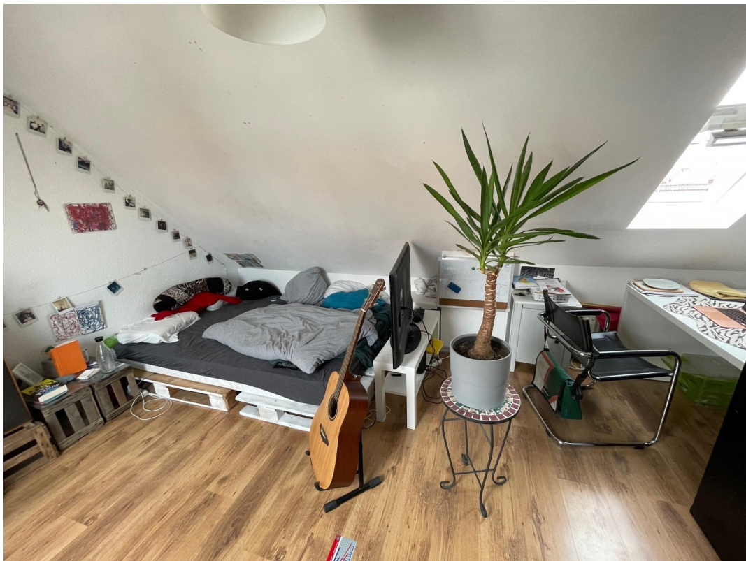
Schlafzimmer 4. OG