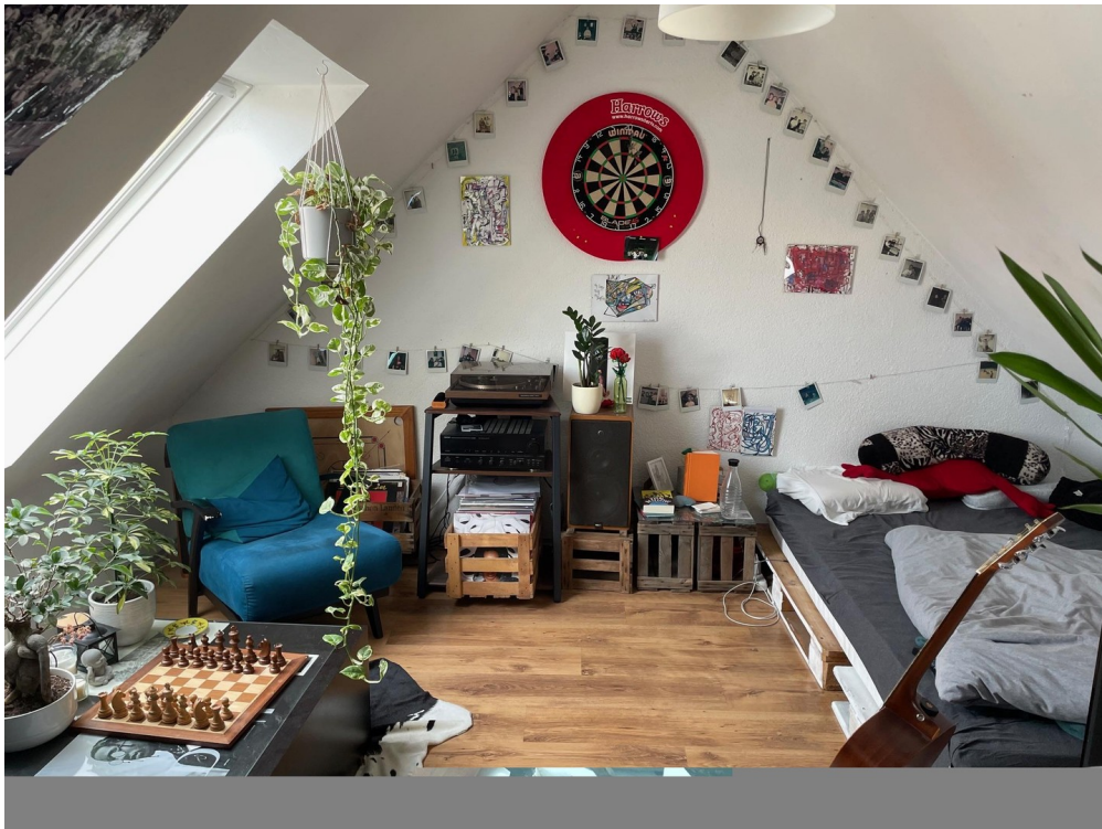
Schlafzimmer 4. OG