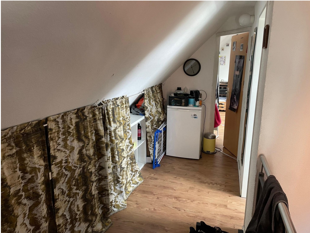
Flur 4. OG