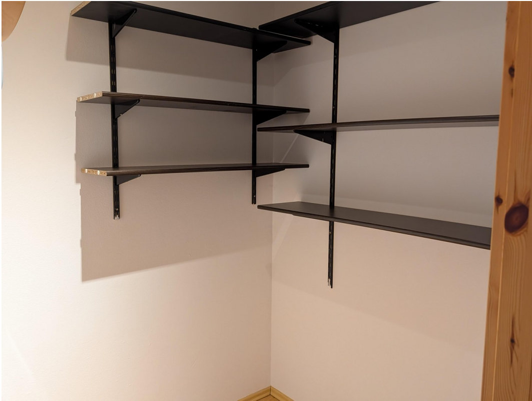
Abstellraum oder Büro