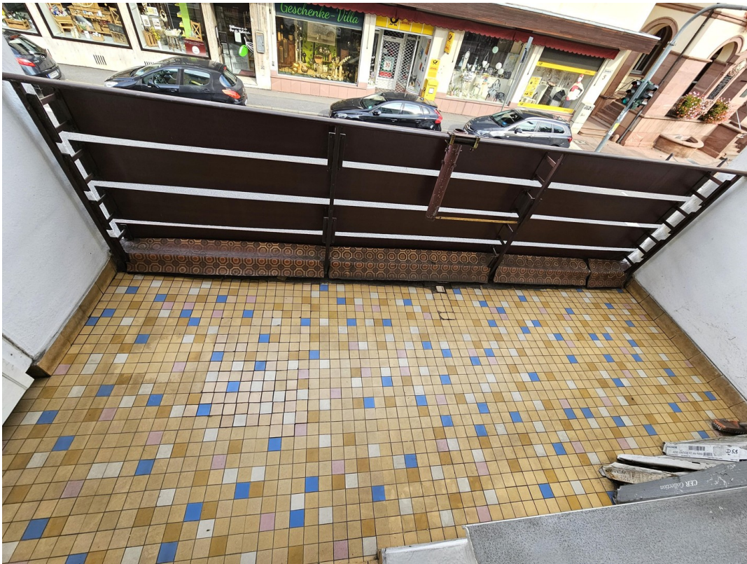
Balkon zur Straßenseite