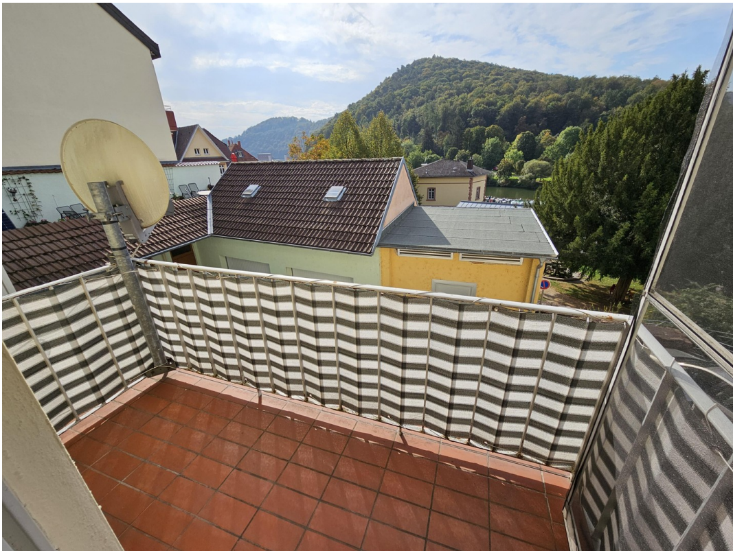
Balkon m. Blick auf den Neckar