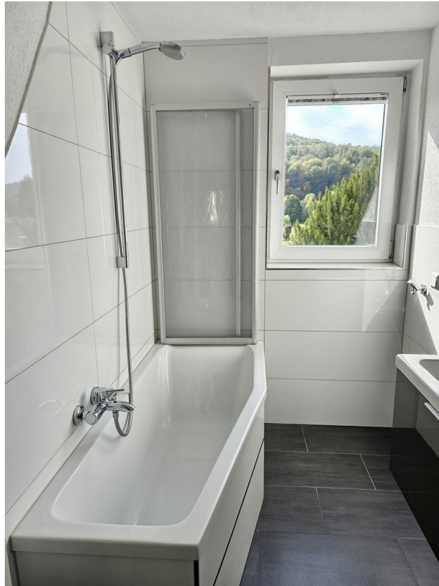
Bad mit Badewanne und WC