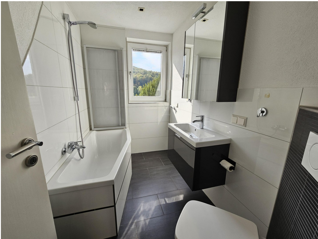
Bad mit Badewanne und WC