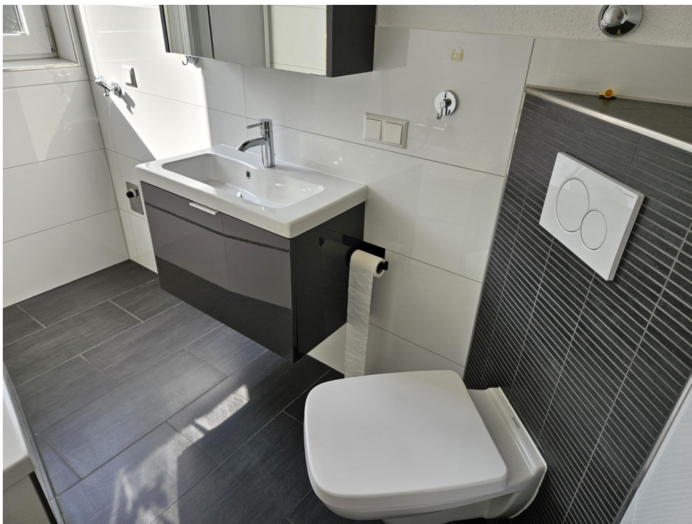
Bad mit Badewanne und WC