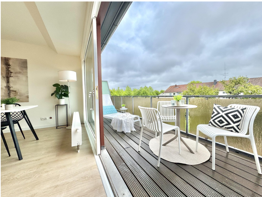
Blick auf die Terrasse