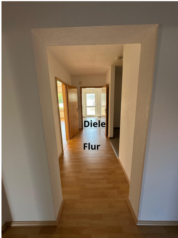
Flur und Diele