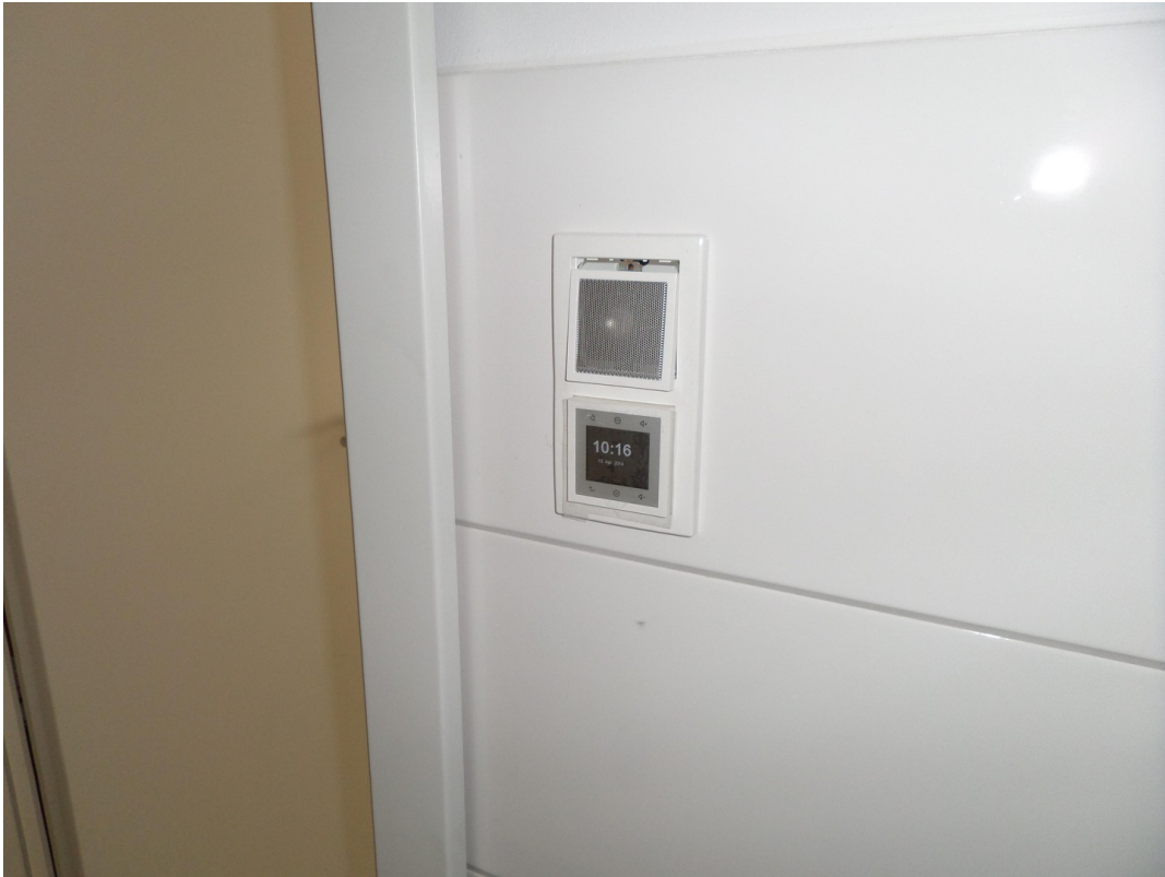
Radio im Bad