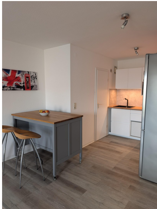
Essbereich - Küche