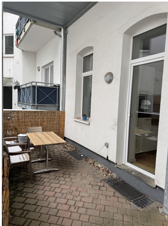
Terrasse / Nutzfläche