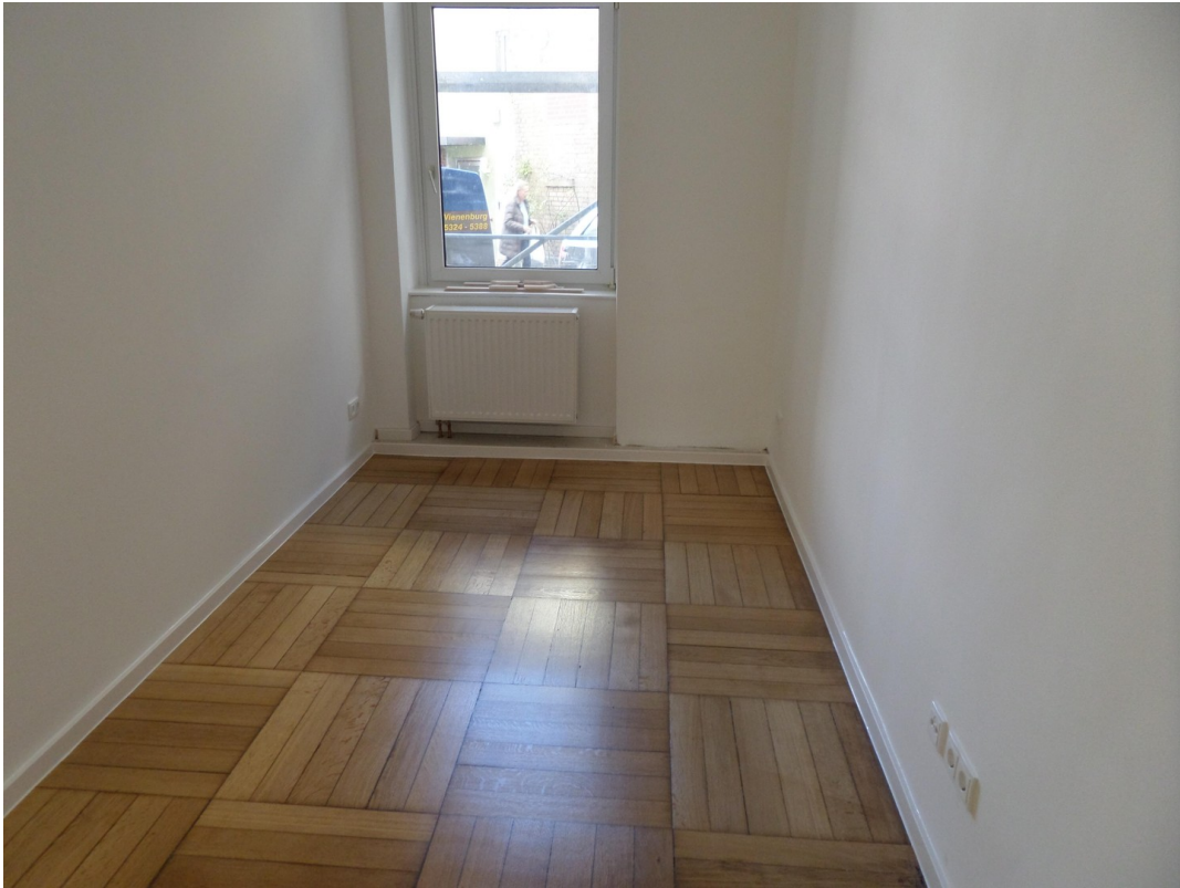
Schlafzimmer zum Innenhof