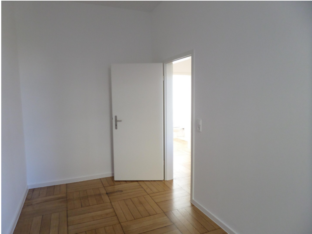
Schlafzimmer zum Innenhof