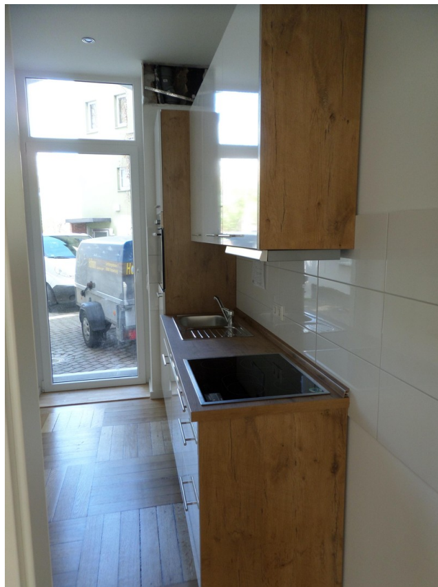
Küche zur Terrasse