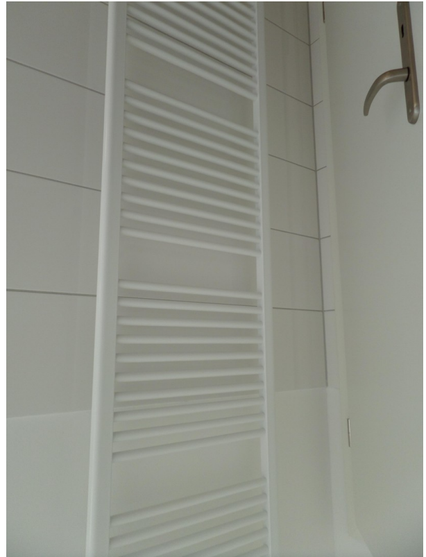
Handtuchheizkörper im Bad