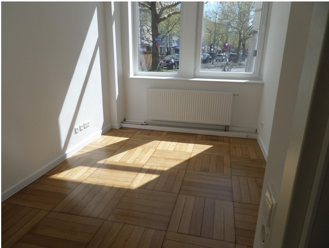
Schlafzimmer zur Kaiserstraße