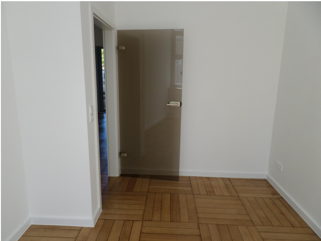
Schlafzimmer zur Kaiserstraße