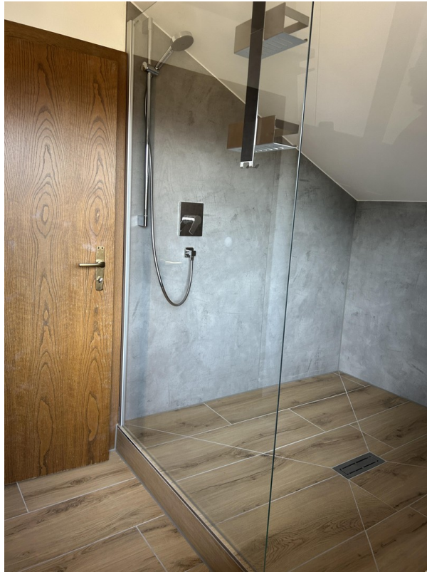
Bad / Dusche