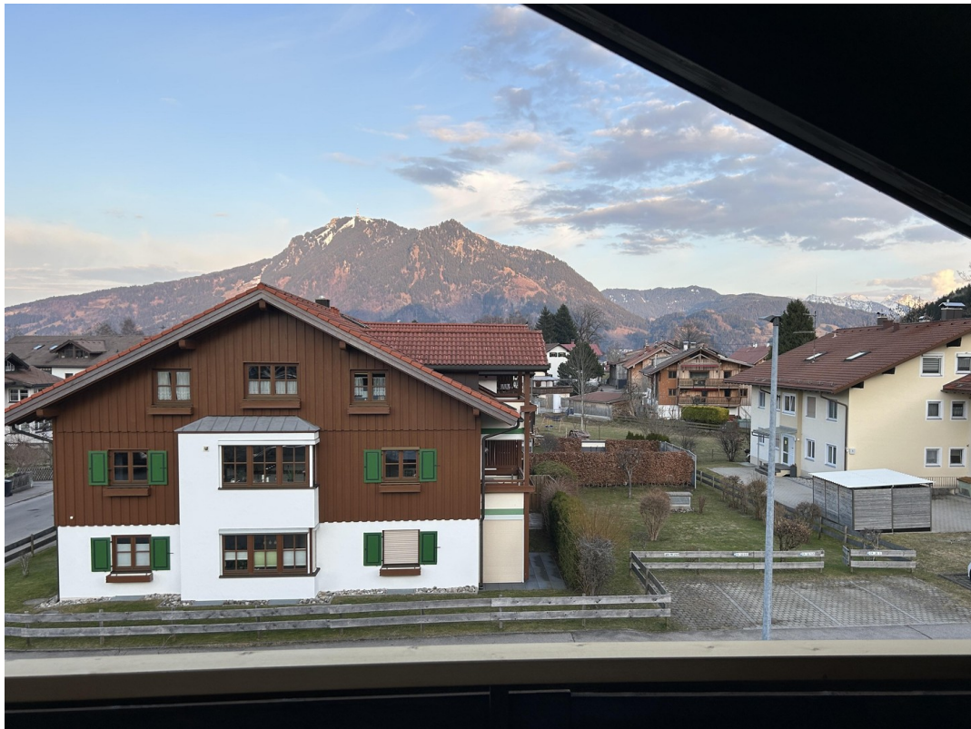
Blick vom Ostbalkon