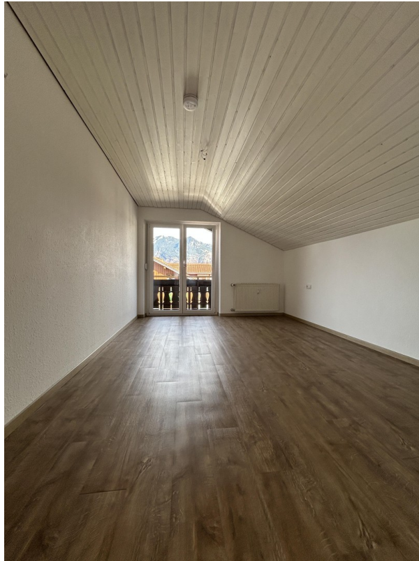
Schlafzimmer mit Balkonzugang