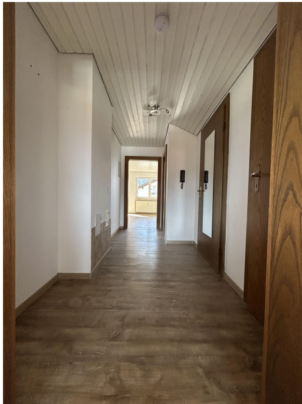
Flur Richtung Wohnzimmer