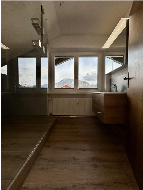
Blick aus Bad