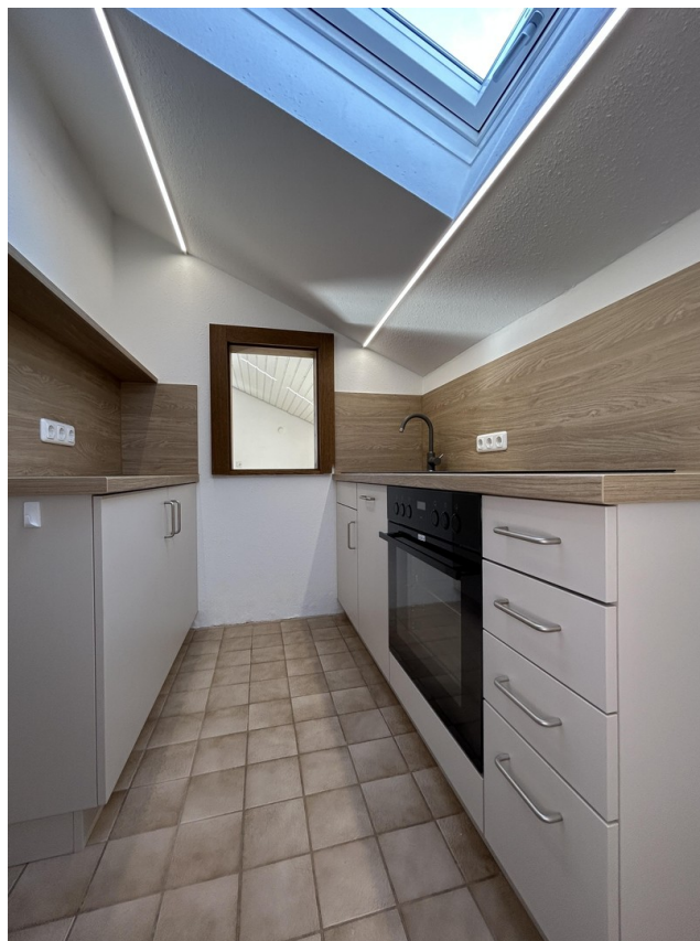
Küche mit Durchreiche