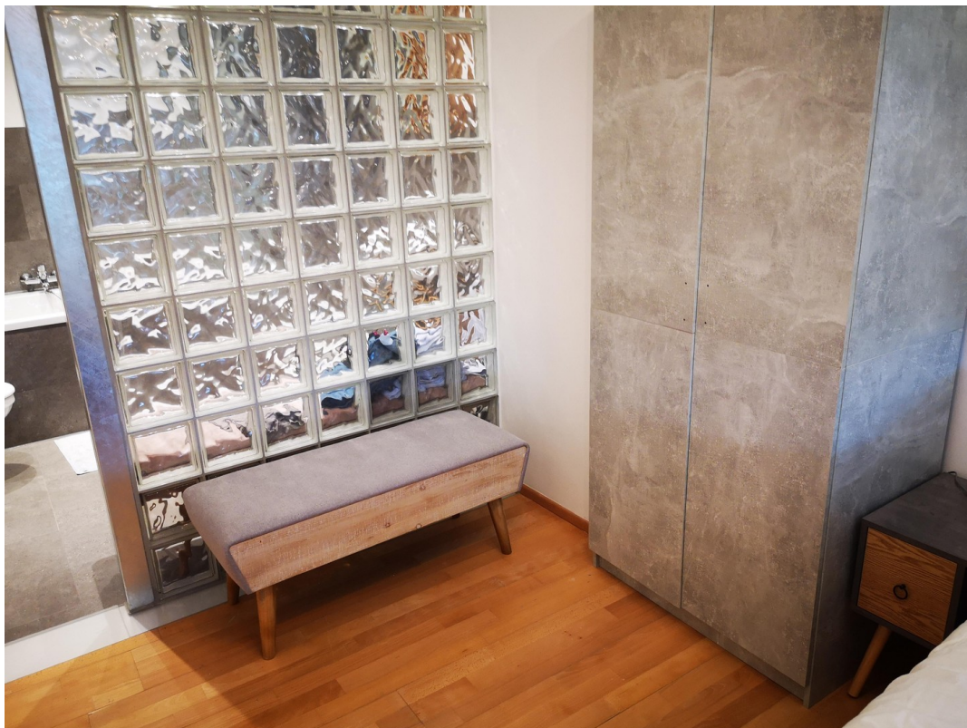
Blick ins Bad