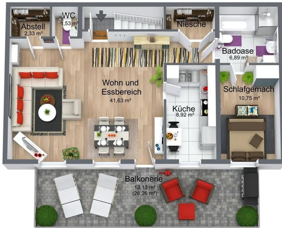
Grundriss vor Renovierung