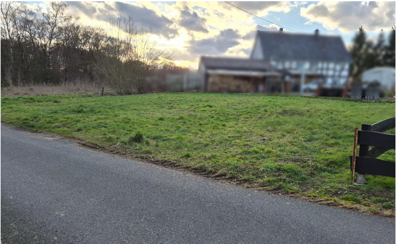
Ansicht von rechts