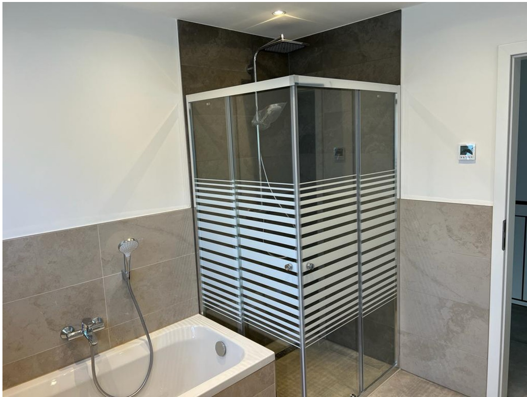
Dusche / Badewanne