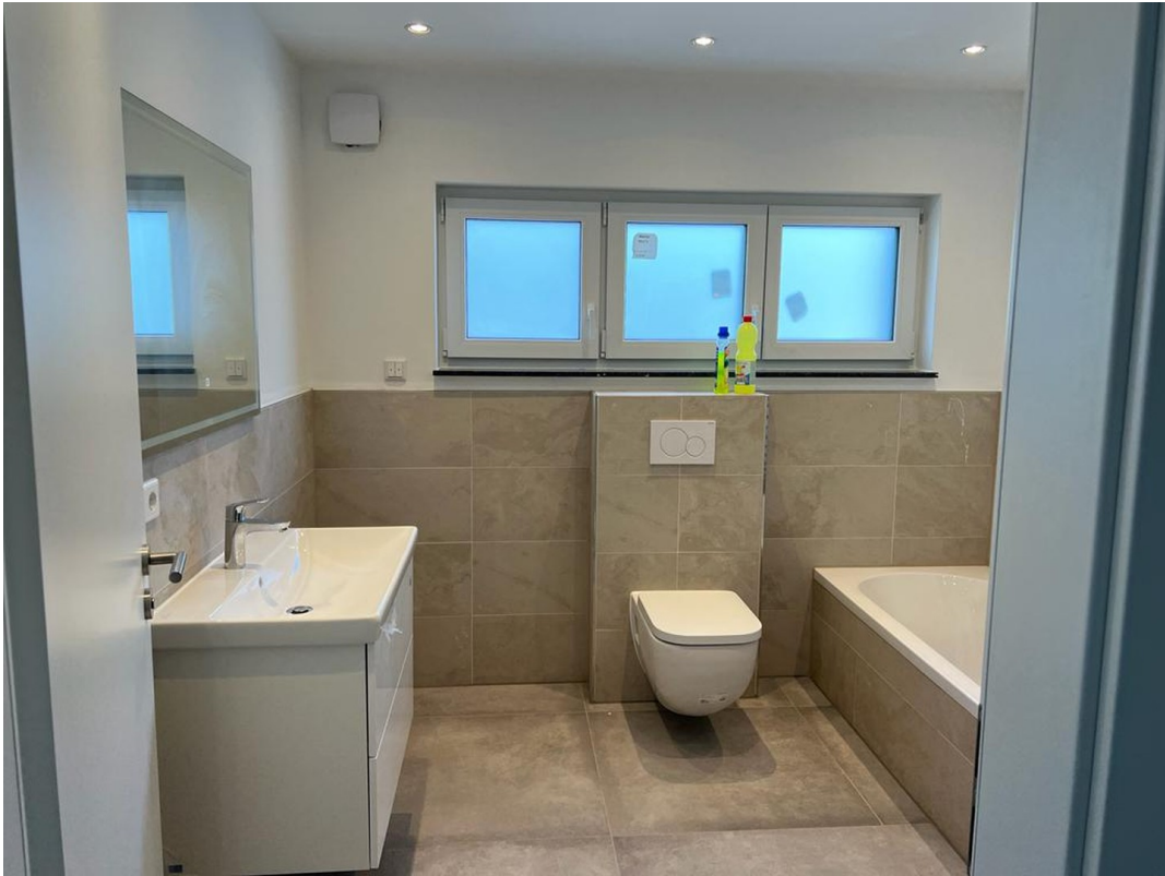
Bad / WC 3