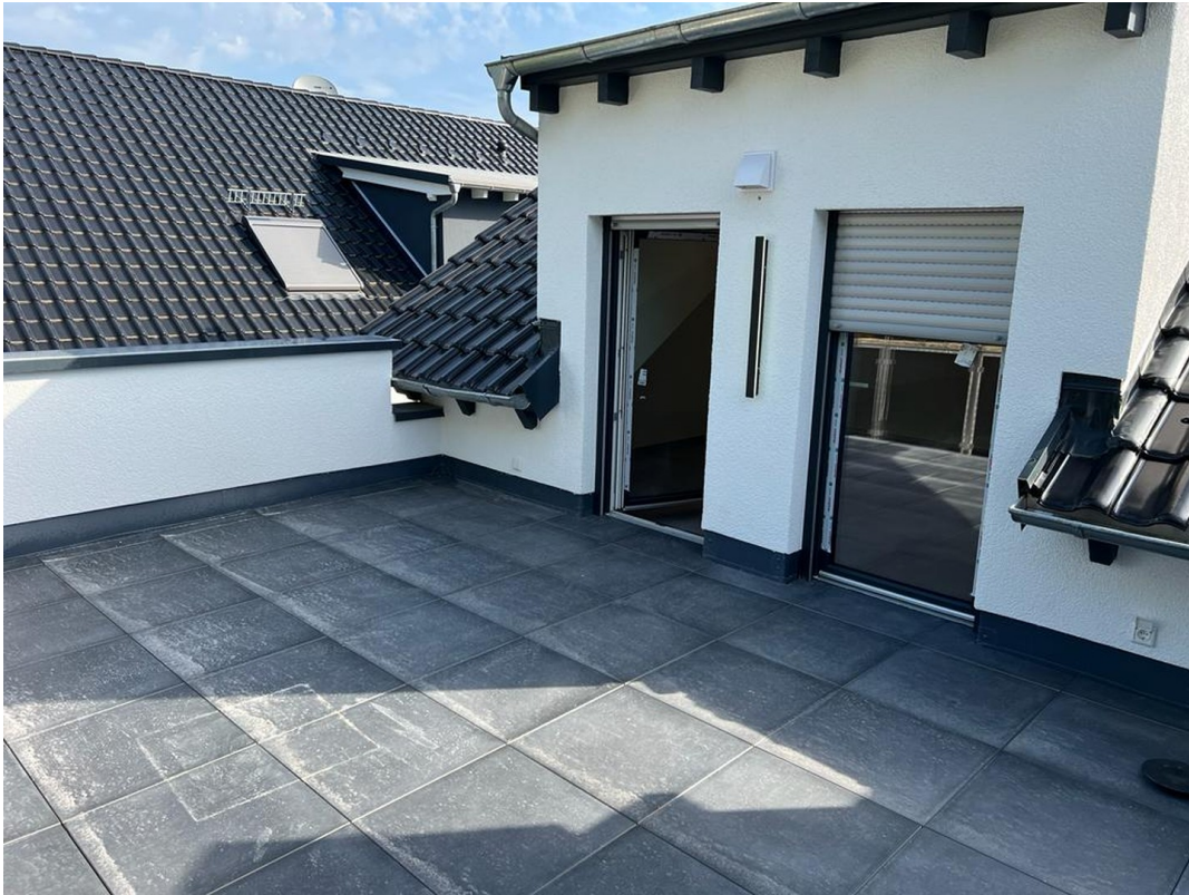
Terrasse OG 2