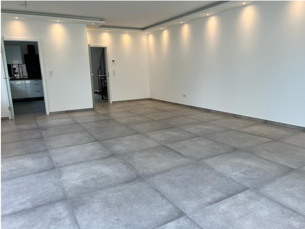
Wohnzimmer / Küche EG 2