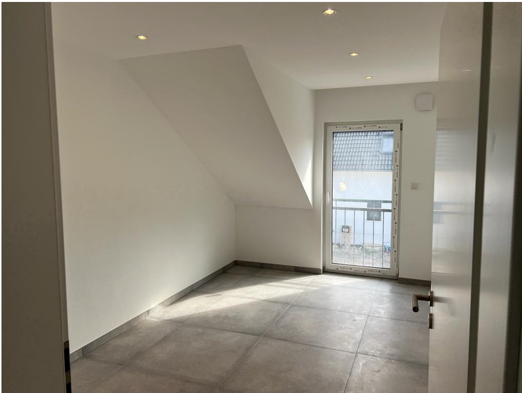
Kinderzimmer OG 3