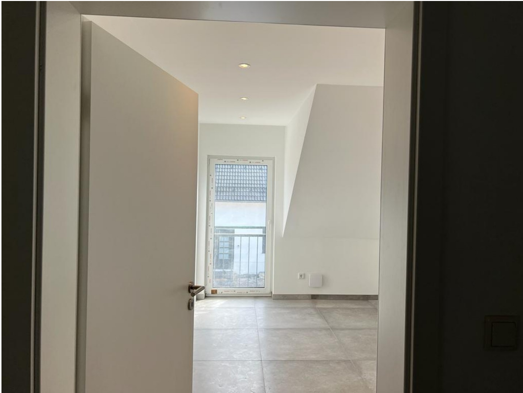
Kinderzimmer OG 1