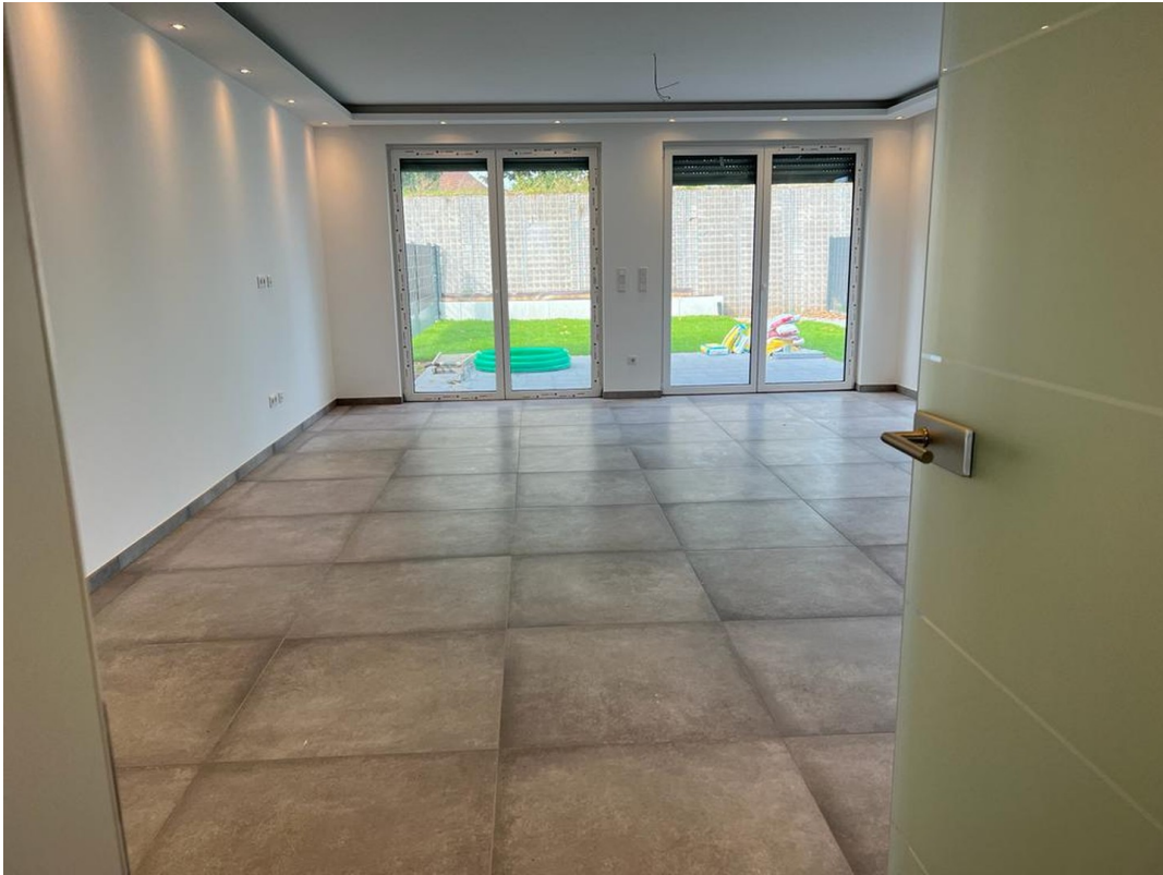
Wohnzimmer EG 1