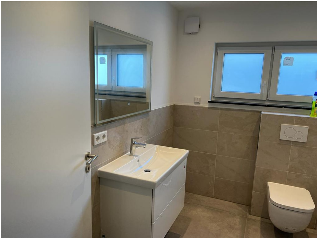
Bad / WC