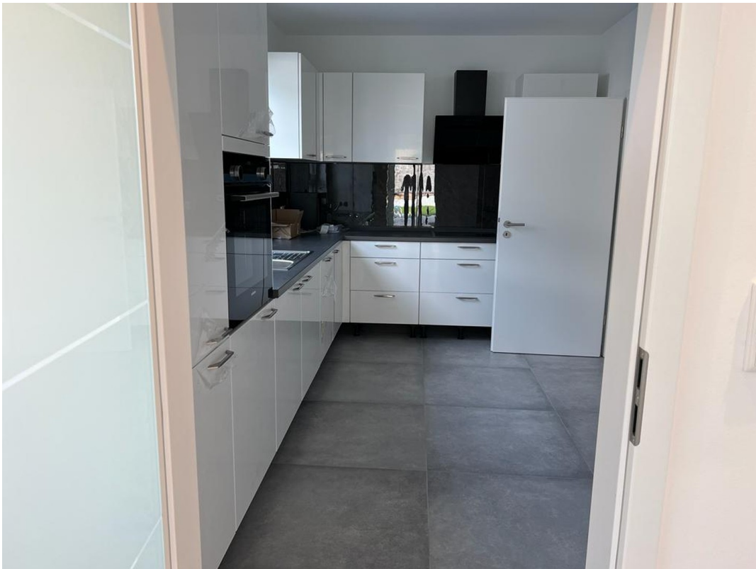
Küche EG 1