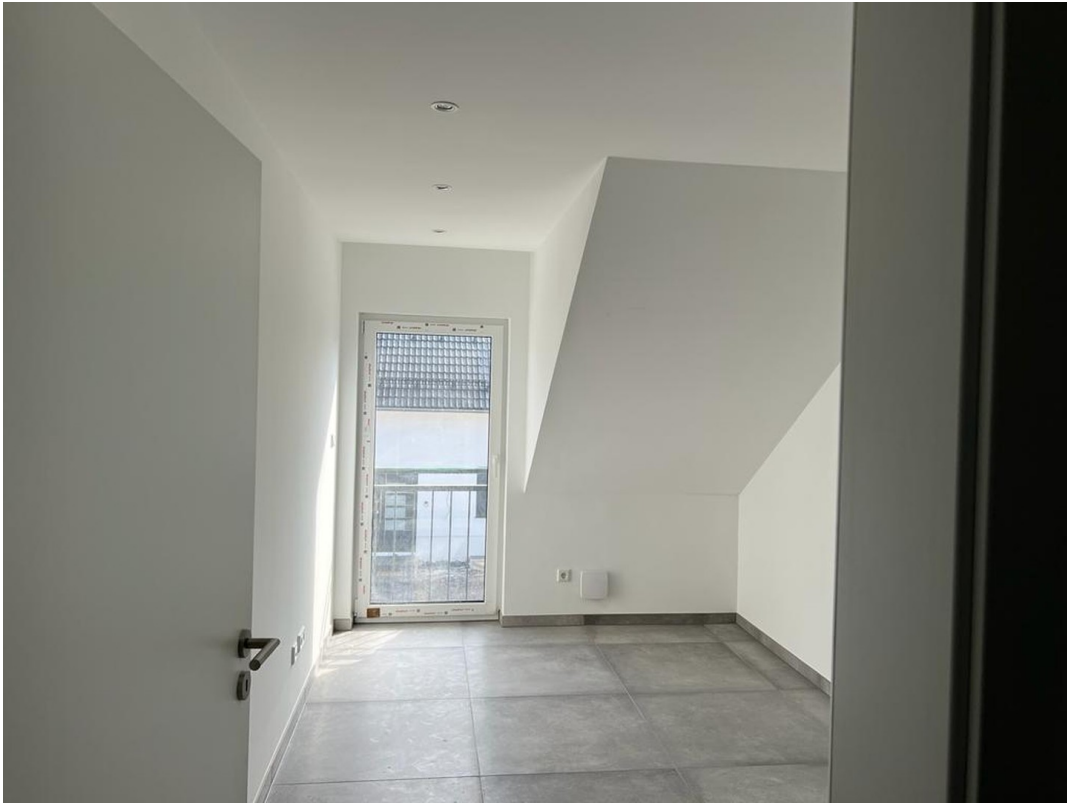
Kinderzimmer OG 2