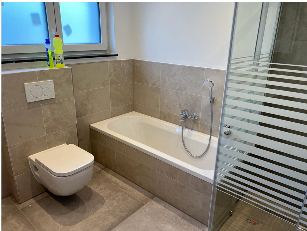
Bad / WC 2