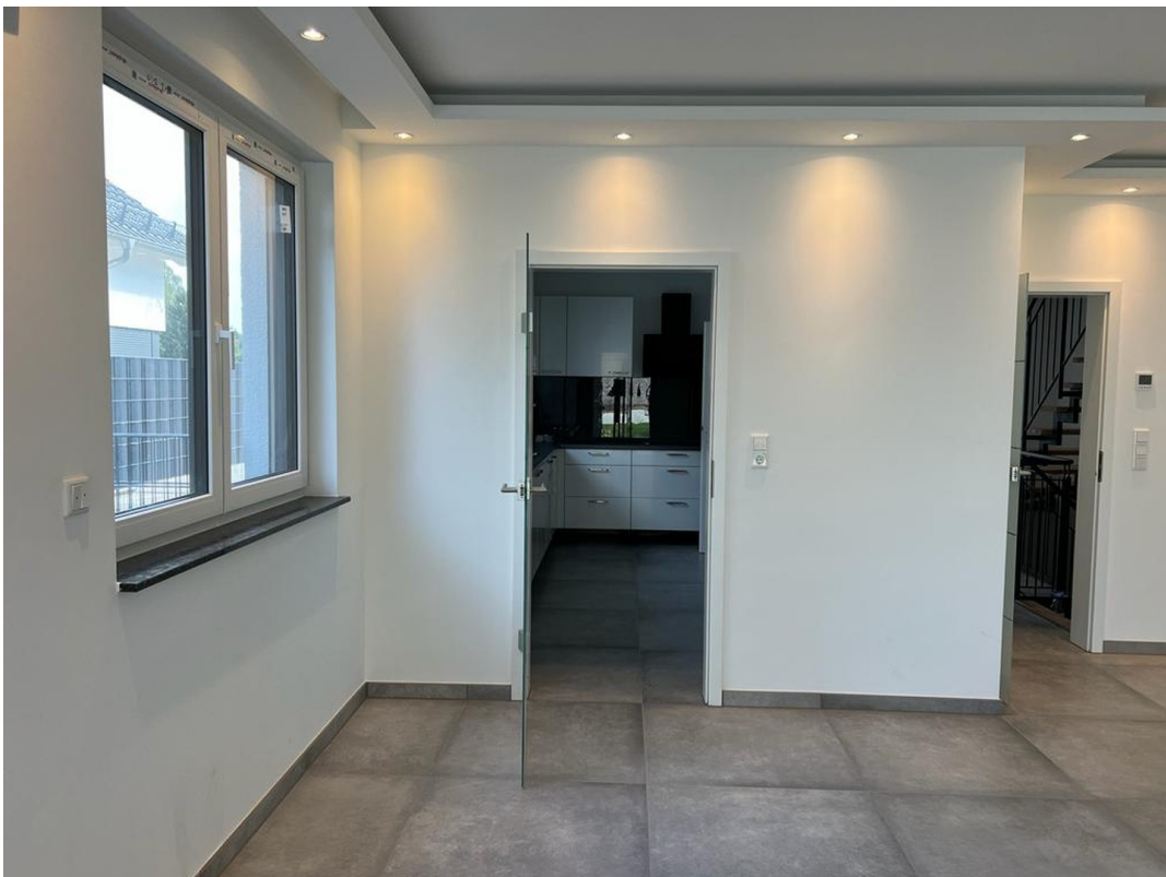
Wohnzimmer / Küche EG