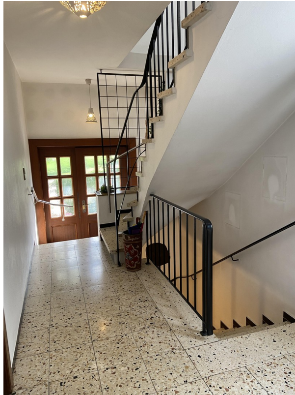
Eingang mit Treppenhaus