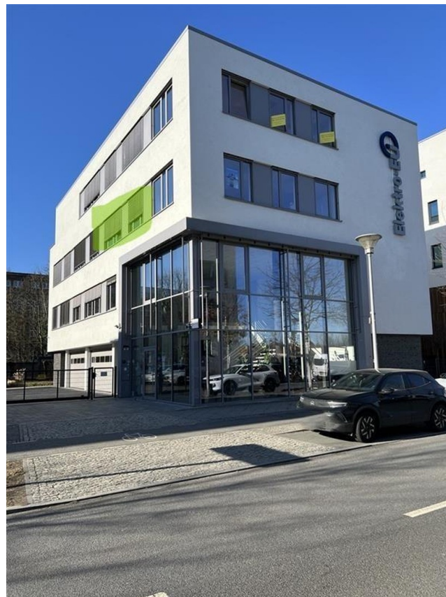
Gebäude Fenster grün markiert