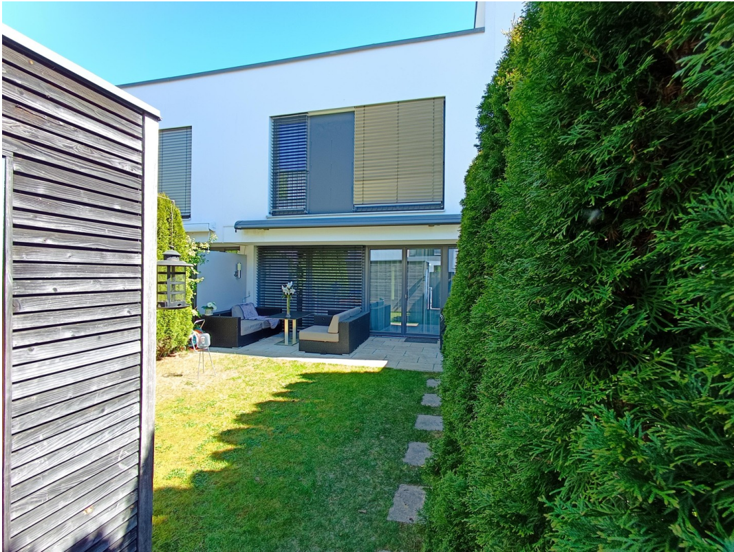
Garten mit elektr. Markise