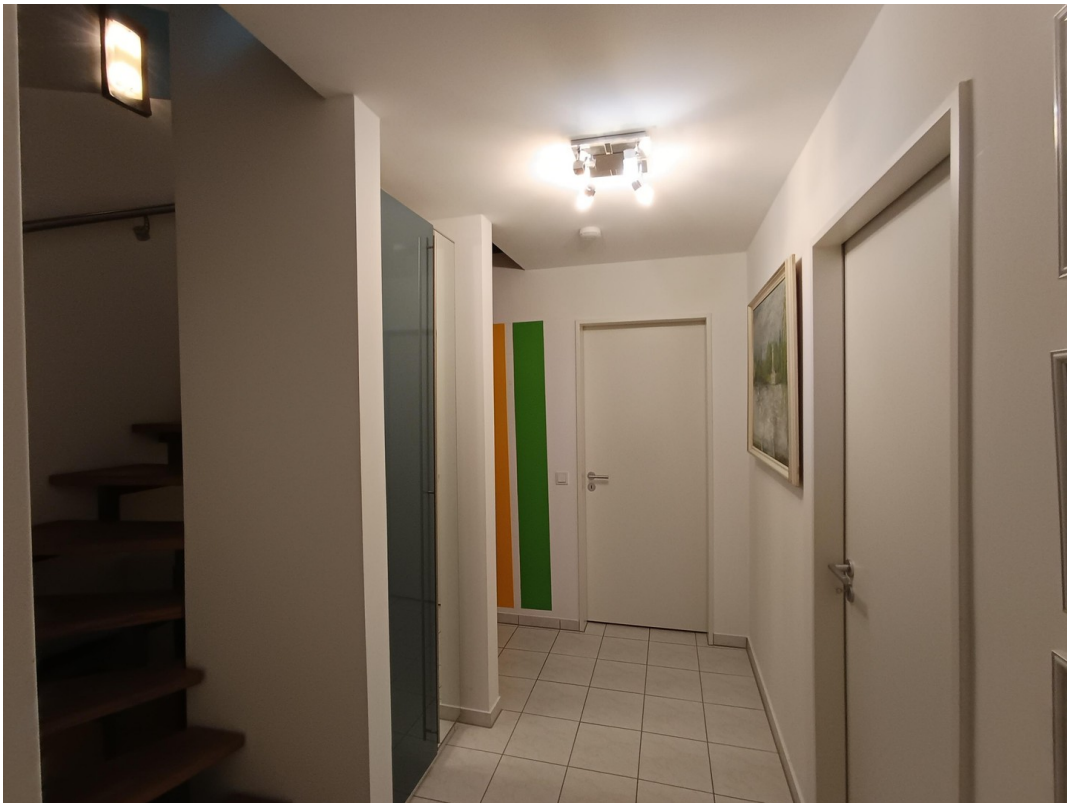
Keller - Flur