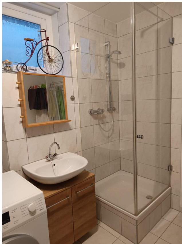
Keller Dusche / Waschbecken