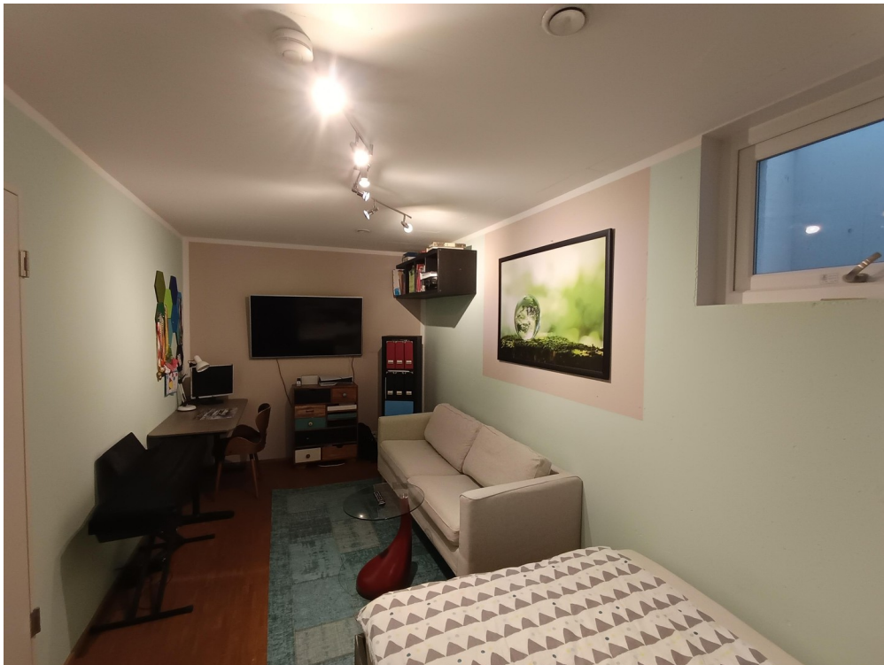
Keller - Wohn/Hobbyraum