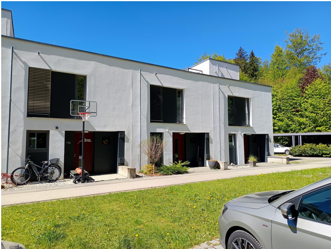
1. Haus von links