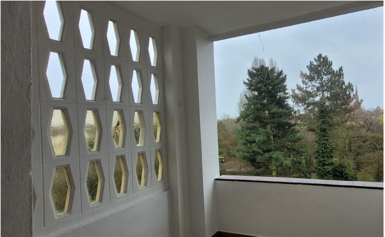
Loggia des gr. Zimmers