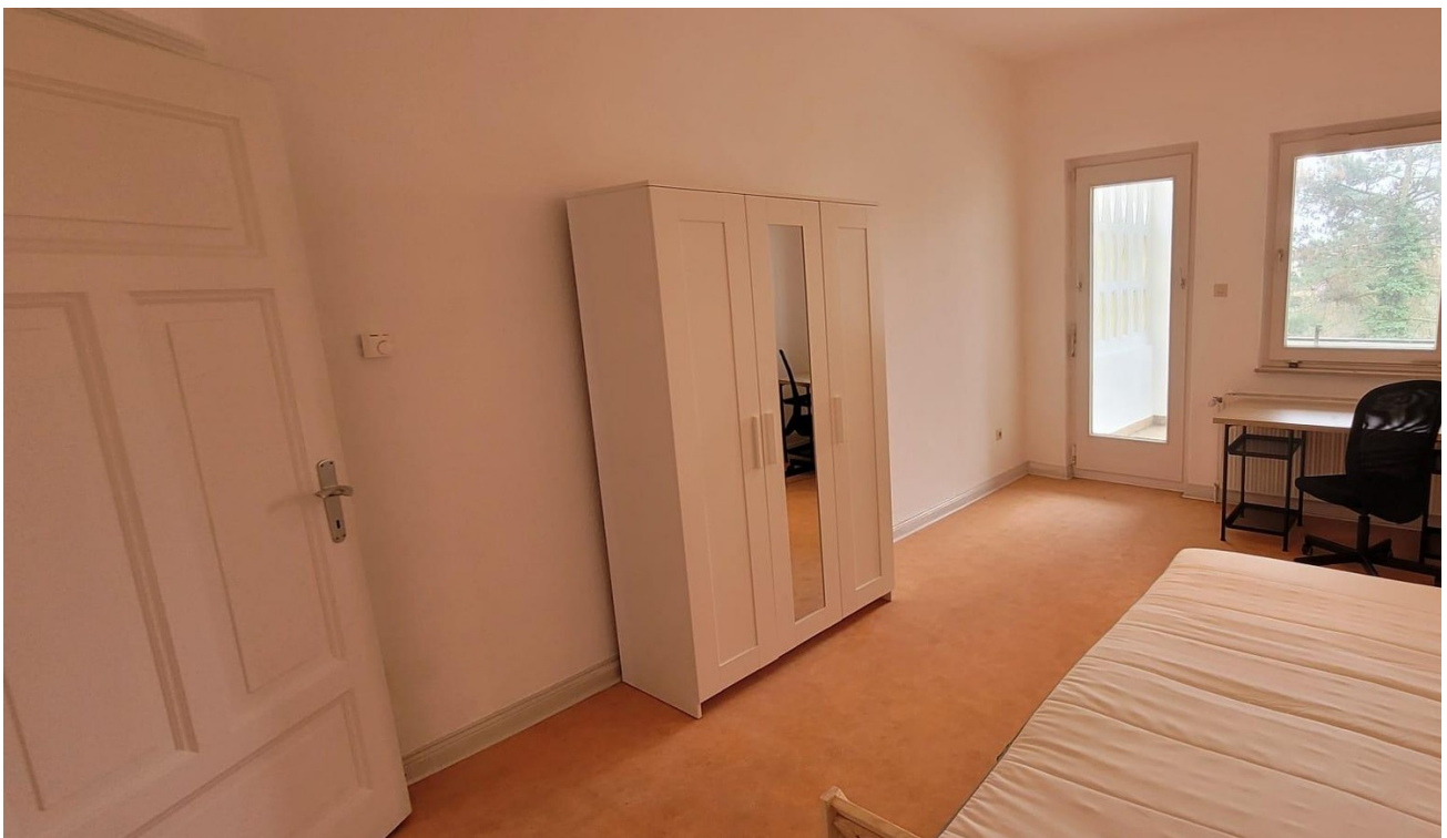
grosses Zimmer inkl. Loggia