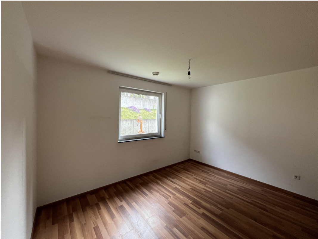
Kinder- oder Gästezimmer