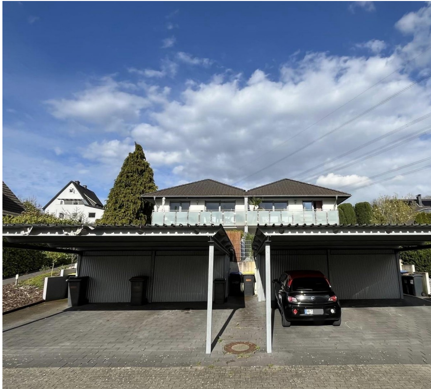
Blick von der Straße