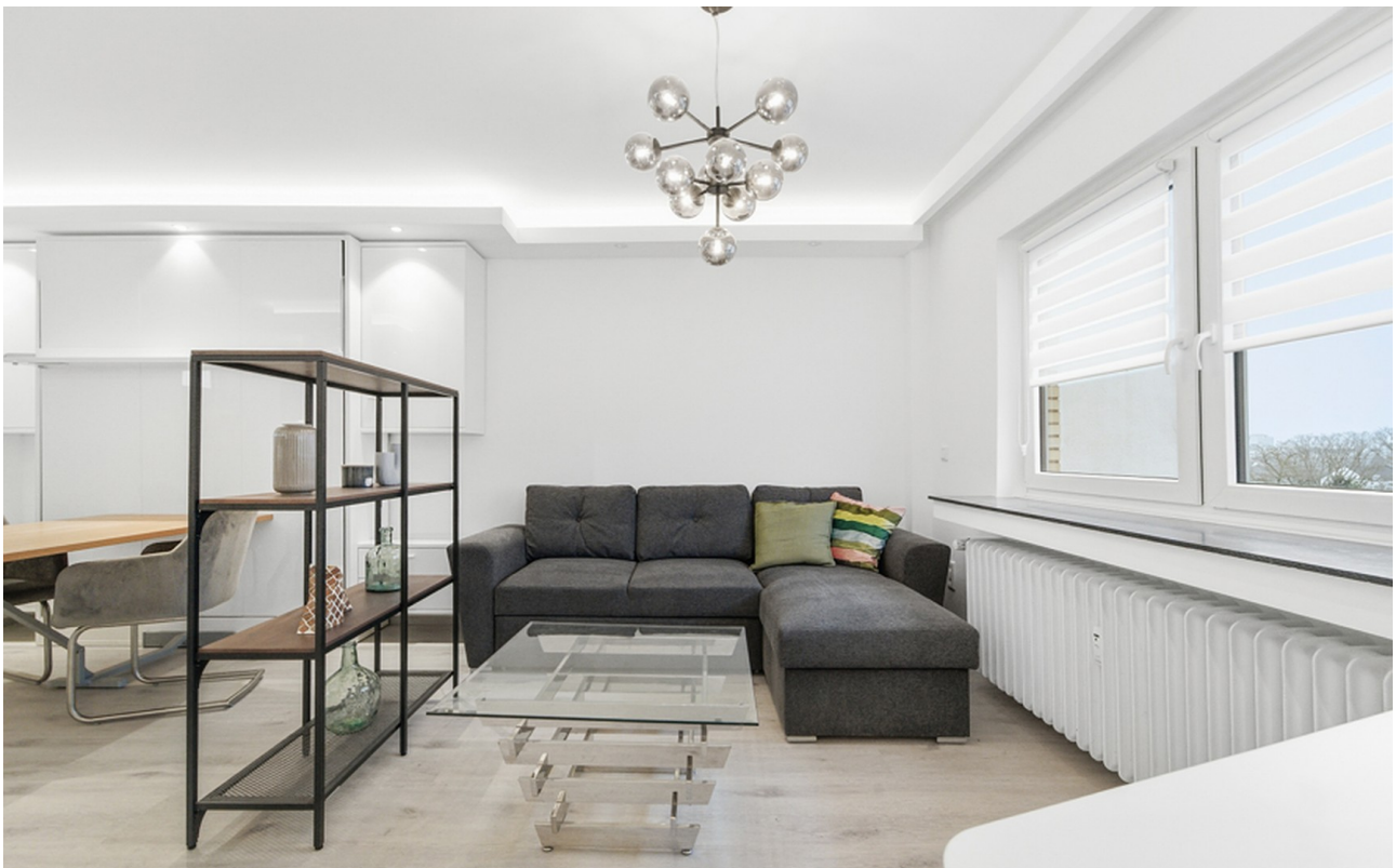
Sofa mit Schlaffunktion