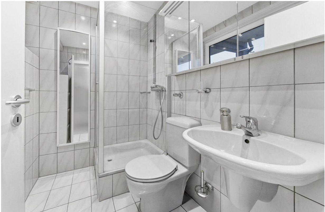
Duschbad mit Tageslicht