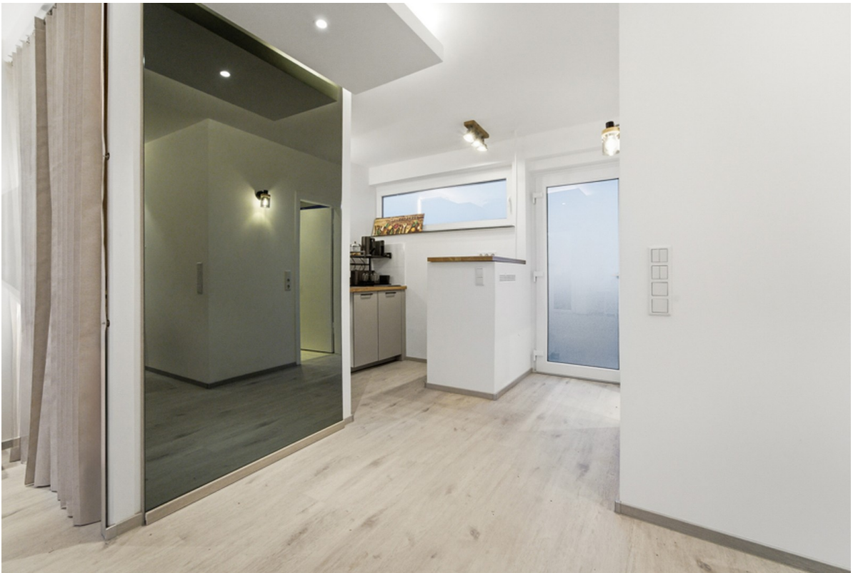
Eingang und Küchenecke