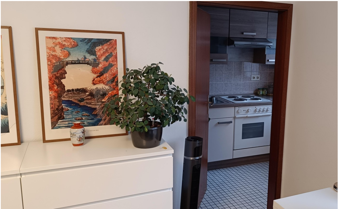
Küche-Blick vom Wohnzimmer