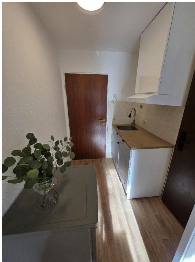
Eingangsbereich mit Küche