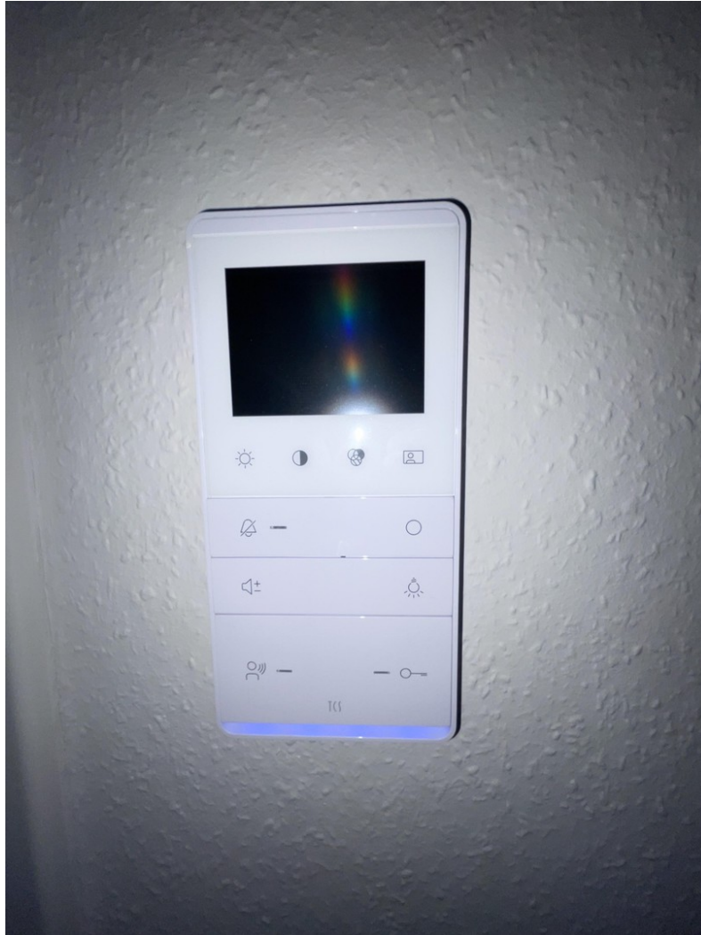
Lüftung- und Heizungssteuerung