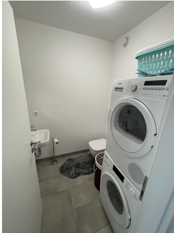
Gäste WC mit Waschmaschine