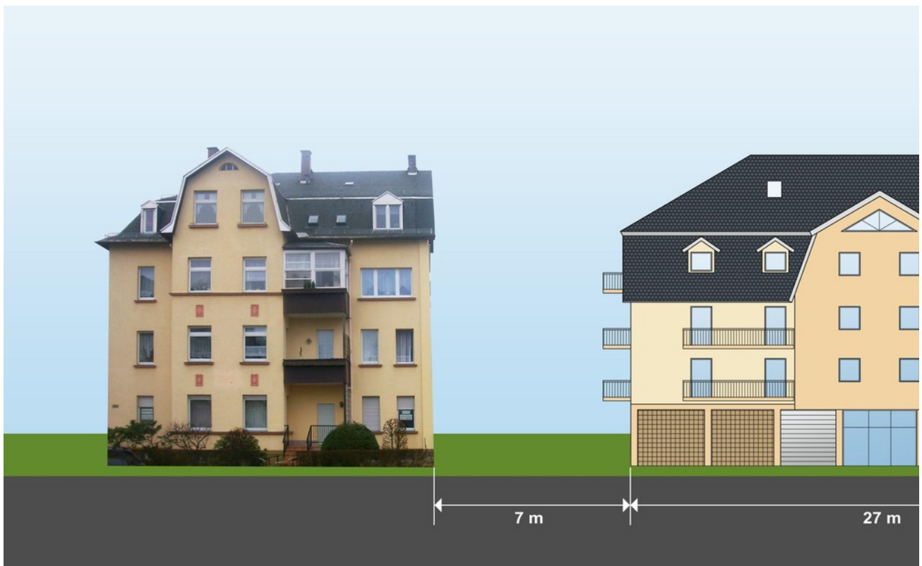
Planung eines MFH 11 WE