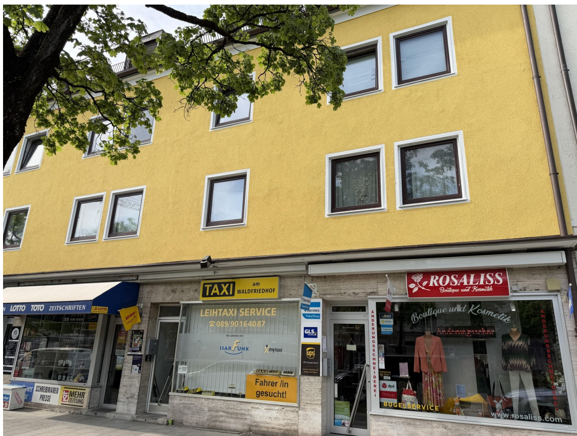
Gewerbeinheit Laden EG