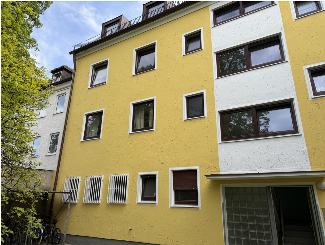
Laden im EG Gebäude Rückseite