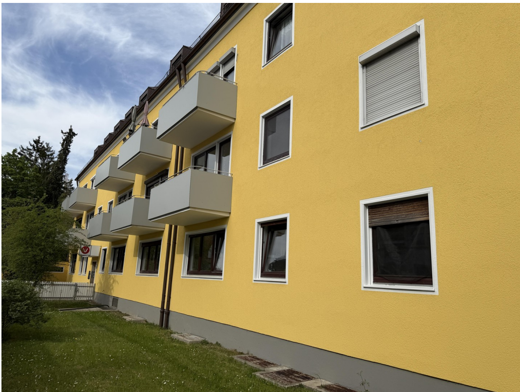
Ansicht Seite Habacher Str.