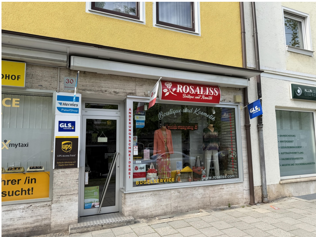
Laden Waldfriedhofstr. 30