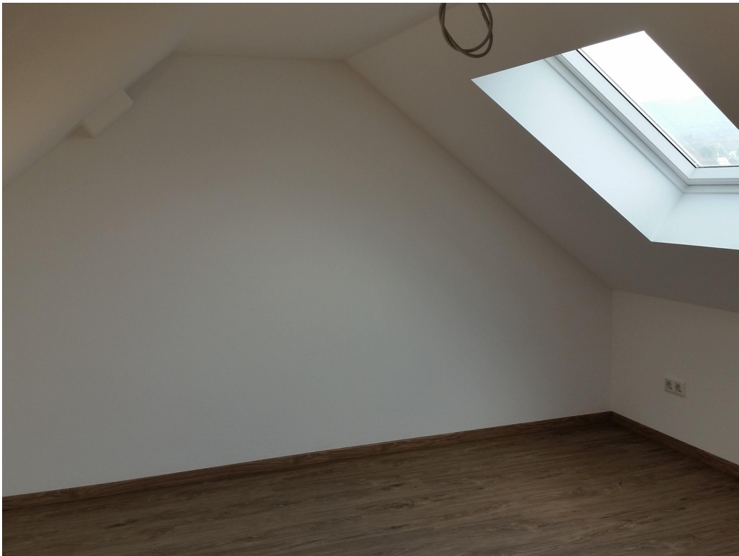
Spitzboden mit großen Fenstern