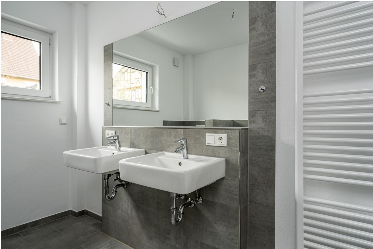
Badezimmer mit 2 Waschbecken