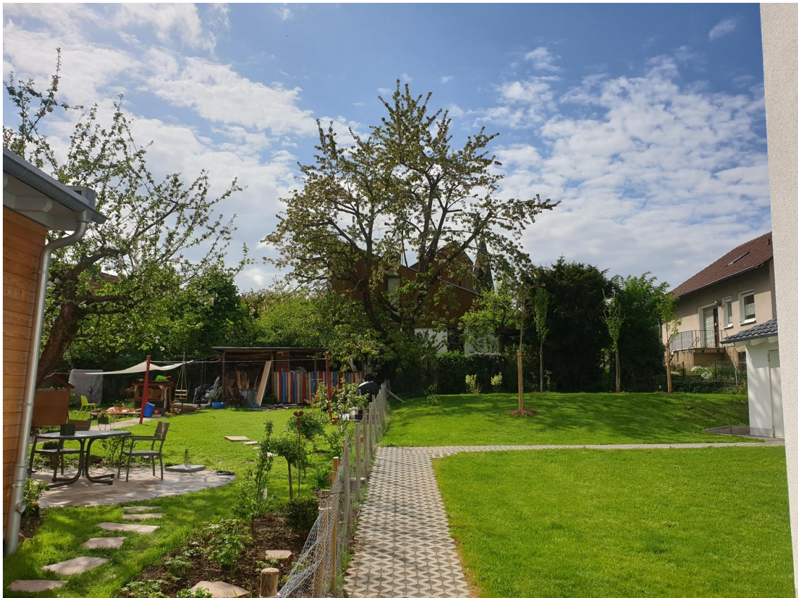
Blick Richtung Garten