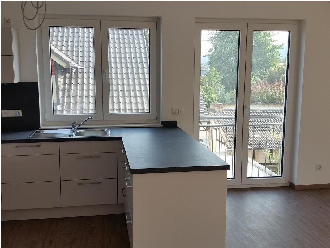
Hervorragend belichtete Küche