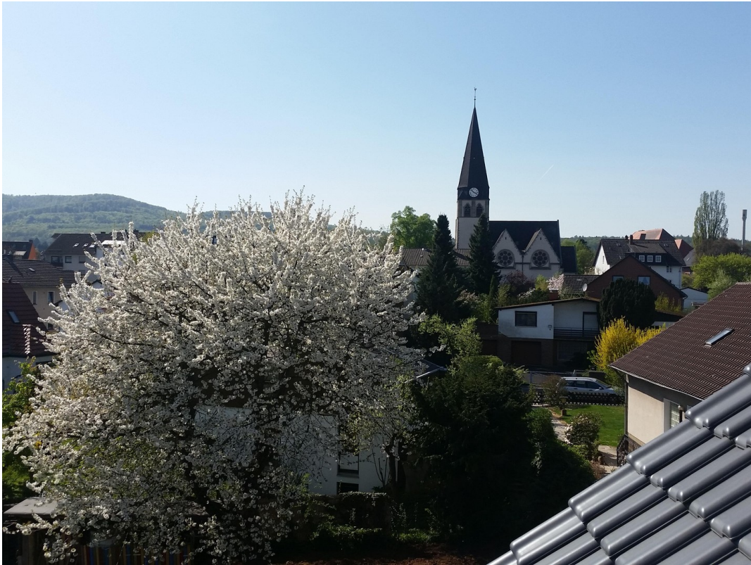
Kirschbaumblüte vom Spitzboden