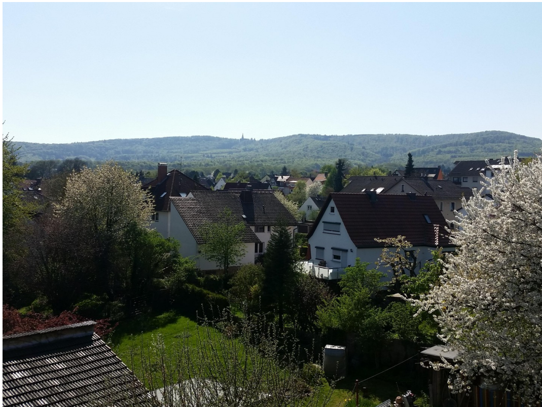
Panorama über Harleshausen