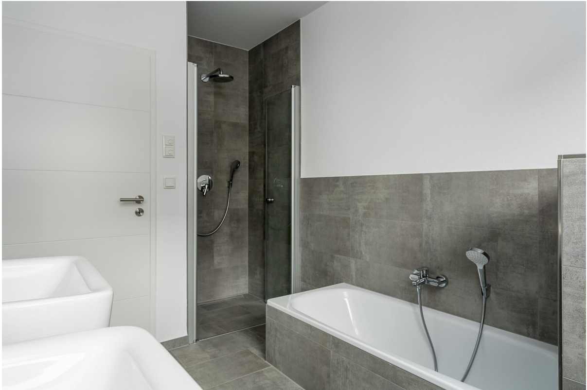
Badewanne und Dusche