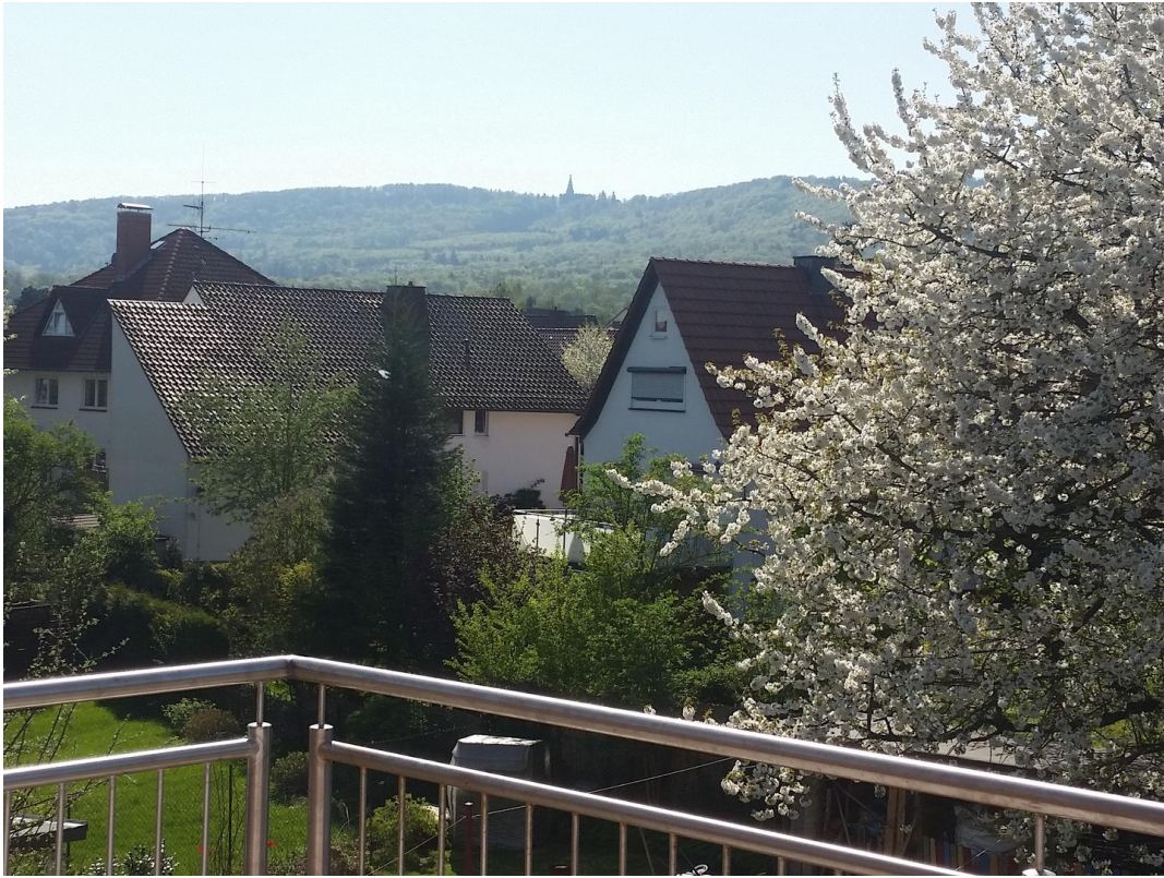
Kirschenblüte vor dem Herkules