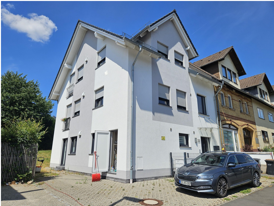
Ansicht Harleshäuser Straße