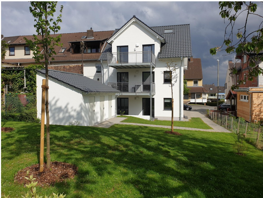
Westansicht mit Abstellräumen