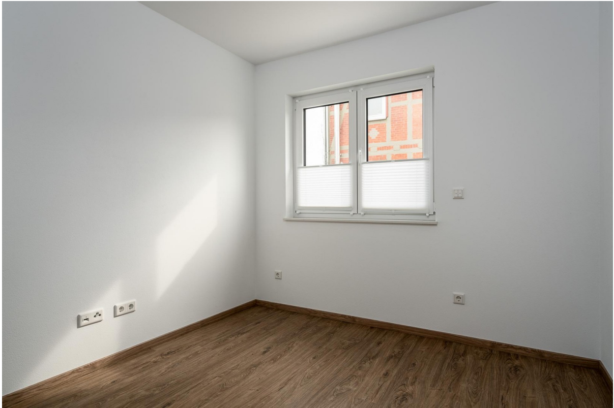
Schlafzimmer № 2