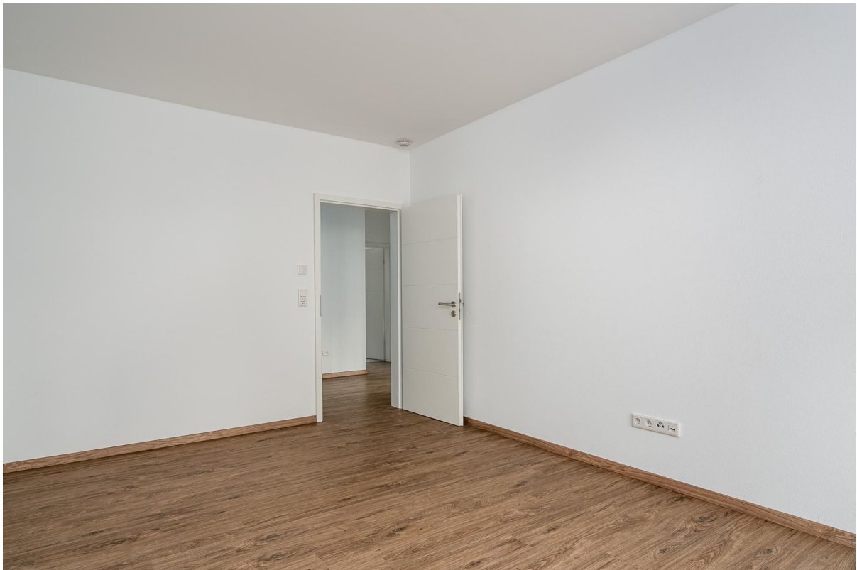
Schlafzimmer № 1