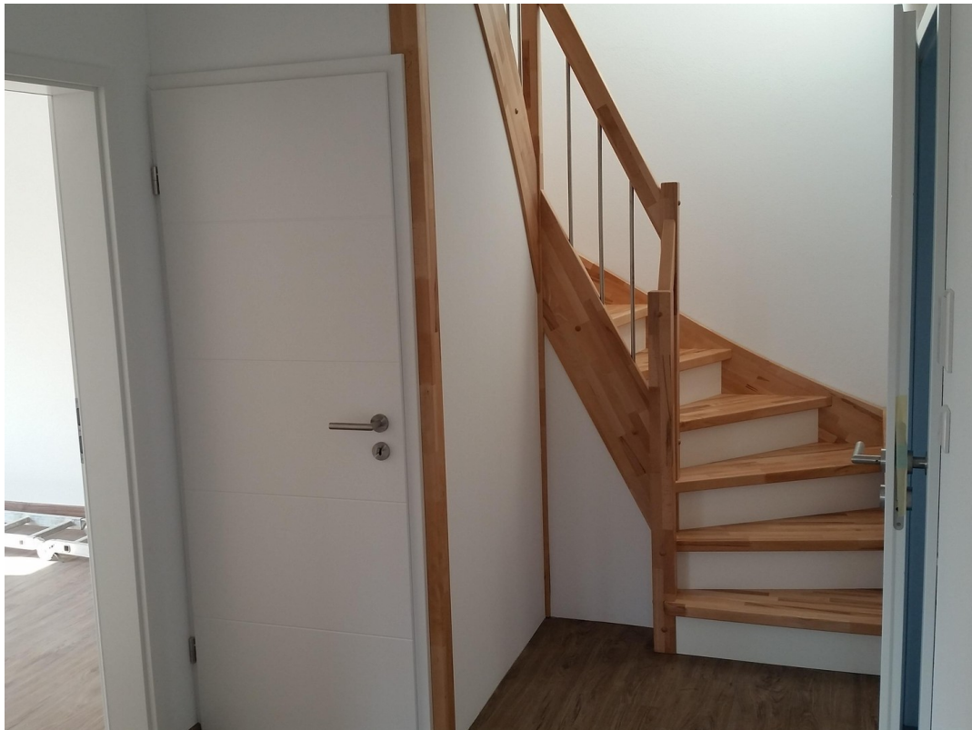
Treppe zum Spitzboden