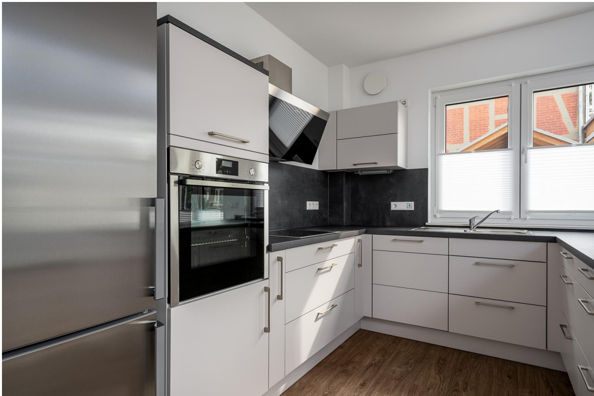
Küche im Detail