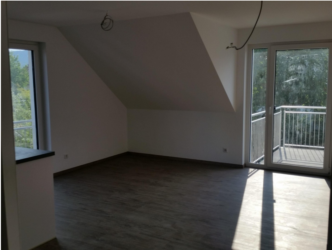
großes Wohn- und Esszimmer