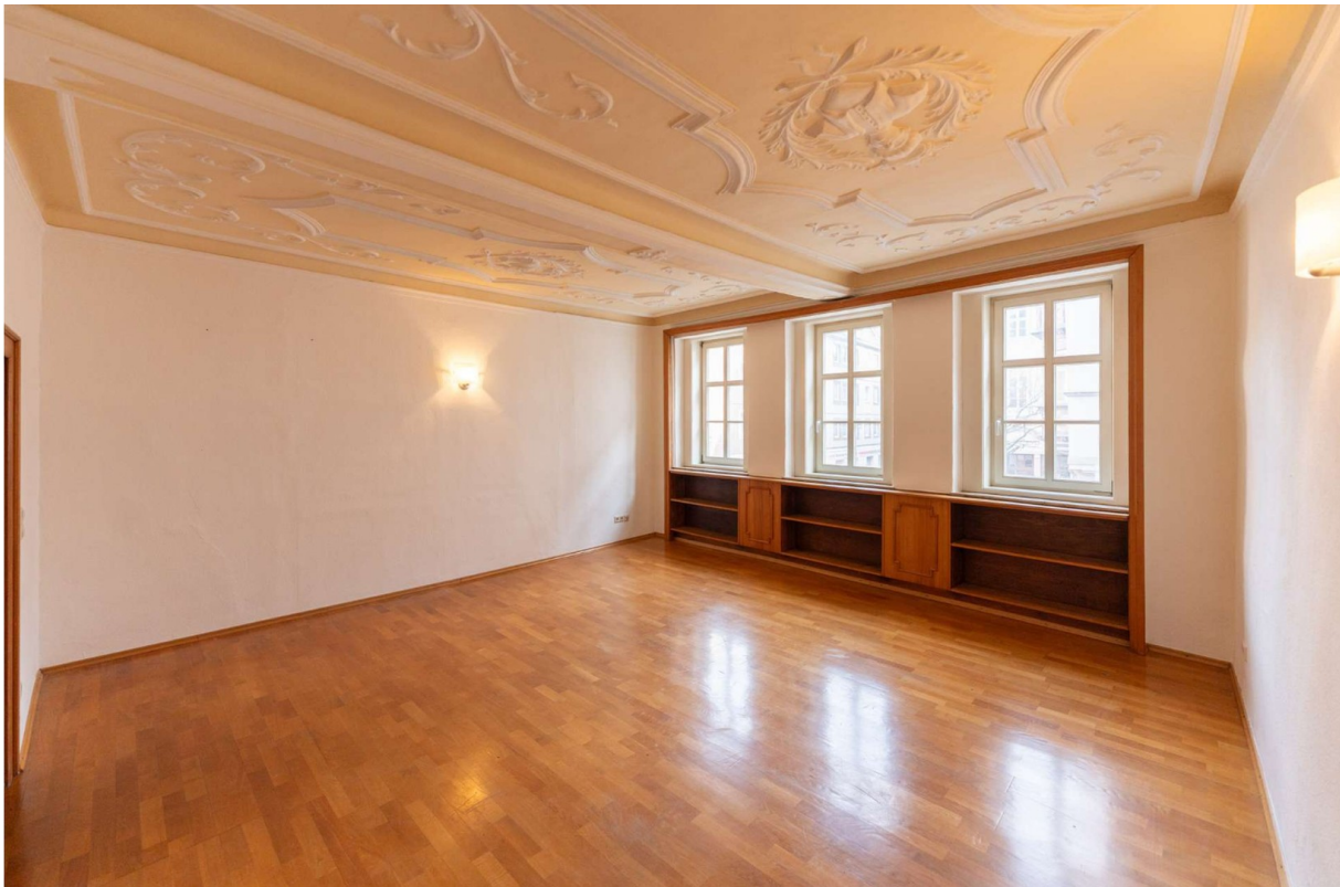
Wohnzimmer 2, 1.OG