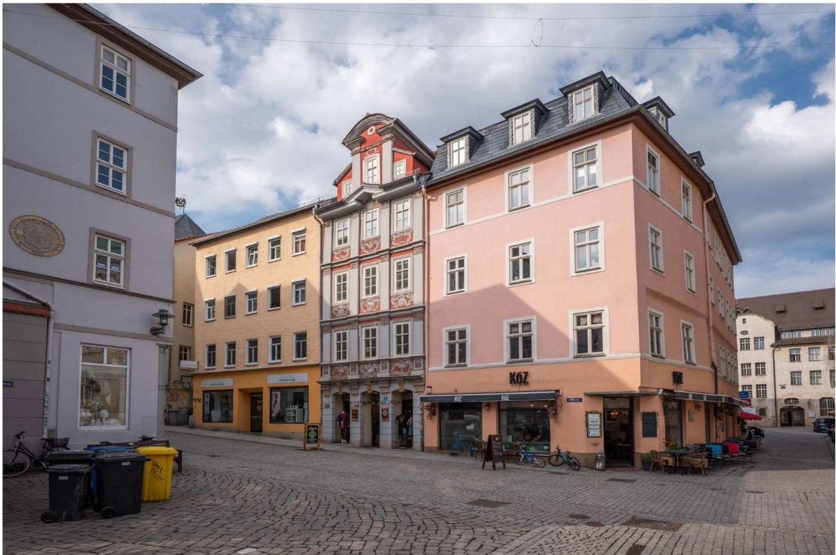
Vorderansicht Außen 2