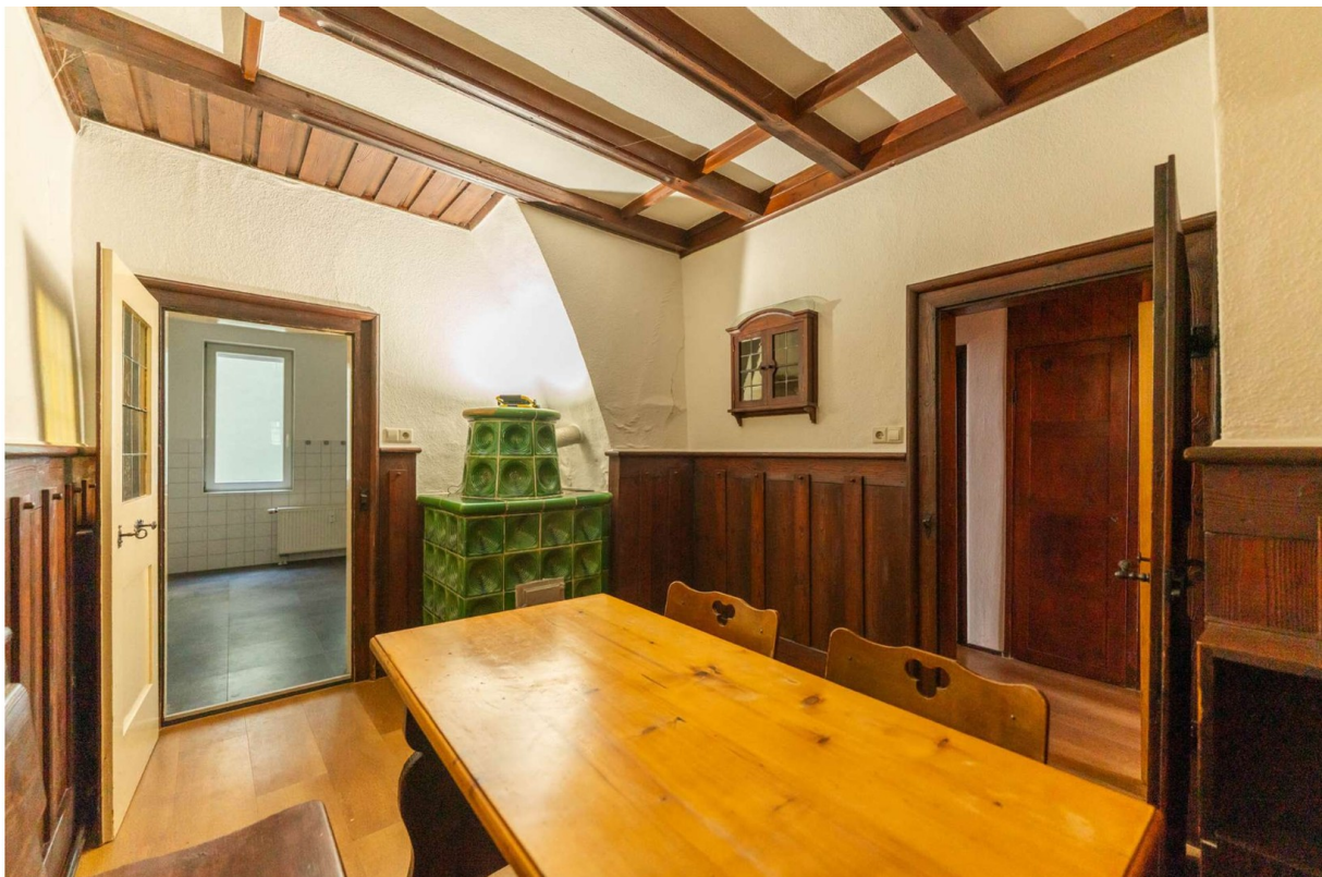
Essdiele 3, 1.OG