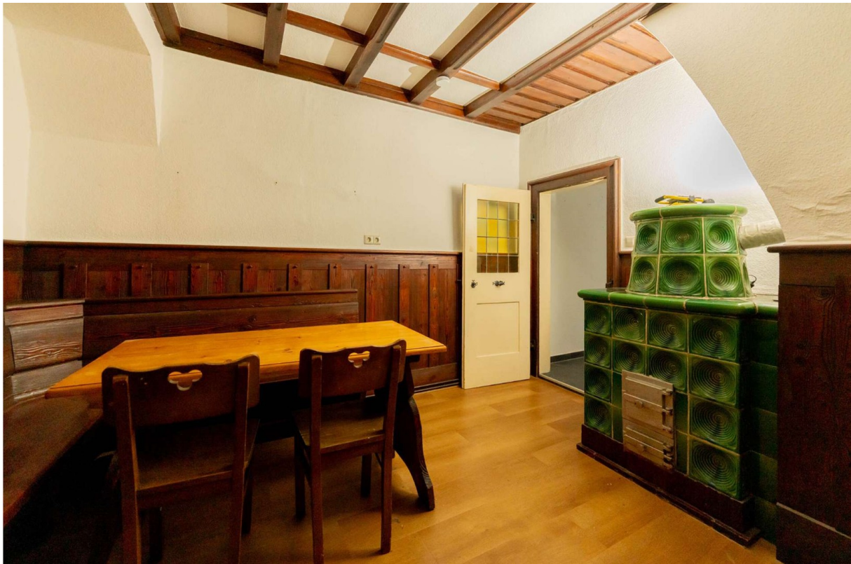
Essdiele 2, 1.OG