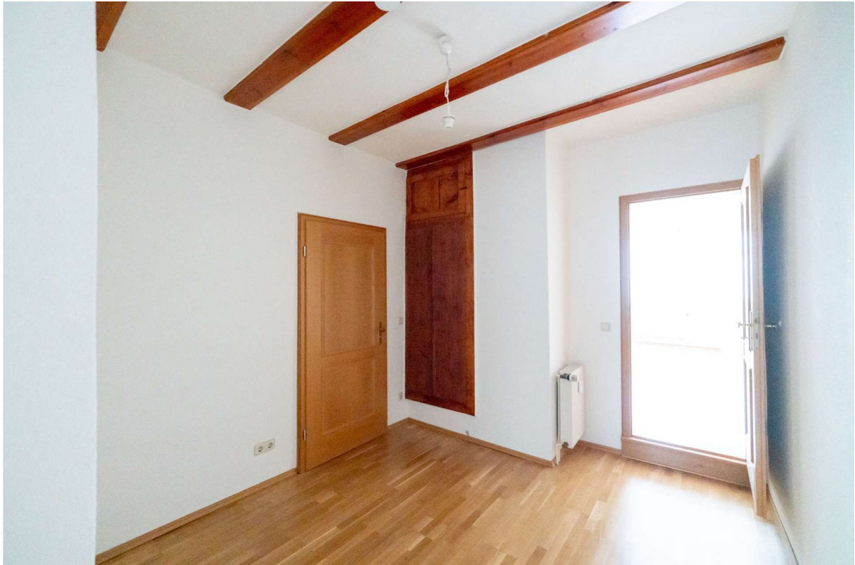
Durchgangszimmer 1, 2.OG