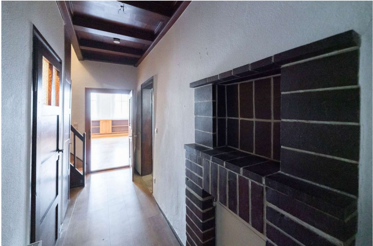
Wohnungseingang 1. OG