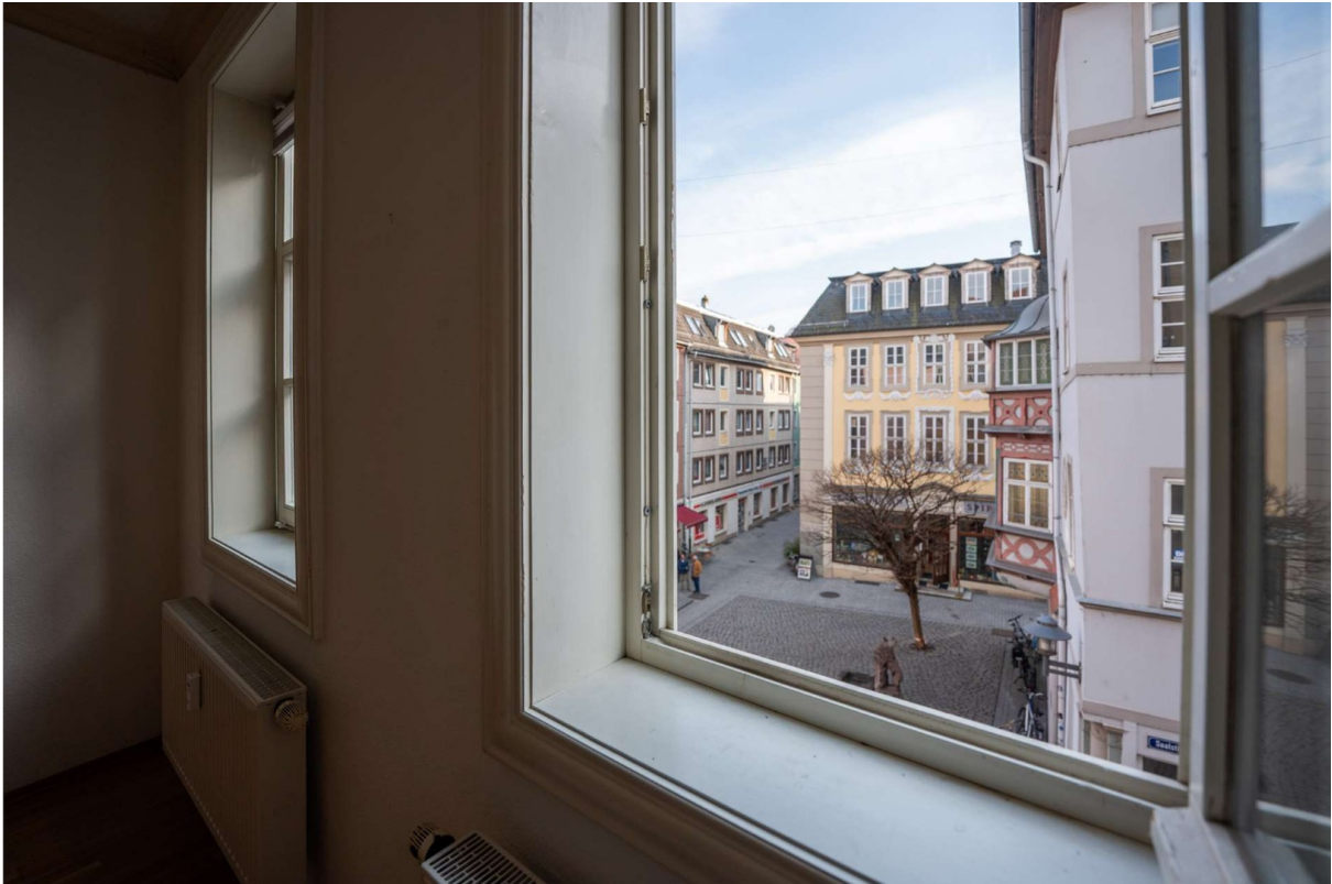
Blick aus Wohnzimmer 1.OG