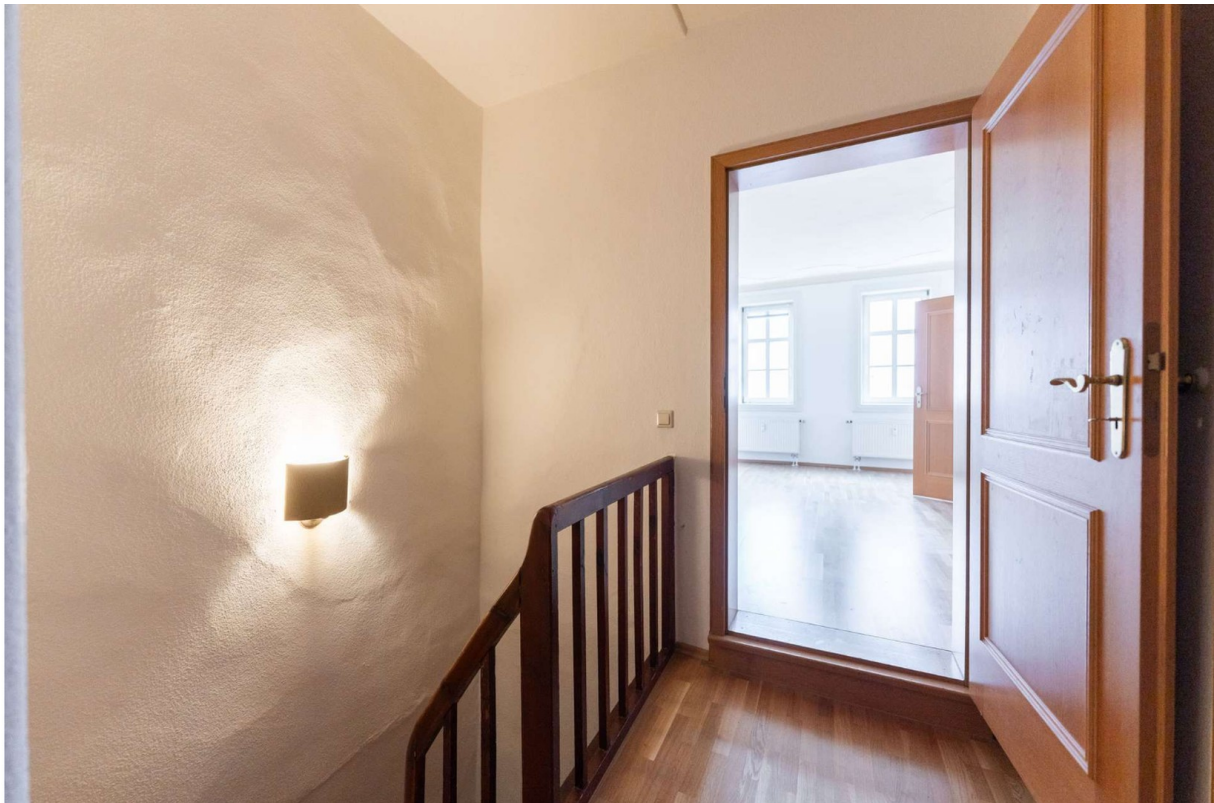
Flur zu Wohnzimmer 2.OG