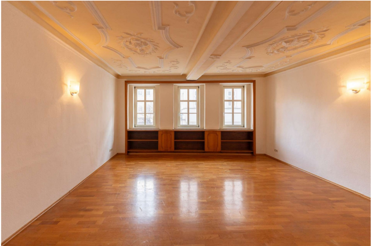
Wohnzimmer 1, 1.OG