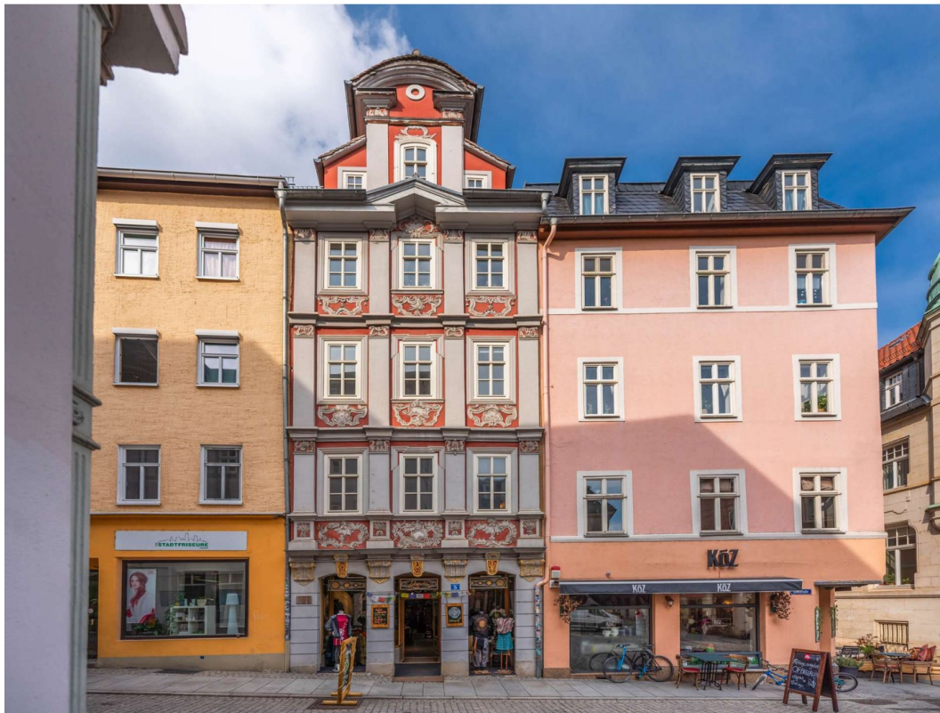
Vorderansicht Außen 1