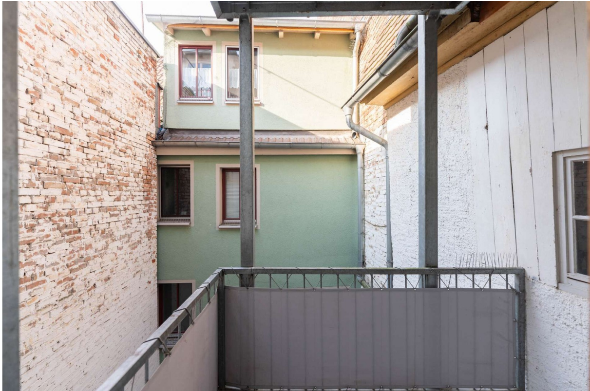
Balkon zum Innenhof