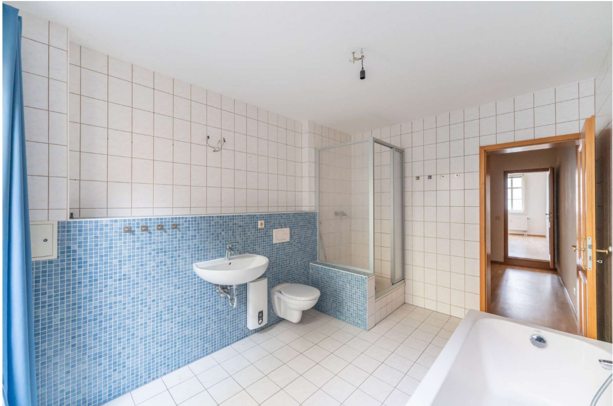
Badezimmer 1, 2.OG