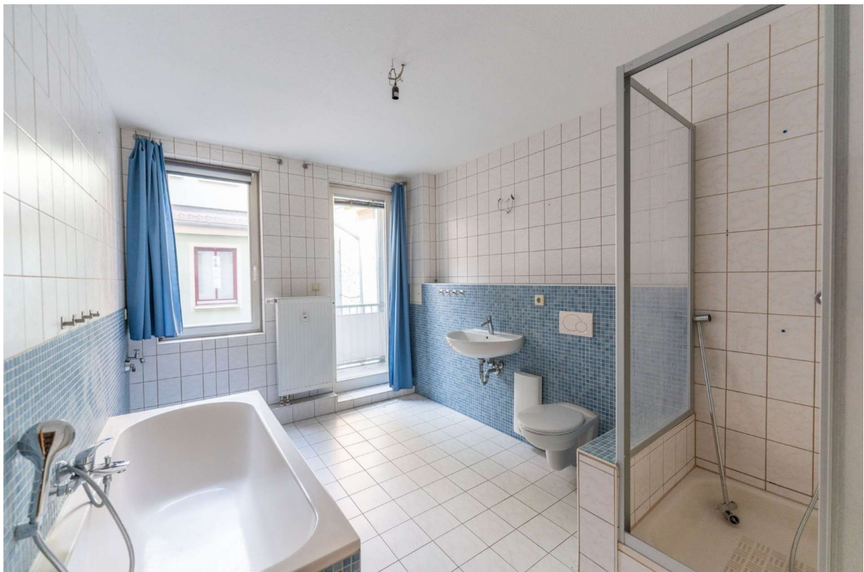
Badezimmer 2, 2.OG