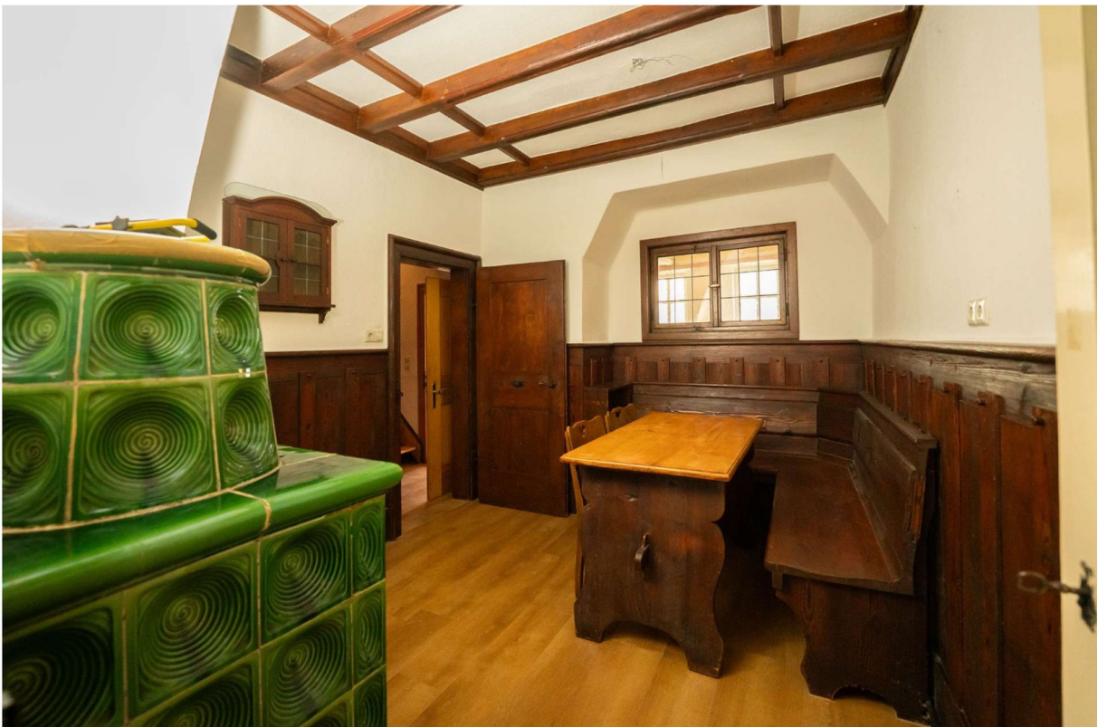
Essstiele 1, 1.OG