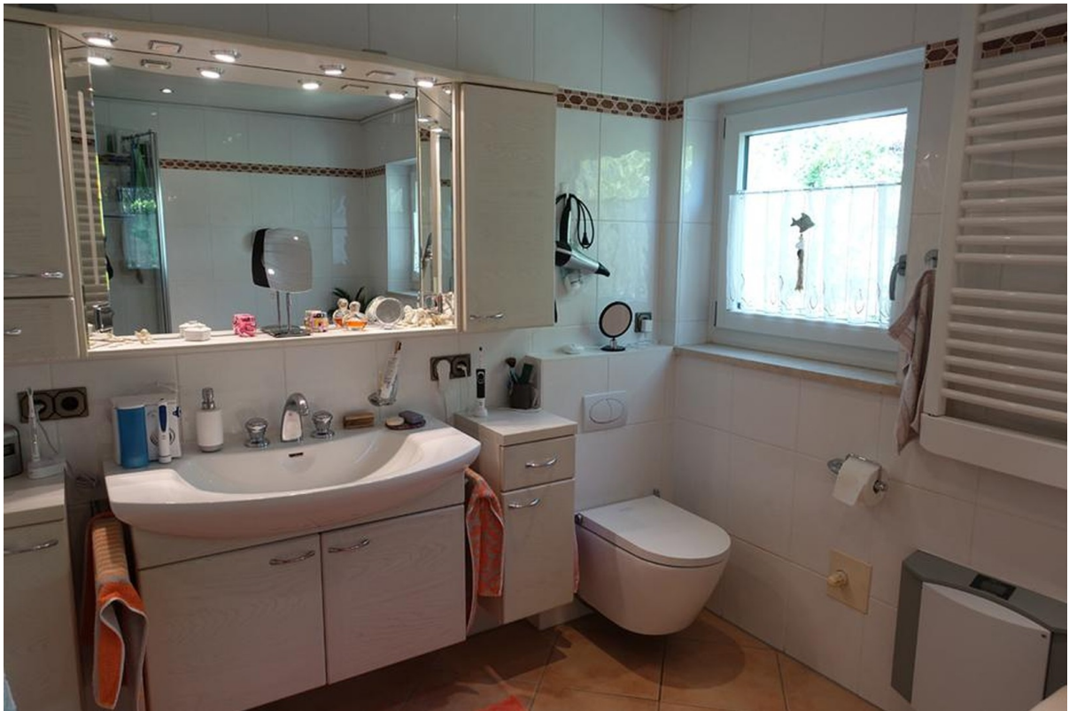
Bad OG 1