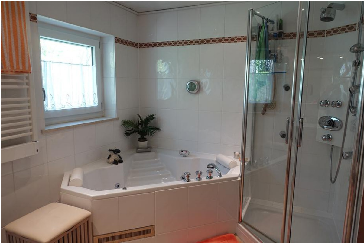
Bad OG 2