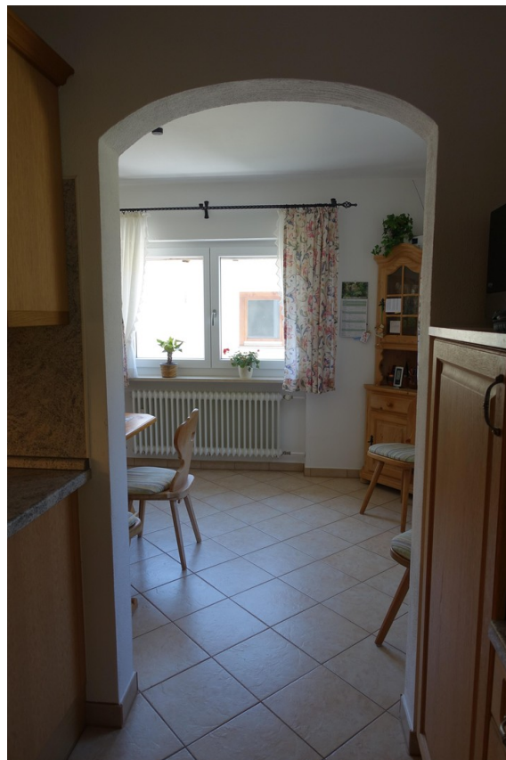
Blick Küche in den Essraum