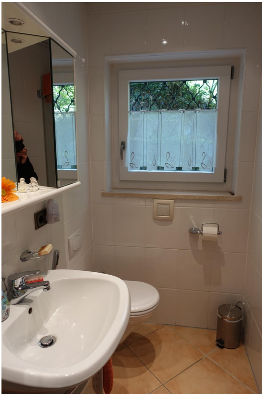
Bad UG 1