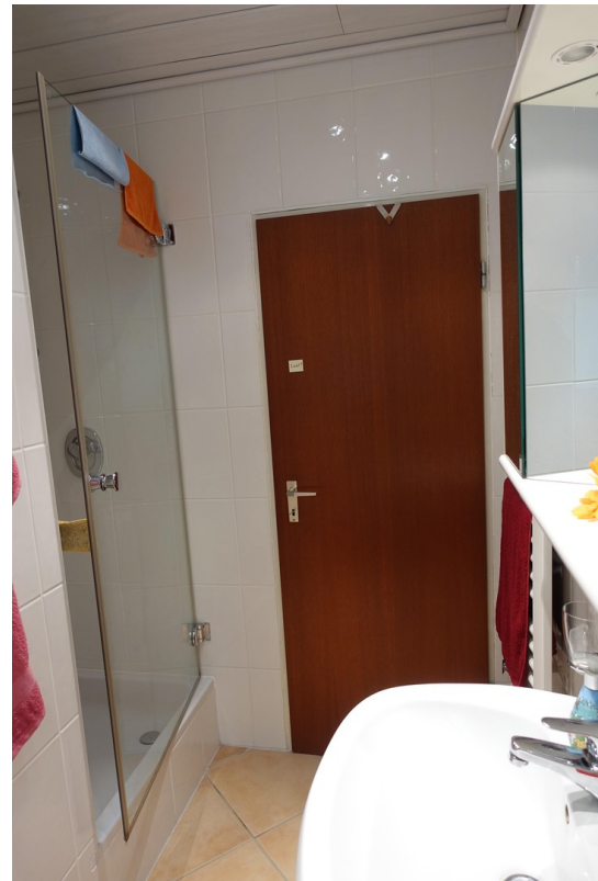
Bad UG 2