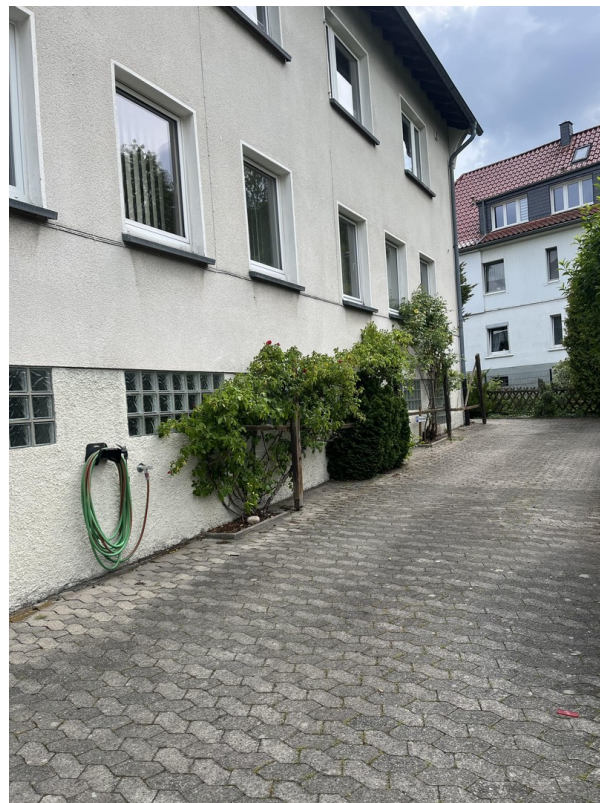
Parkplätze am Haus