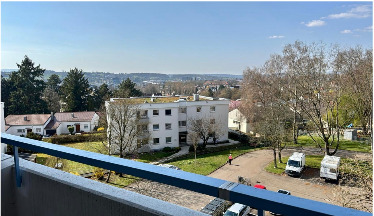
Weitblick vom Balkon