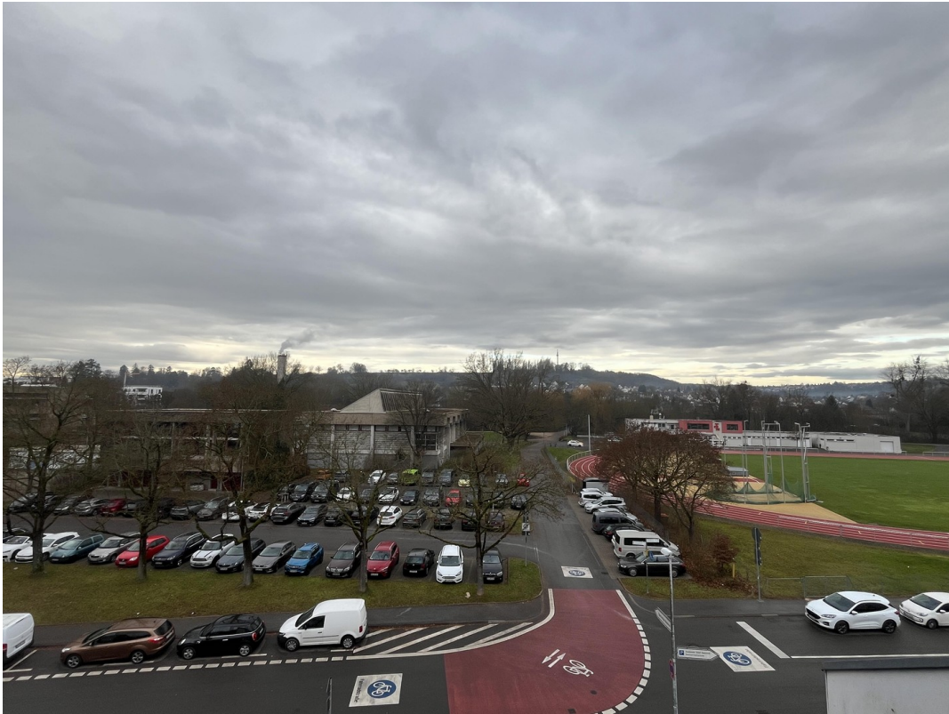
Blick aus dem Fenster