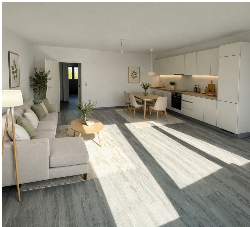
2_Wohnzimmer mit offener Küche